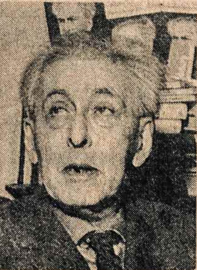
SENAS NUKRYPĖLIS: Ilya Ehrenburgas.

Tokia sovietinės spaudos istorija rodo, kad bolševikų provokacijos ir kaltinimų metodai nepasikeitė nuo Berijos laiku.