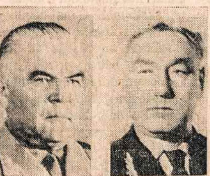
MALINOVSKIS IR BIRIUZOVAS

ka: vietoj marš. M.V. Zacharovo, seno bolševiko, paskyrė marš. S. A. Biriuzovą, 59 m. raketinių jėgų viršininką. Paskyrė tuo metu, kada apsaugos ministeris K.I. Malinovskij, kuris yra konvencionalinės kariuomenės šalininkas, lankėsi Indonezijoje. Panašiu būdu 1957 buvo atleistas marš. Žukovas, kada jis lankėsi Jugoslavijoje.