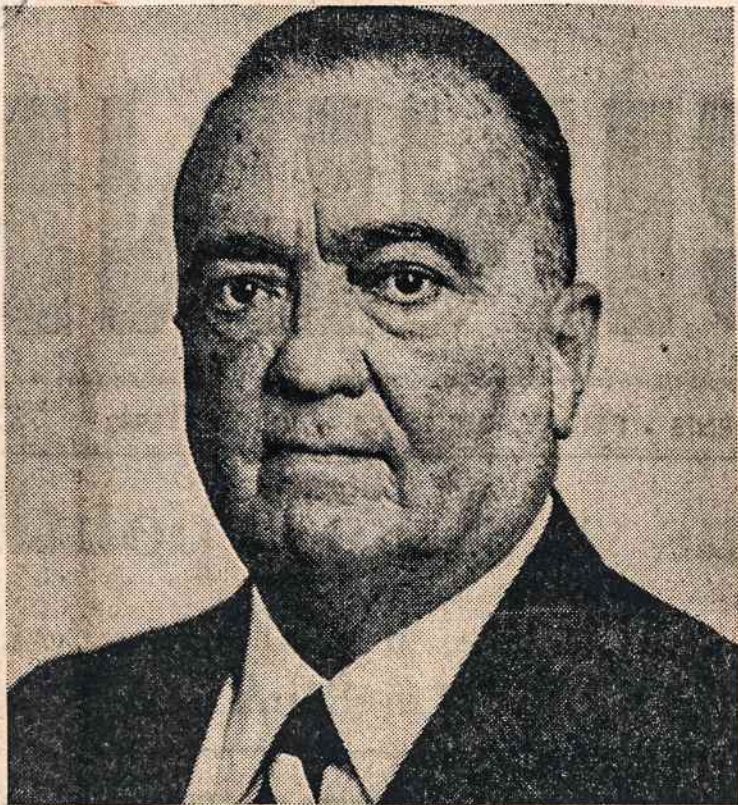
JOHN EDGAR HOOVER

Paskaičius šį FBI direktoriaus kreipimąsi, tenka labai susimąstyti ir pasižvalgyti aplinkui. Prisimintina pirmoji Sovietų okupacija Lietuvoje, kai paleisdavo net Sibiran suimtuosius, išprievartavę iš jų šnipinėjimui parašus. Tada jie pirkdavo šnipus už laisvės ir gyvybės kainą. Užsitiesus okupacijai, ar nepradėjo jie pirkti savo agentų mūsų tėvynės ir artimųjų ilgesio kaina? Jei tada vidunaktį areštuotą žmogų, atsigabentį į policiją, vertė šnipinėti savo brolių ar net tėvą, tai ar jie praleis progą iš šio krašto pas juos nuvykusi versti šnipinėti ne atskirą asmenį, bet stipriausią rusų priešą — Ameriką? Jeigu ir neprivers šnipinėti, tai ar nepaskatins vykdyti, gal ir sunkiai pastebimą, tautinio sabotažo akciją, plėsti mūsų nesugyvenimo ir asmenų niekinimo erzelį. Judų ir pardsavėlių visokių esama. Jeigu asmuo prašo te-