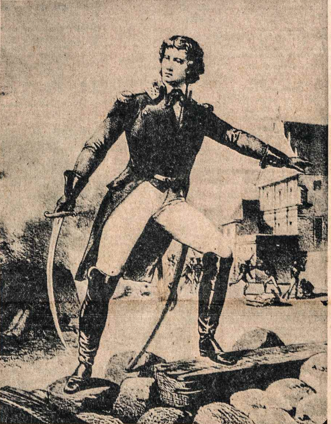
GEN. JOKŪBAS JASINSKIS, vadovavęs Lietuvos kariuomenei 1831 sukilime.

Jaunimas, nenorėdamas patekti rusų kariuomenės tarnybon ir tarnauti porą dešimčių metų, pasišalino į girias. Grio-se besislapančių jaunuolių būriai privertė sukilimą paskubinti. Lietuvoje prasidėjo užpuolimai rusų dalinių, kurie gabenjo jaunuolius — rekrutus Rusijon.