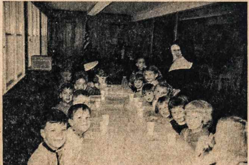
VAIKŲ darželis Bedford, N. H.