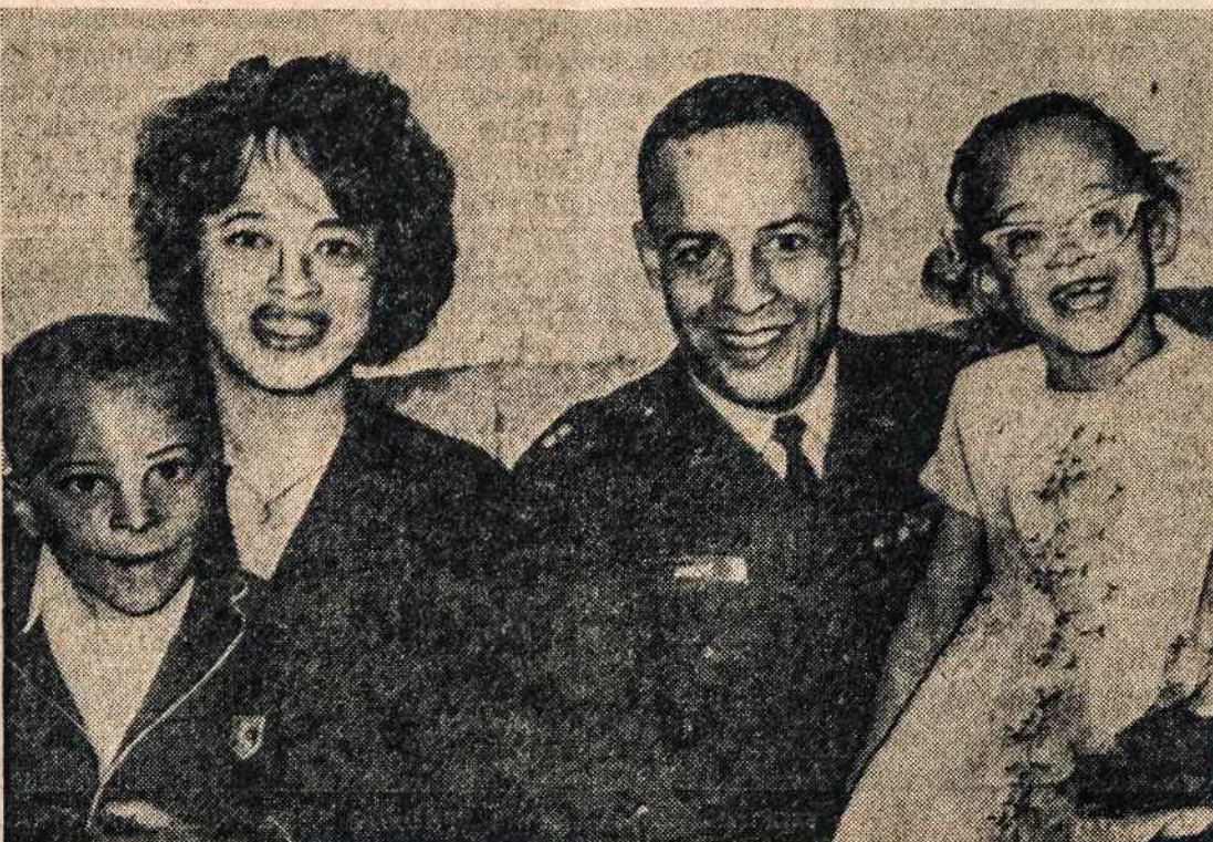
KAPITONAS EDWARD J. DWIGHT, pirmasis negras, parinktas kandidatu į astronautus, savo šeimos tarpe.

Kpt. Ed. J. Dwight, Jr. aviacijon išstojo 1953, baigęs Kansas City kolegiją. 1955 jis buvo paskirtas pilotu ir sprausminių lėktuvų instruktorium. Dvejus metus praleido Japonijoje kaip bombonešio B57 pilotas. Dabar su kitais bus apmokytas tolimųjų erdvių pilotų mokykloje. Mokslas prasidės birželio 17 ir tęsis 7 mėnesius. Po to jis tikisi, kad galės pakilti, kaip pirmasis negras astronautas, į tolimąsias erdves.