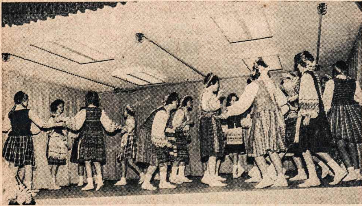
MARQUETTE PARKO mokyklos mokinės šoka: nuotraukoje 5-7 skyrius.