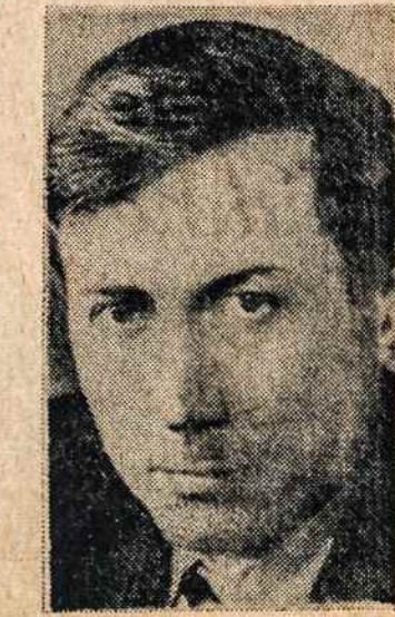
JAUNAS NUKRYPĖLIS: Evtušenko.

Prancūzijos angliakasiai priėmė vyriausybės siūlymą pakelti atlyginimą 8 proc. Dabar jie gauna 100-130 mėnesiui.