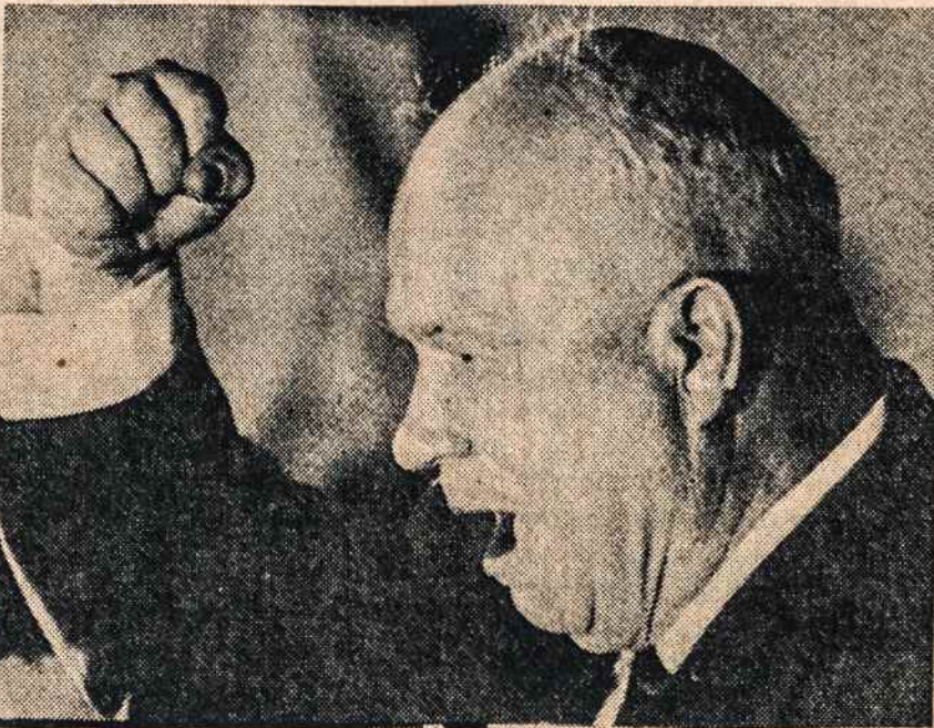
CHRUŠČIOVAS: Partija negalėtingai stos prieš ideologinį susyviravimą...

— Vyriausybė dar nenusistatėsi dėl Guatemalos vyriausybės pripažinimo.