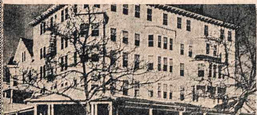
Viešbutis NIDA, prie Atlanto, atdaras visus metus Asbury Park, N. J. • 7-tos ir Park Ave. kampe • Tel.: PR 4-7788