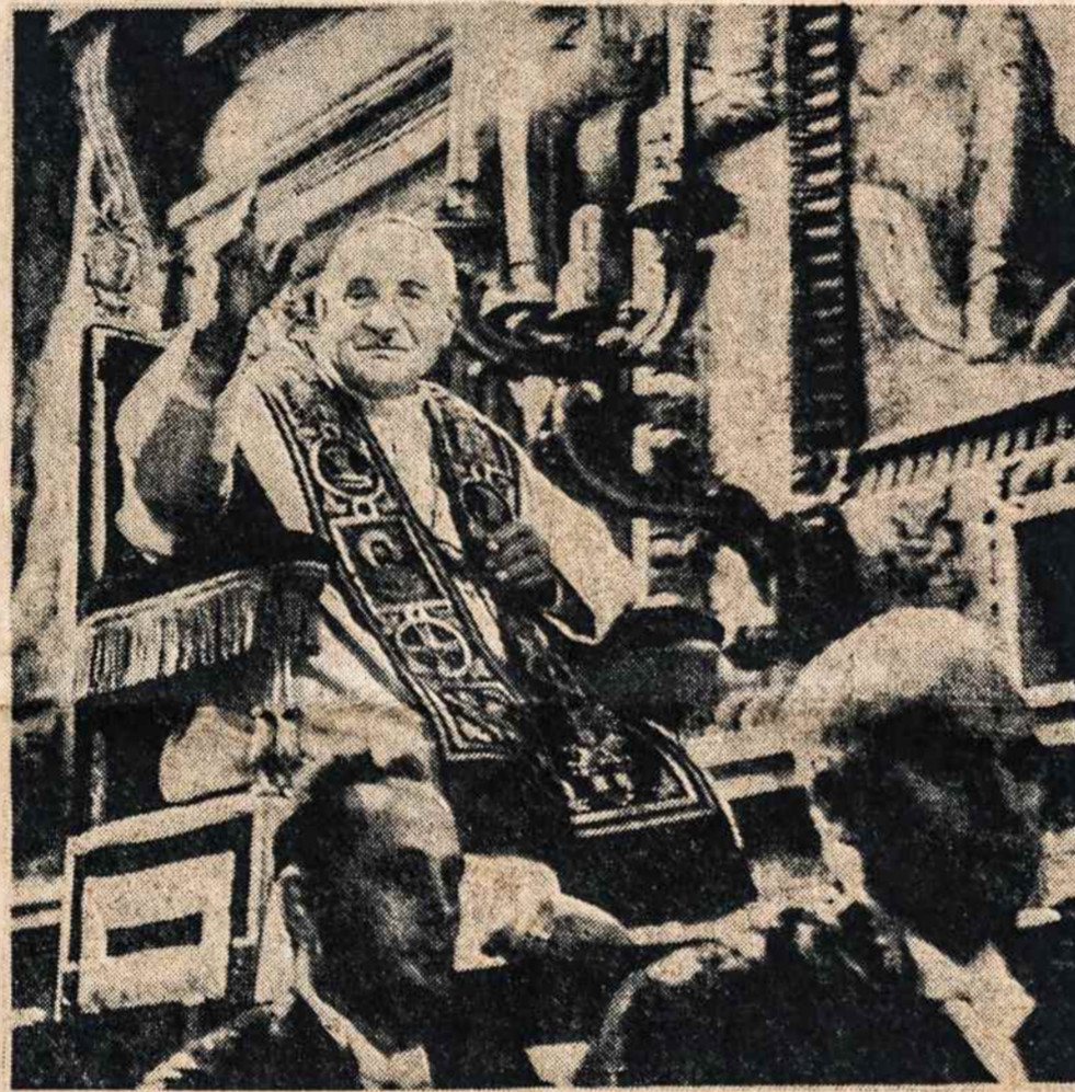
JANAS XXIII enciklikos "Pacem in terris" pasirašymo dieną.

Vokietijos kancleris Adenaueris balandžio 10 paskelbė, kad iš pareigų pasitrauks spalio ar lapkričio mėn.