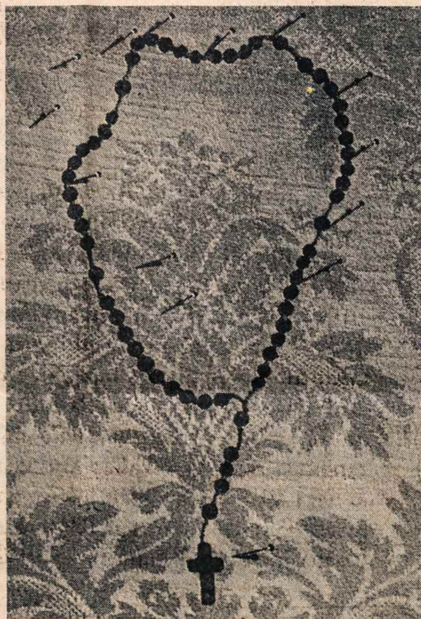
SIBIRO lietuvių iš duonos padarytas rožančius buvo išstatytas pasaulinėje rankdarbių parodoje Washingtone.