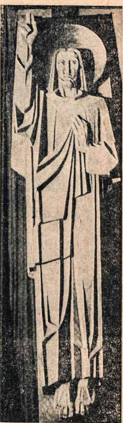
KRISTUS Maspetho lietuvių bažnyčios didžiajame altoriuje. Skulptūra dail. V. K. Jonyno.

Nustebusi žydų minia grįžo namo. Lozoriaus akys pamažėl pradėjo apsiprasti su šviesa; nutirpusios jo kojos atgijo, rankos laisvai judėjo. Apsukrioji Morta greitai paruošė pietus, geriau negu buvo galima laukti po keturių gedulos dienų, o prikeltais valgė kartu su seserimis ir draugais. Žiūrėdama į veidą, kuris ką tik nugalėjo mirtį, Marija beveik nieko nevalgė. O kai jis, nusišluostęs