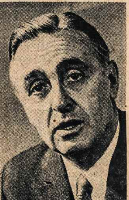
ABRAHAM A. RIBICOFF: Senatorius laisvesnis nei vyriausybės narys.