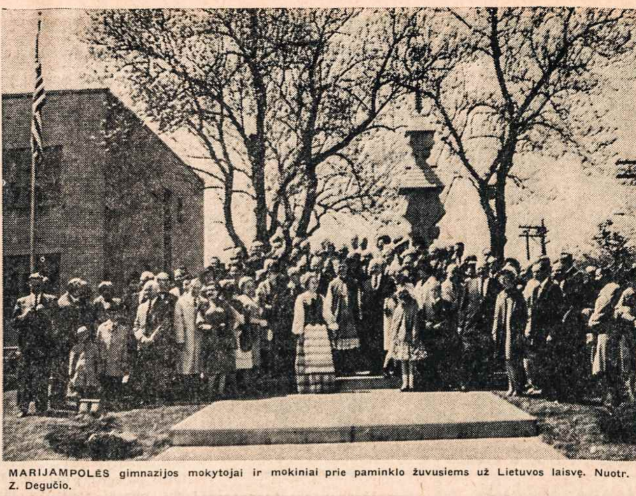
MARIJAMPOLĖS gimnazijos mokytojai ir mokiniai prie paminklo žuvusiems už Lietuvos laisvę.