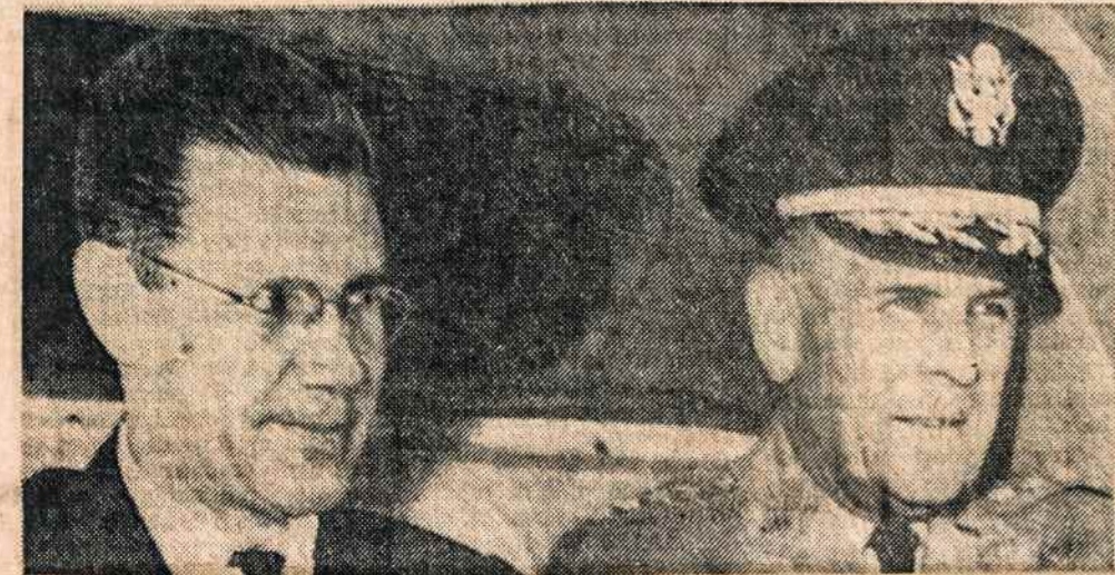
HONOLULU IS WASHINGTONO: aps. sekr. McNamara ir gen. Taylor.

Cambodia, Pietų Azijoje, Tailando, Laoso, Vietnamo kaimynė, lapkričio 19 paskelbė atsisakanti nuo Amerikos karinės bei ūkinės paramos. Per 10 metų tos paramos yra gavusi apie 365 mil.