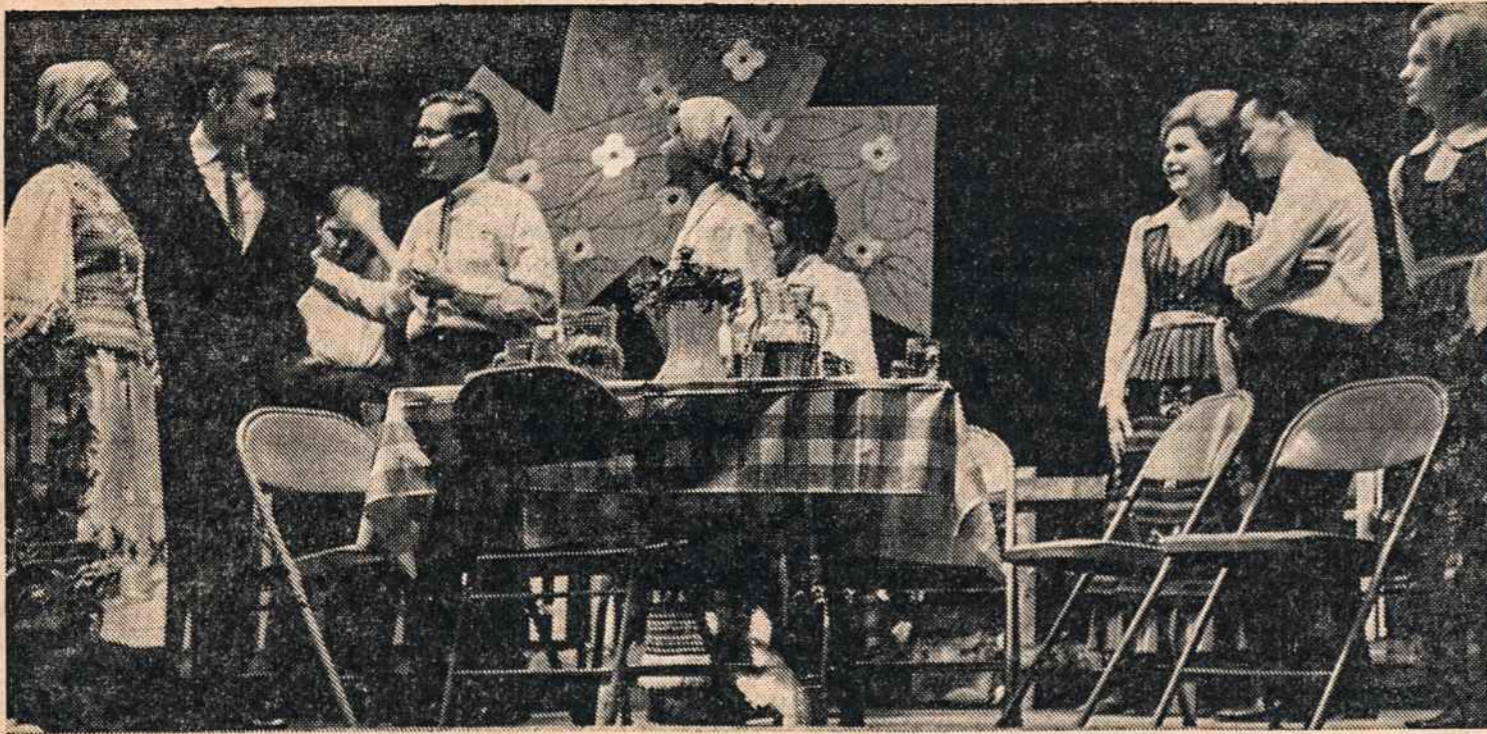
NEW YORKO vyčiai lapkričio 17 Apreiškimo parapijos salėje suvaidino rašytojo Antano Gustaičio "Sekminių vainiką".