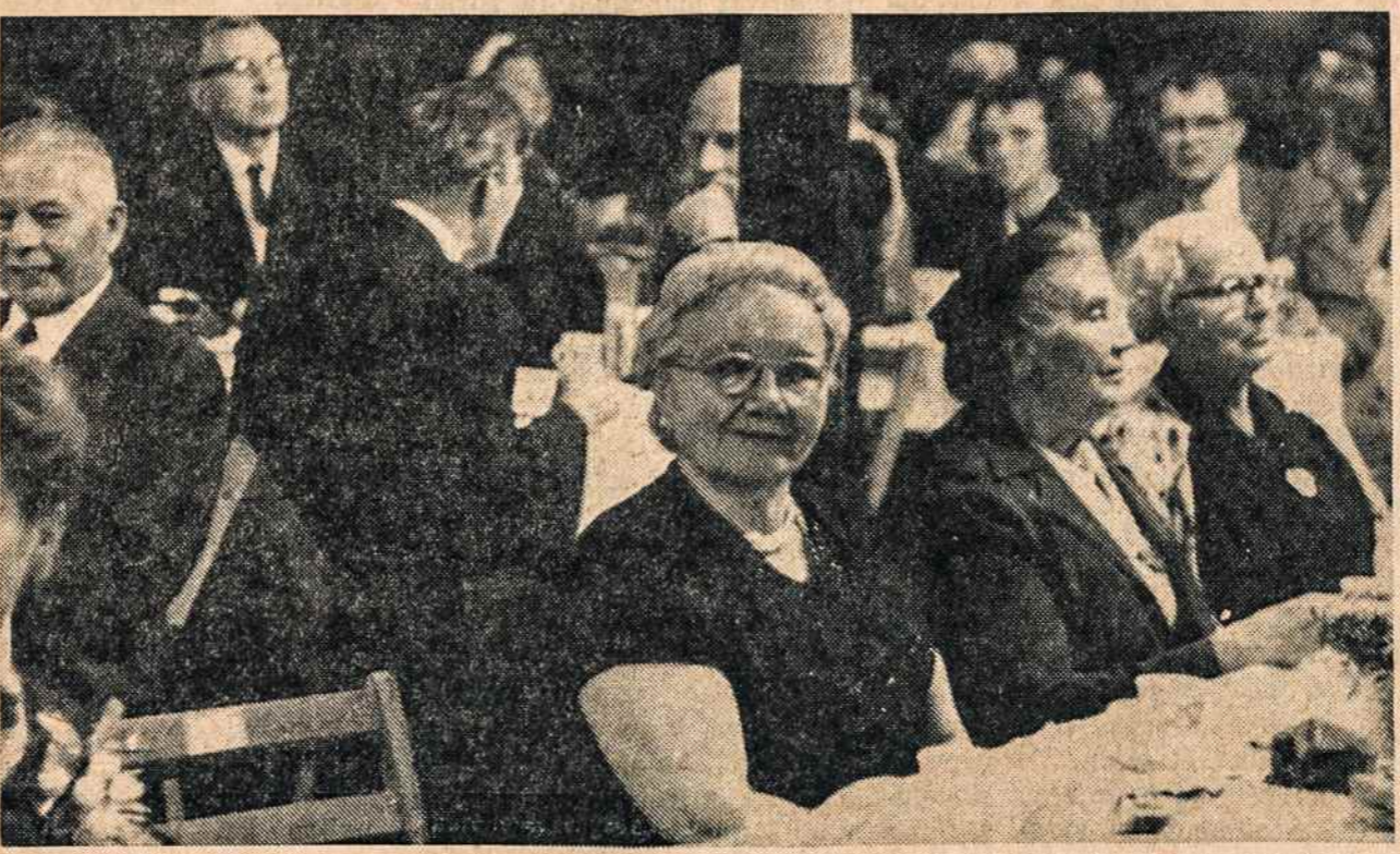
WOODHAVEN, N. Y. moterų būrelis surengė susipažinimo popietę Darbininko reikalams.

DABAR JŪS GALITE APLANKYTI savo artimuosius Lietuvoje.