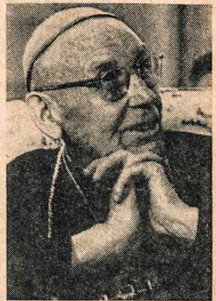
KARDINOLAS BEA, kuriam specialiai skirti ryšiai su kitais tikėjimais

Vatikano II susirinkimo antira sesija bus nutraukta gruodžio 4. Popiežius Paulius VI paragino paruošti ligi to laiko sprendimus. Lig šiol buvo klausimai referuojami, diskutuojami, tiriama ar sudarinėjama susirinkimo dalyvių nuomonė klausimais, kurie lieti Bažnyčios organizaciją, liturgiją, taktinius kai kurių tikėjimo tiesų formulavimus (ne pačias tiesas).