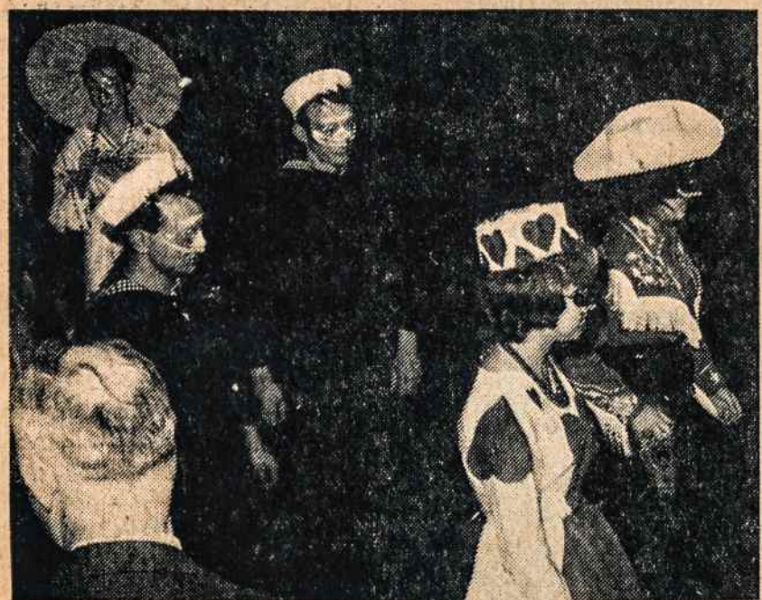
WATERBURY, CONN. Kaukių paradas iš praeitų metų balius. Nuotr. A. Balsio.

PATRICIA MURPHY Candlelight Restaurant — Route 25A Northern Blvd. and Port Washington Blvd., Manhasset. Hot popovers, honey buns, lovely garden, air cond. Diners club, banquet facilities; world famous flower clock. Open daily. Area code 516 MA 7-3742.