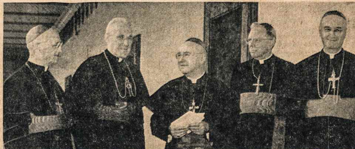
AMERIKOS KARDINOLAI visi susirinkime: McIntyre, Cushing, Spellmann, Ritter, Meyer.