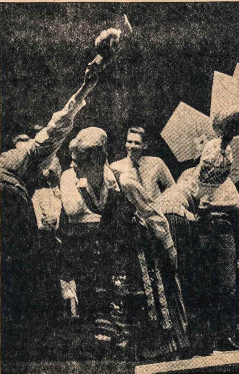
SCENA iš "Sekminių vainiko", suvaidinto lapkričio 17 Apriškimo parapijos salėje. Suvaidino New Yorko vyčiai.

Liet. Veteranų S-gos Ramovės New Jersey skyrius ir Liet. Bendruomenės Newarko skyrius lapkričio 24 rengia Lietuvos kariuomenės minėjimą. Už žuvusius karius mišios bus 10:30 v. Švč. Trejybės bažnyčioje. Pritaikintą pamokslą pasakys kun. dr. P. Celiešius. Tuojau po pamaldų programa bus salėje.