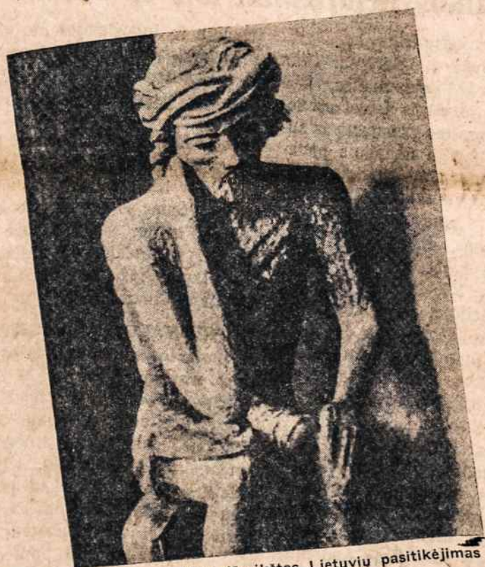
Vienoj sienoje bus išreikštas Lietuvos pasitikėjimas Kristumi. One wall will depict the Christian faith of the Lithuanians.

Your donation—large or small—will help construction work to be completed sooner.