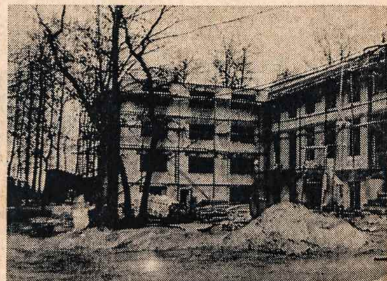
STATOMI VASARIO 16 gimnazijai nauji rūmai

1. Francas, 2. Kiminaitė, 3. Krivickaitė, 4. Mečionis, 5. Milinis, 6. Starkas.