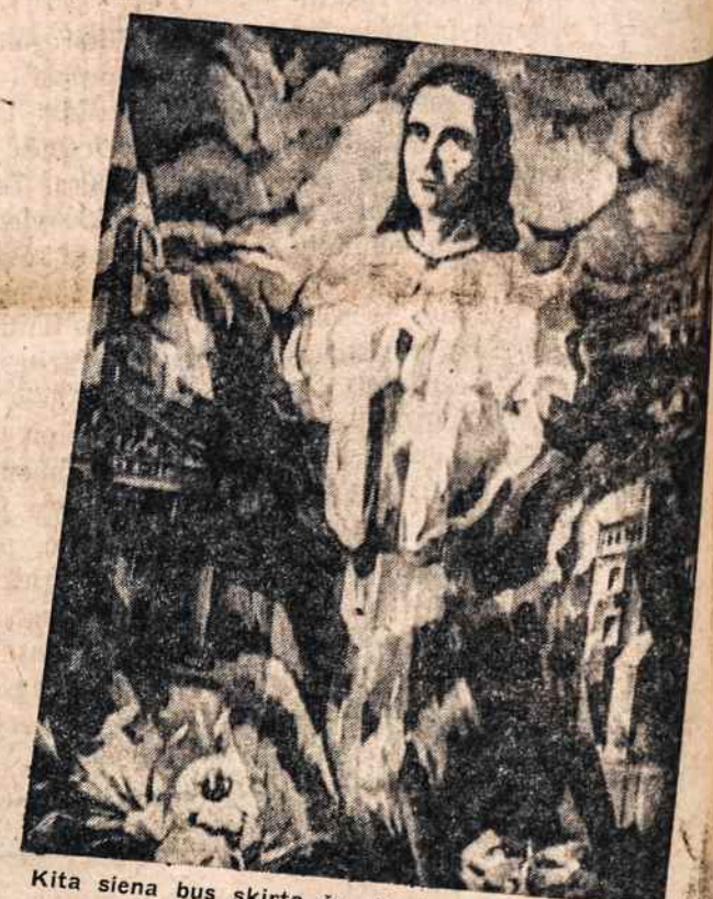
Kita siena bus skirta šv. Kazimierui ir Lietuvos krikščionybės augimui. Another wall will portray St. Casimir and the development of Christianity in Lithuania.