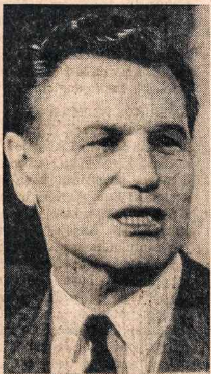
NELSON A. ROCKEFELLERIS

Amerikoje propaganda išsijususi sudarinėja opiniją apie taikingus Maskvos siekimus. Valdžios pareigūnai skelbia optimizmą, kad bendradarbiavimu su Maskva bus išlaikyta pasaulio taika. Tačiau atsiranda tokių, kurie tuo optimizmu nepatiki, laiko jį iliuzijom, mitais ir ima juos griauti. Šiuo kartu tokis pasirodė Nelson A. Rockefelleris savo straipsniu Look žurnale.