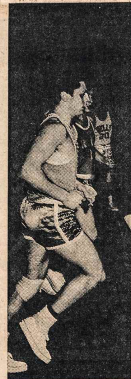
KENNEBUNKPORT, MAINE rungtynės šv. Antano gimnazijos sporto salėje

H. W. MALE CABINET MAKERS for large well established Woodworking Company in Jamestown, New York. Steady work, good wages, plus paid vacations, life insurance, hospitalization, sick benefits, etc. Apply or call collect - Frank Chase Cabinetmakers Inc., 22 Steele St., Jamestown, N.Y. (716) JA 4-7341