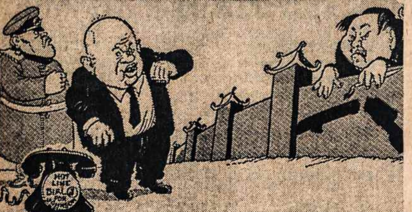
SENA IR NAUJA DRAUGYSTĖ: "Ei, ei, jis j mane žiūri, jis lipa jau pen sieną... Skambink draugui Johnsonui!"

— Eisenhoweris tarp visų kandidatų į prezidentus labiausiai remtų savo brolių Miltoną, antrojo vietoj eitų Scrantonas, Andersonas, Romney.