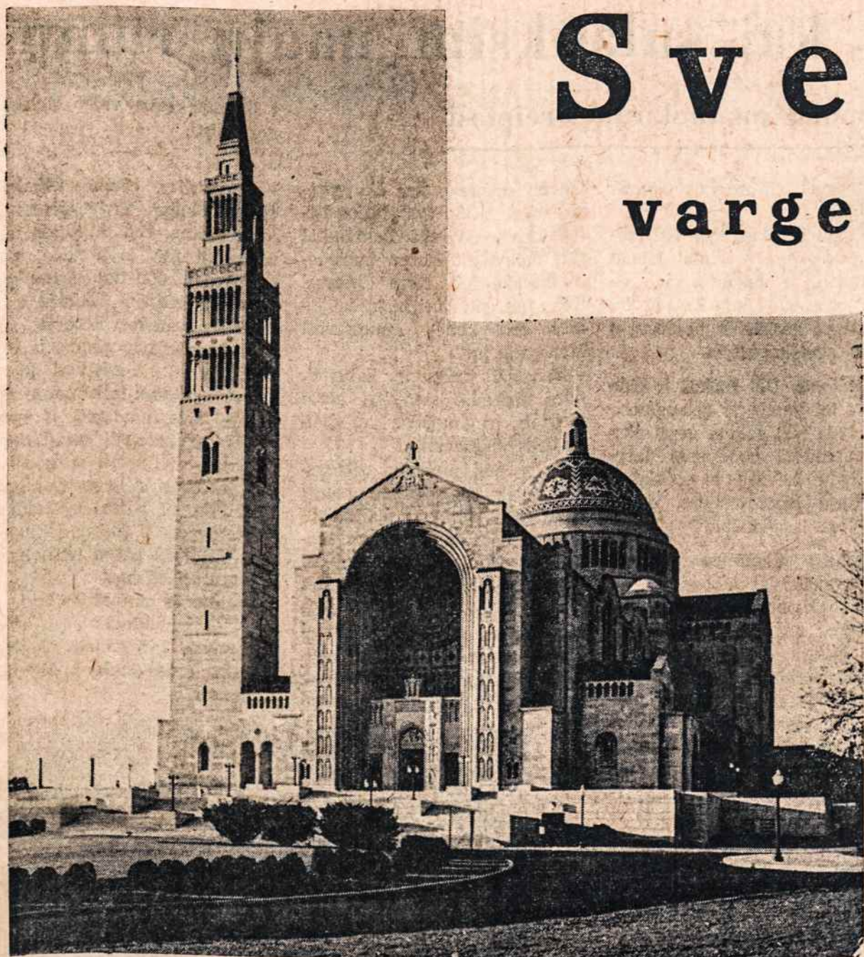
Šventovė, kurioje bus mūsų koplyčia