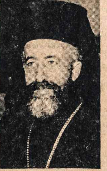
MAKARIOS, tuo tarpu Kipro prezidentas.

merikos vyriausybė sujaudino slaptos derybos tarp Chruščiovo ir Kipro prezidento Makarios dėl ginklų pristatymo. Graikija gaus iš Maskvos lėktuvų, patrankų ir kt. ginklų. Tai eina prieš visus susitarimus. Amerika pradeda žiūrėti, kad Kipras vis labiau krypta į komunistus ir Maskva nori jį paversti savo baze Viruržemio jūroje kaip Amerikoje yra Kuba. Prezidentas arkivyskupas Makarios rodosi klusnus Maskvos kvilingas.