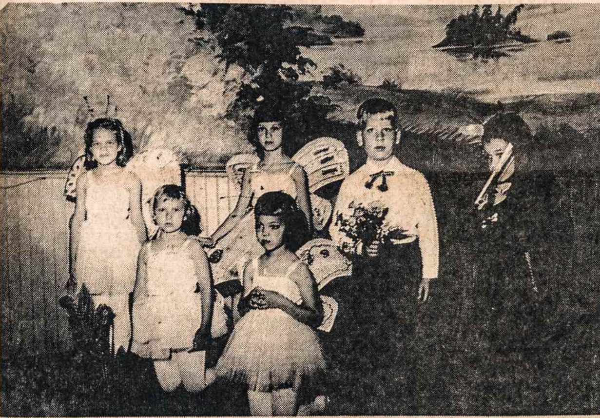
PHILADELPHIJOJE, PA., šeštadieninė mokykla vaidino "Ziedeliai mamytel"