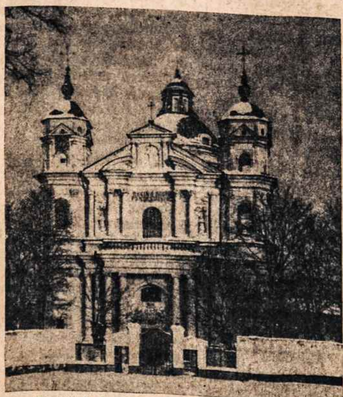
Koplyčioje bus istorinių ir kitų Lietuvos vaizdų. There will also be portrayals of Lithuanian religious art.

Aukas siųskite per savo parapijos kunigus arba tiesiai: