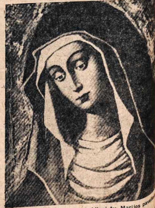
Koplyčioje tūps Lietuvoje stebuklingi šv. Marijos paveikslai. There will be reproductions of the Miraculous pictures of Our Lady in Lithuania.