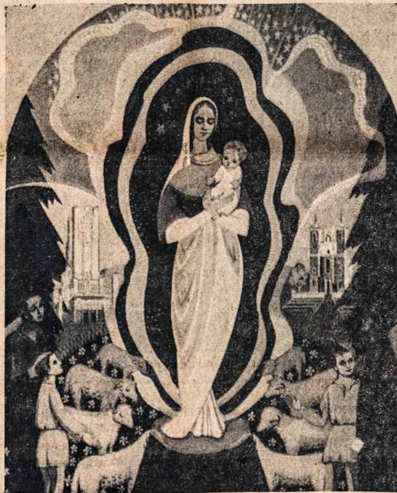
Koplyčioje bus šv. Marijos Apsireiškimo šiluvoje altorius. The Apparition of Our Lady in Šiluva — Chapel altar.