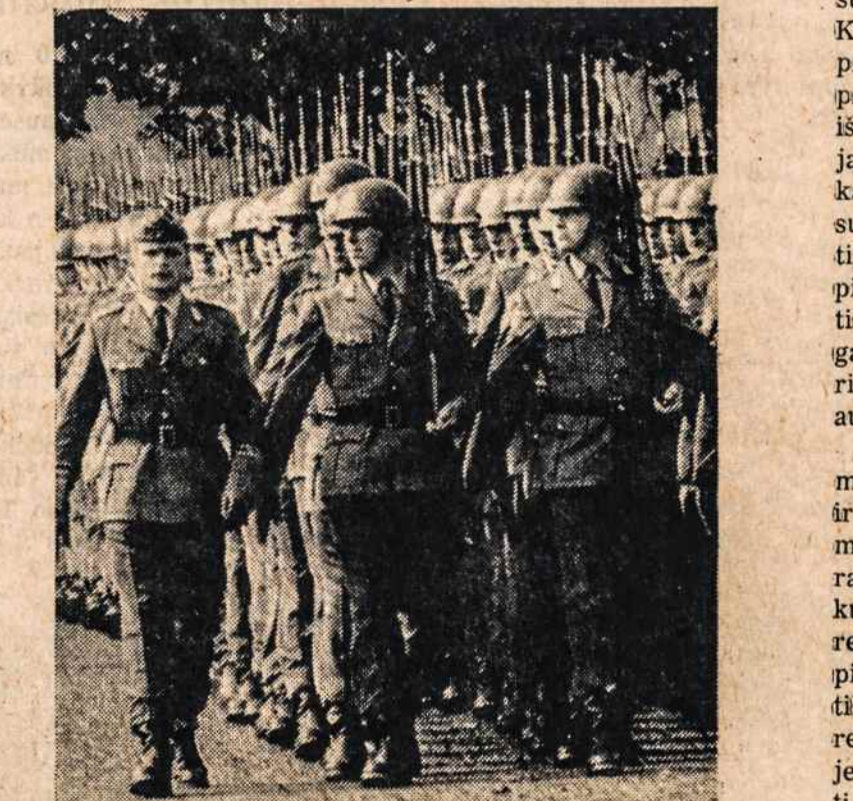
EUROPOS APSAUGA NUO SOVIETINĖS AGRESIJOS — Vokietijos kariuomenės jau yra 450,000.

versmą Rumunijos vyriausybei pakeisti ir Chruščiovą du kartus buvo slaptai atvykęs į Buchareštą, grasindamas pavartoti sovietų kariuomenę. Panašiai jis buvo grąšinęs Lenkijai 1956. Rumunai buvę jau aliaruoti priešintis visom priemonėm prieš Chruščiovo pasikesi-