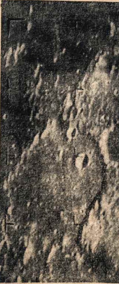
MENULIS IŠ 470 MYLIŲ. Ranger VII liepos 31 nutraukų padarė 4,000, pradėjo iš 1,300 mylių tolnu. Pirmas nutraukas padaręs sovietų lunikas, bet tik iš 37,000 mylių Ranger nutraukos 100 kartų aiškesnės nei lig šiol teleskopų ar iš lėktuvų. Televizijos kamerom veikti buvo signalas iš žemės. Ranger skrido 68 val. 35 min. padarė 243,665 mylias. Kitos dvi raketos bus paleistos šių metų pabaigoj ir kitais metais.

kurstytojas, pasirodė atvykęs iš Manhattano su agitaciniais lapeliais.