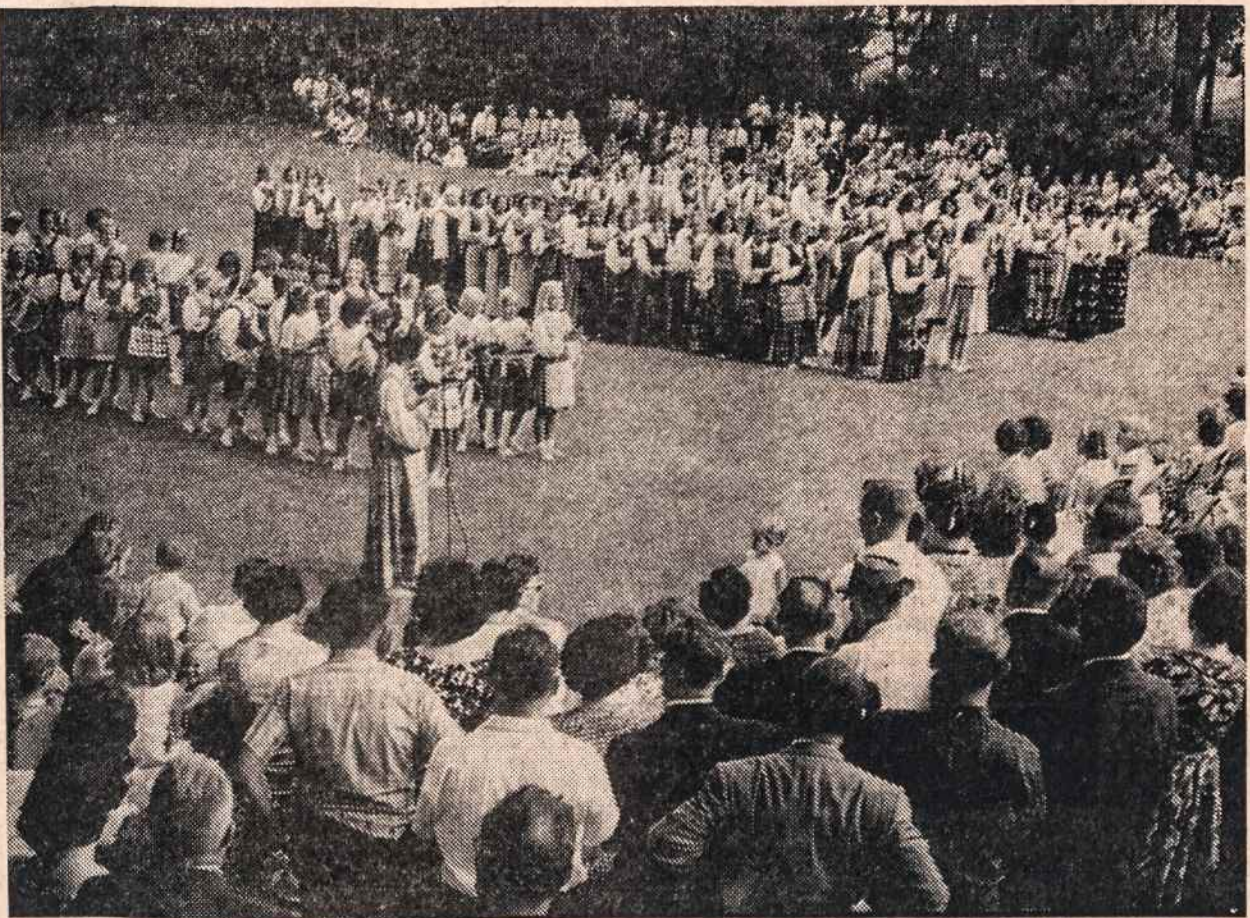
PUTNAMO SESERŲ VIENUOLYNO sodyboje stovyklaujančios mergaitės atlieka programą lietuvių susitarinimo šventėje liepos 26.