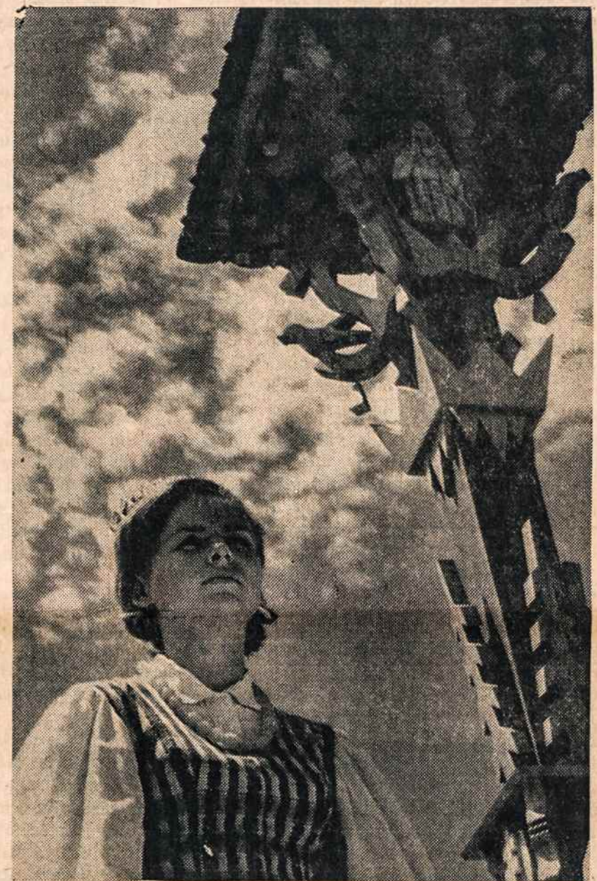
LIETUVAITE prie kryžiaus pasaulinėje parodoje New Yorke