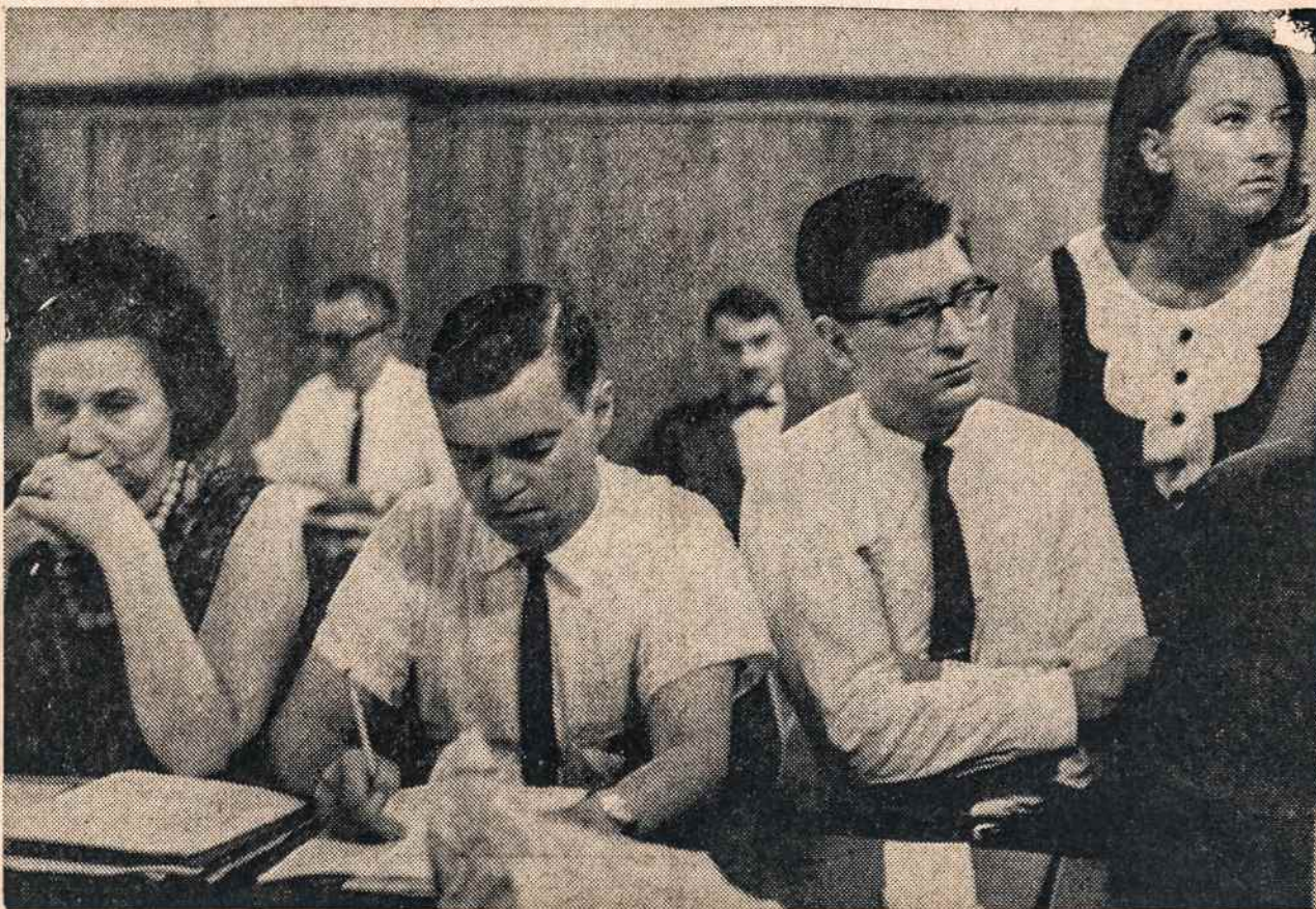
POSEDZIAUJAMA, kaip geriau praveisti lietuvių dieną pasaulinėje parodoje rugpjūčio 23.