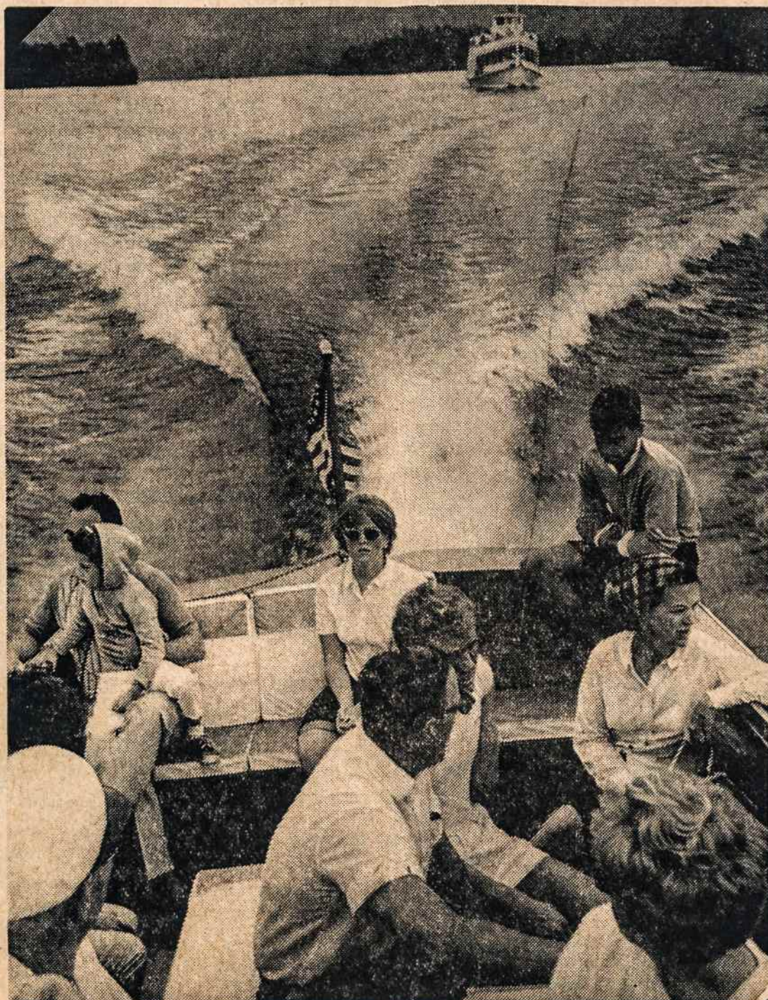
ISVYKA į Lake George.

DIAMOND POINT, N. Y. Tel. (513) NH 4-5071