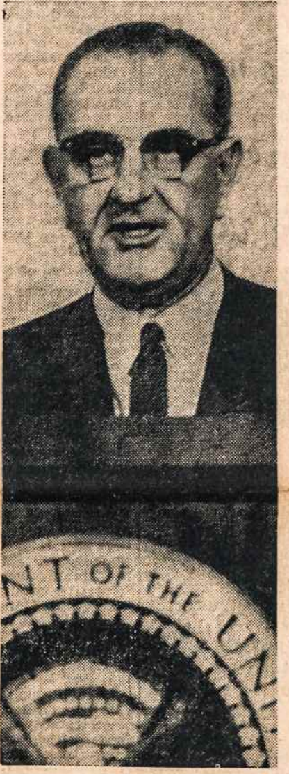
PREZIDENTAS rugpiūčio 4 j tautą. KHANH, P. Vietnamo min. pirmninkas.

Pietų Vietnamo gen. Khanh buvo įtampe su Amerikos atstovu Taylor. Khanh pasiskelbė perkelsias karą į šiaurės Vietnamą. Amerikos politika tam buvo priešinga. Khanh įtampe ir viduje — atvirai kalbama apie naują rengiamą perversmą prieš Khaną.