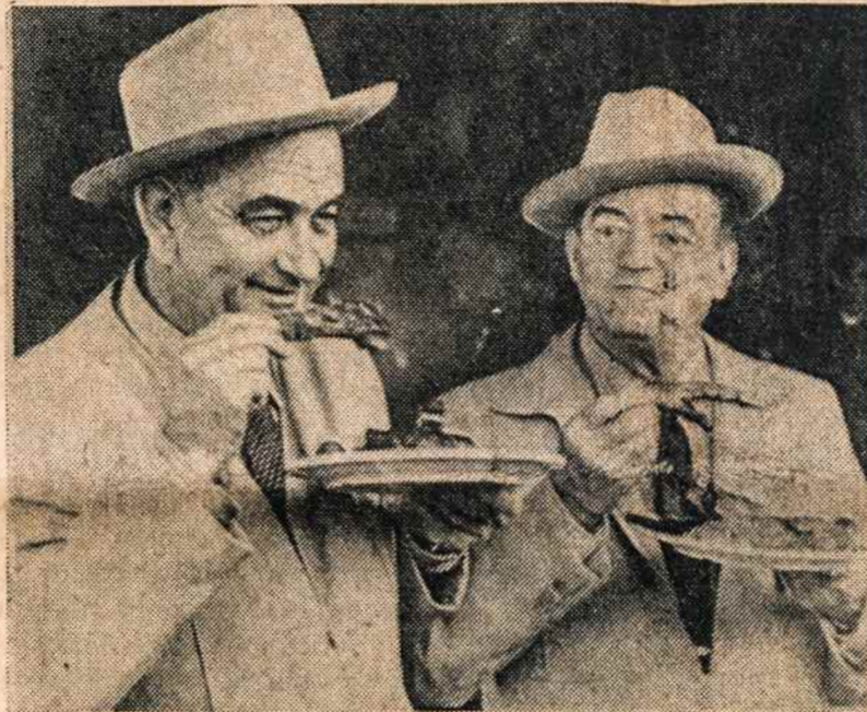
LAIMEJUSIŲ PUOTA: Johnsonas ir Humphrey