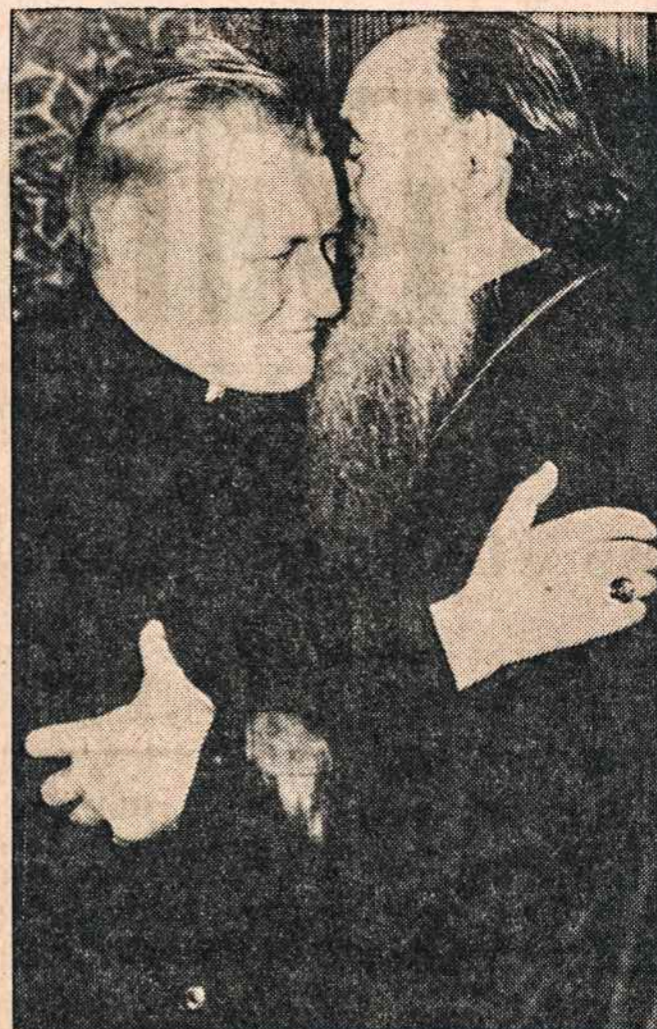
KARDINOLAS CUSHINGAS Jeruzaliėje 1947 sveikinasis su graikų ortodoksų patriarchu.