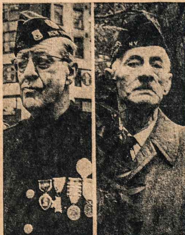
VEIDAI VETERANŲ DIENOJE, kuri buvo atšvėsta lapkričio 11. Washingtono iškilmės esti prie Nežinomo kareivio kapo, kuris supiltas prieš 43 metus. Pirmame pas. kare amerikiečių žuvo 116,516, antrame 405,399, Korejos kare 54,246, Vietnamo kare jau 223.

Amerika nutraukė Bolivijai paramą, iki išaiškės, ar karinė valdžia, nuvertusi prezidentą Victor Paz Estenssoro, bus Amerikos pripažinta. Me-