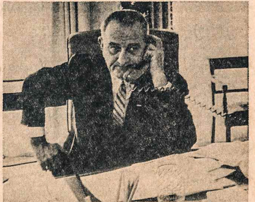
PREZIDENTAS JOHNSONAS: apsisprendimo valandą.