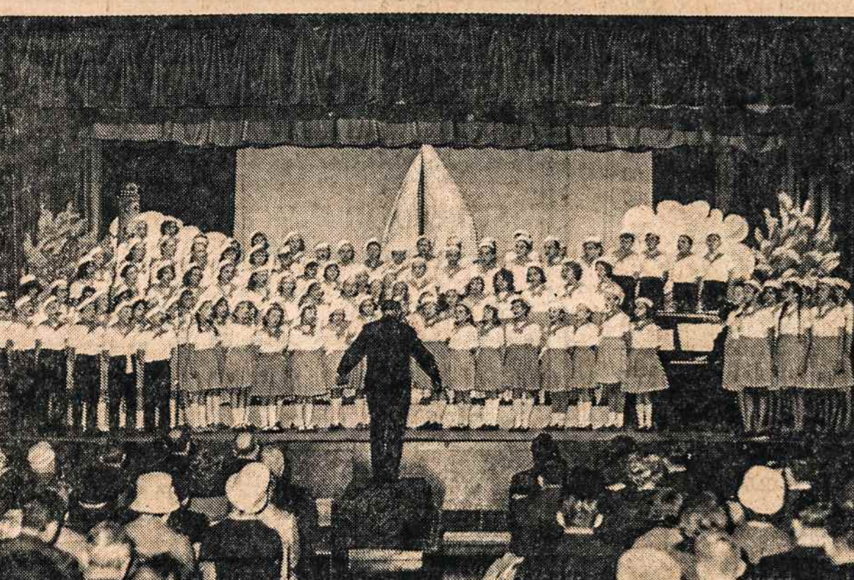
PRISIKĖLIMO PARAPIJOS VAIKŲ CHORAS TORONTO KANADOJE.