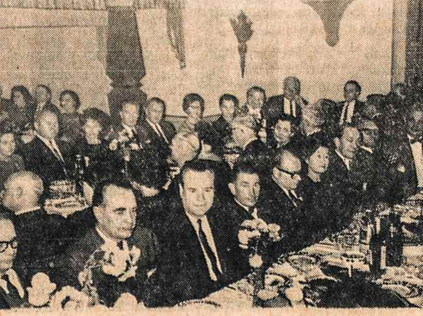
DALIS SVEIČIŲ tautinės spaudos vakare So. Bostone.

Naujosios Anglijos Lietuvių Gydymo ir Dantų Gydymo Draugijos steigiamasis susirinkimas