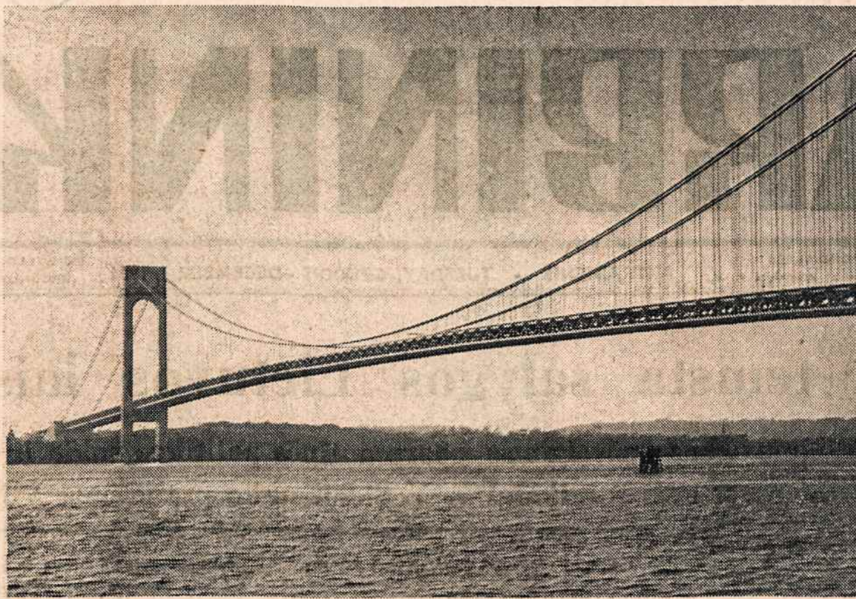
VERRAZANO-NARROWS TILTAS, jungiąs Brooklyną su Staten Island sala. Tiltas atidarytas lapkričio 21. Jo pastatymas atsiėjo 325 milijonų dol.

"Aiškėja tokiu būdu, kad ir lietuvių rengto balso nuslopinimas yra apgailėtinas".