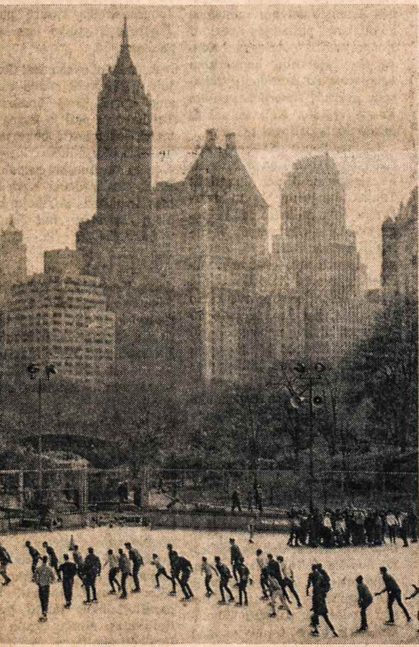
NEW YORKO CENTRINIAME parke jau veikia čiuožykla.

Pažadėtoji auka galima įteikti dalimis: per dvidešimt mėnesių, įmokant kas du mėnesiu po atitinkamą dalį.