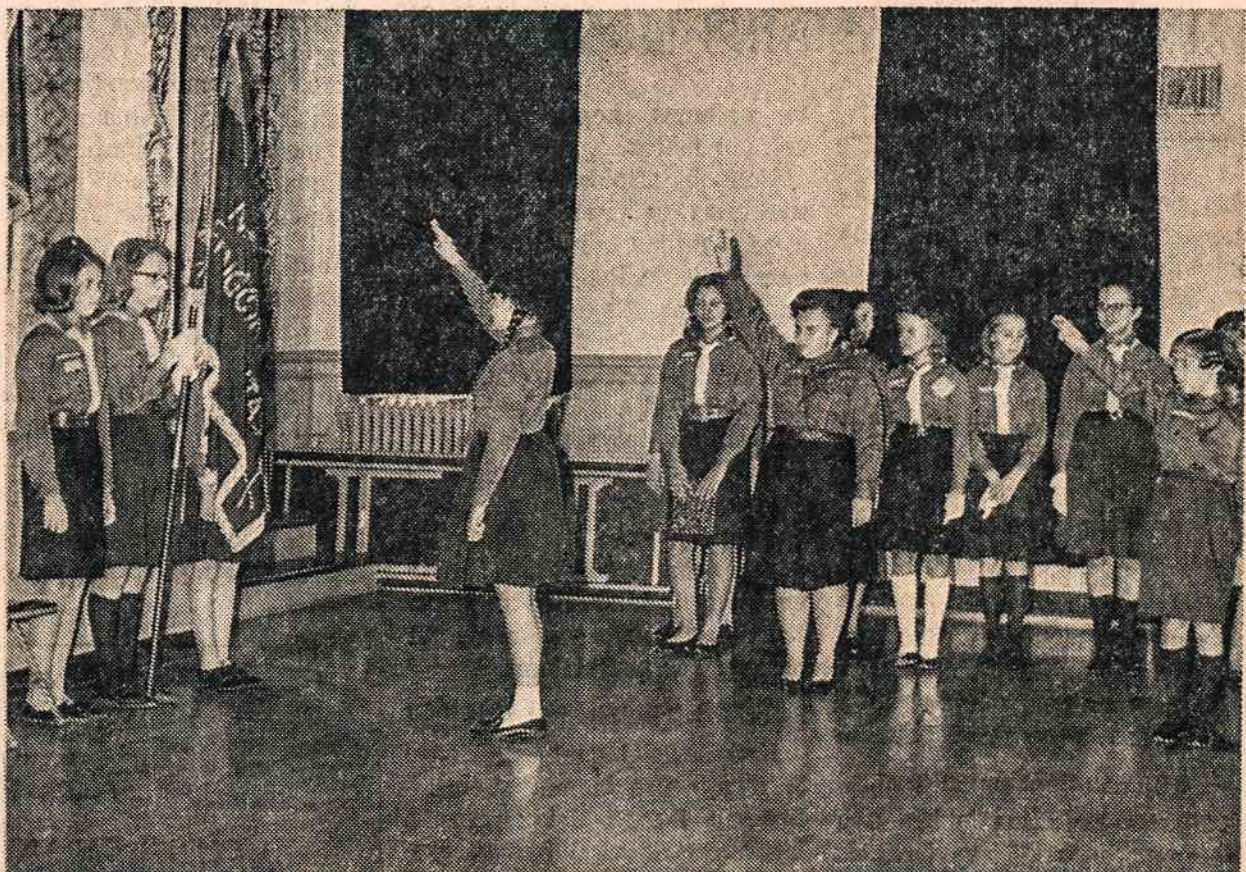
IS SKAUTŲ SVENTES New Yorke Apreiškimo parapijos salėje.

— Zinau, vaikeliai. Bet kai žmogus supykęs, tai ir klausyti (nukelta į 7 psl.)