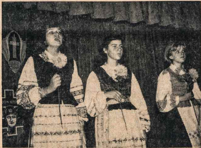
CHICAGOJE ateitininkės atlieka programą, minint žuvusius už Lietuvos laisvę.