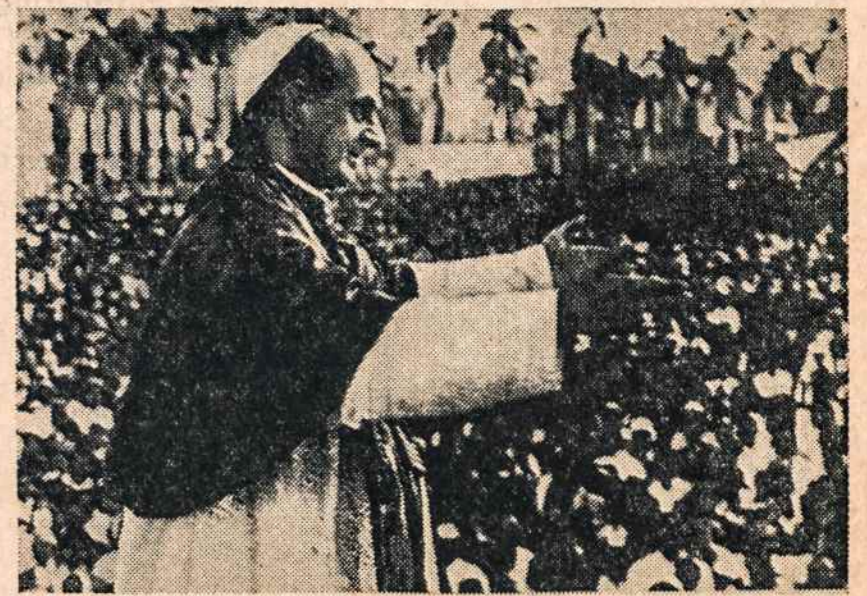
POPIEZIUS PAULIUS BOMBEJUJE.