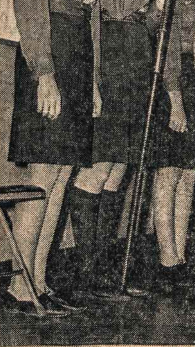
NEW YORKO skautės įžodžio metu