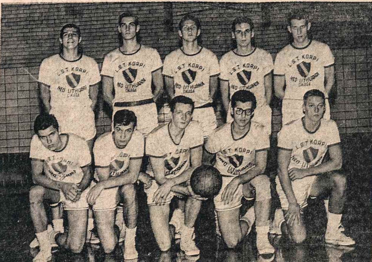
NEOLITUANŲ KOMANDA, laimėjusi Chicago's lietuvių krepšinio varžybas.