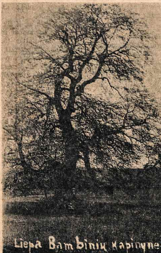
Liepa Bambiųjų Kapinyne