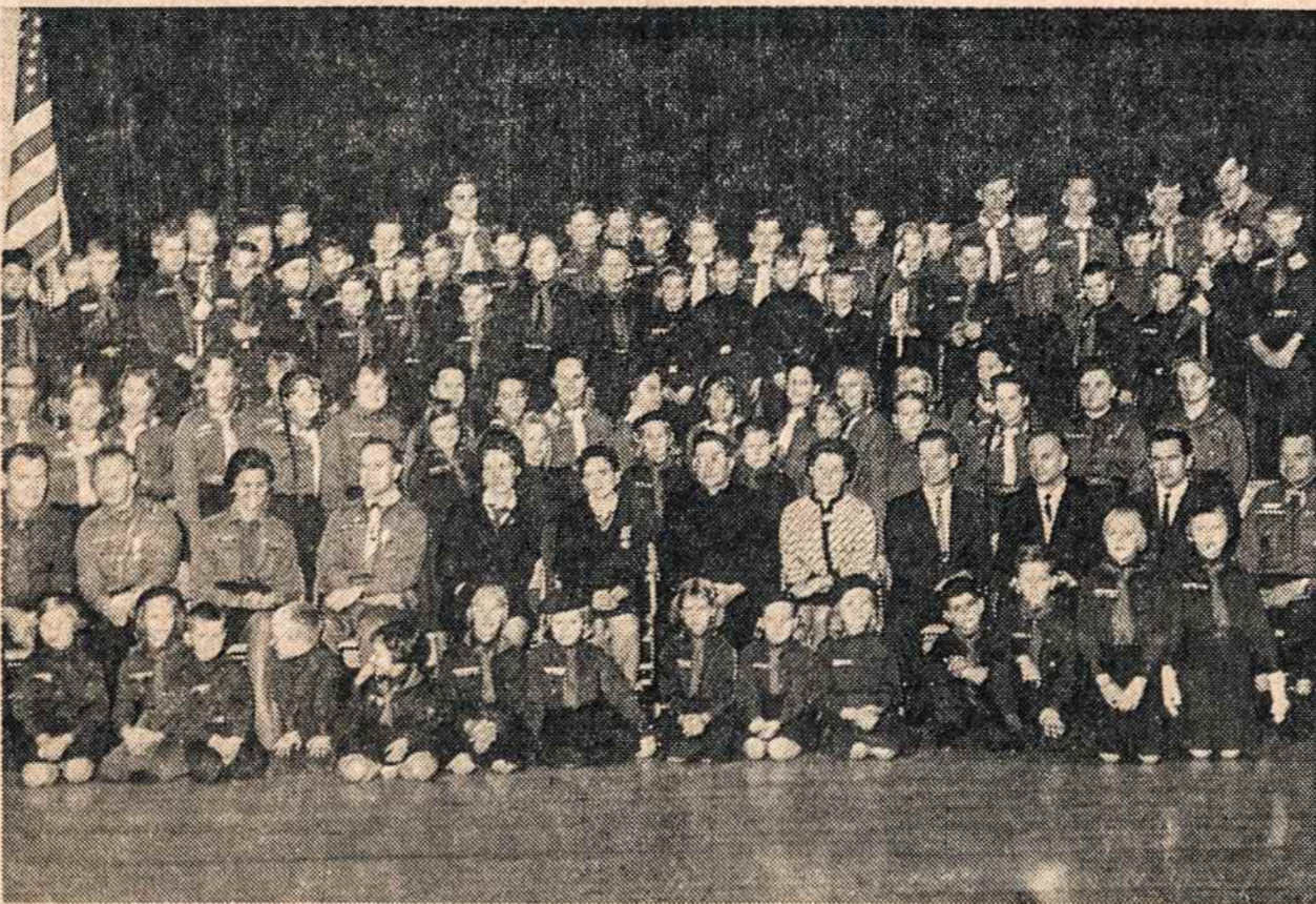
NEW YORKO skautų ir skaučių draugovės su savo vadovais ir tėvų komiteto nariais.