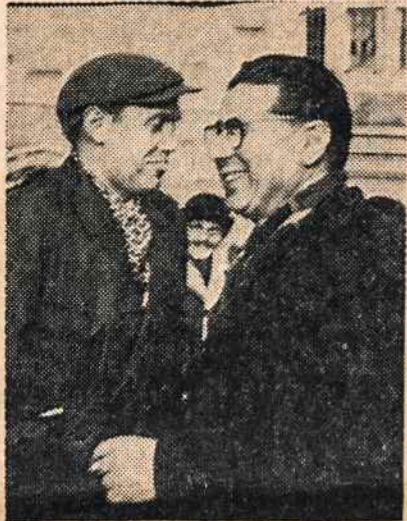
SOVIETINIAI RASYTOJAI: Roždenstvensky ir Chakovsky.

Trečias šaltinis — taip pat iš Washingtono, bet jo vardo korespondentas nepasako. Tas šaltinis pažymėjo, kad "Mieželaitis buvo Lietuvos rašytojų sąjungos pirmininkas ir galėtų