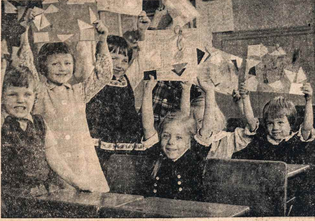
JAUNIAUSIOS mokinės, parengiamosios klasės, Maironio šeštadieninėje mokykloje.