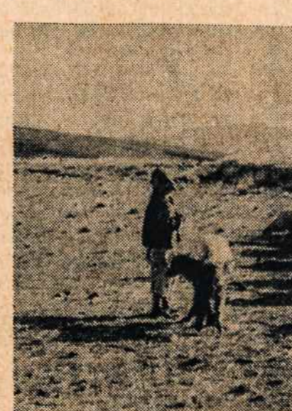
TAIP, KAIP KRISTAUS LAIKAIS. Tai mūsų laikų Bolivijos piemenėlių vaizdas.