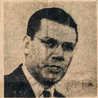
EUROPOS RAMINTOJAI: Dean Rusk ir Robert S. McNamara