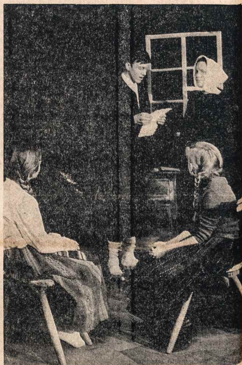
Vasario 16 gimnazijoje specialiu valdinimu paminėta Lietuvos nepriklausomybės šventė.