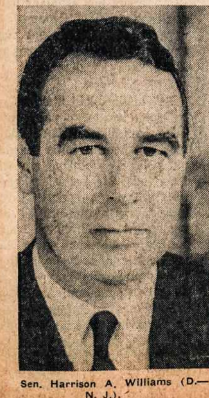
Sen. Harrison A. Williams (D.-N.J.).