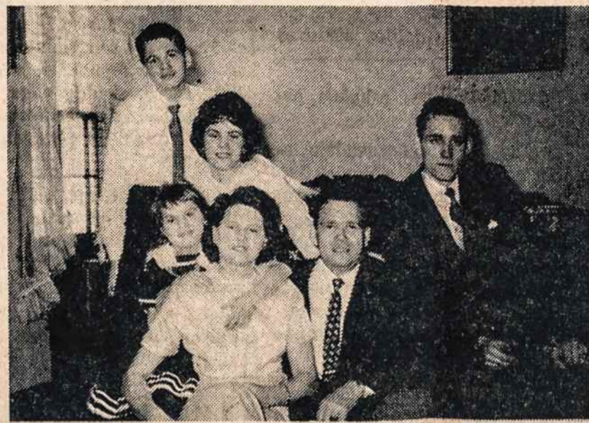
Mažeikų šeima 1957 metais.