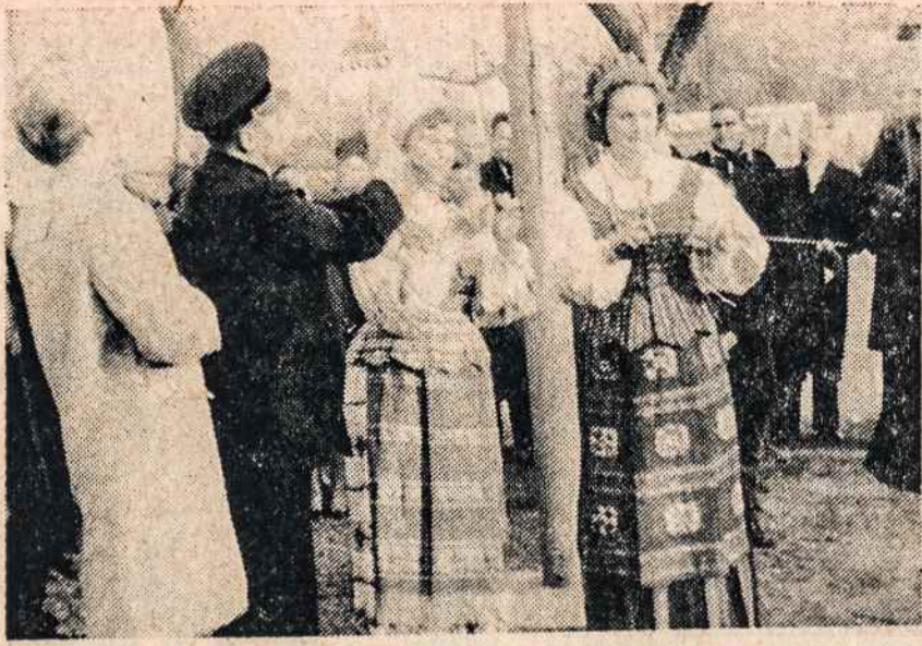
Lietuvos vėliava pirmą sykį iškelta pasaulio plieno pramonės sostinėje East Chicago, Ind.

Ateistų mokomi, kaip spauda eausiai rašo, teologai emė domėtis šios planetos Veneromis Romon siūsdami reikalavimus panaikinti celibatą.