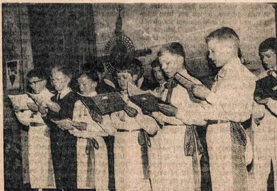
Italijoje salezių gimnazijoje mokiniai dainuoja "Lietuva brangi, mano tėvynė" Lietuvos nepriklausomybės minėjime.