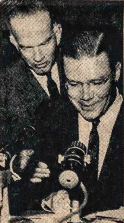
Fulbrightas ir McNamara — dvejopų valdžių, dvejopų idėjų atstovai.

Kom. Kinijoje politinis švietimas prasideda nuo 7 metų amžiaus — į pionierius priimami nuo 7 metų, anksčiau buvo 9 m.