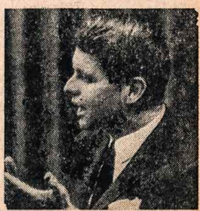
Senatorius R. Kennedy, su kuriuo nori eiti ADA.

Viceprez. H. H. Humphrey, vienas iš šio demokratų liberalų-ekstremistų sąjūdžio steigėjų ir vicepirmininkas, iki nueidamas į viceprezidentus, konferencijoje dalyvavo ir kalbėjo balandžio 23. Stengėsi rodytis ne tik praeity buvęs tarp sąjūdžio priešakinių asmenų, bet ir dabar einas su juo. Tačiau pagal N.Y. Times informaciją H. H. H. jautė, kad sąjūdžio palankumas svyra ne į H.H.H., bet į sen. Robert Kennedy, kaip į būsimą kandidatą 1972 rinkimam. H.H.H. gryn prezidento LBJ politiką, o sąjūdžio dauguma rezoliucijos forma pasisakė už tai, ką labiau buvo skelbęs R. Ken-