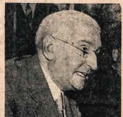
Portugalijos min. pirm. Salazaras 77 metų.

tačiau politiniais sumetimais neskelbiama. Tik valstybės departamento spaudos šefas pakartojo valstybės sekretoriaus ankstesnę pareiškimą, kad neliečiamų vietų užpuolikai laikai pasibaigė. Tai reiškia, jei užpuolikas spruks į Kiniją, Amerikos lėktuvas nesivaržys jį tenai persekioti.