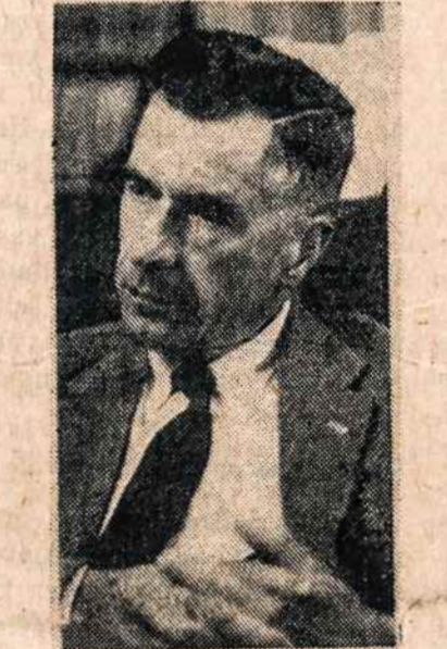
Galbraith, Harvardo profesorius, kritikas užsienių politikai.