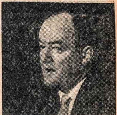
Viceprezidentas Humphrey, kuris nori eiti su ADA.

LBJ politika susilaukia daugiausia priešų iš jo paties partijos draugų