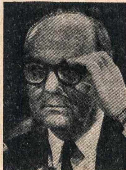
Amerikos sekretorius D. Rusk planuose į rytų Europą.

naudos bus Amerikai, t.y. kiek tiltais riedės pačios komunistų valdomos tautos į Vakarus, lie-