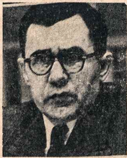
Sovietų min. A. Gromyko planuose į vakarų Europą.

Prez. Johnsonas gegužės 3 paskelbė, kad kreipėsis į Kongresą pritarimo prekybai tarp Amerikos ir rytų Europos komunistinių režimų išplėsti. Prezidentas nori įstatymo, kuris duotų jam laisvas rankas pripažinti sava nuožūra palankumo principą tiem ar kitiem kraštams. Tas palankumas praktiškai reiškia sumažinimą muitų tų kraštų prekėm, importuojamom į Ameriką. Didžiausio palankumo principas lig šiol buvo taikomas Jugoslavijai ir Lenkijai. Tokio palankumo dabar nori Vengrijai, Rumunijai ir kt. Prezidentas tikisi, kad šitokia prekyba reikš tiltus tarp Amerikos ir rytų Europos; per ją suartės komunistų valdomi rytų Europos kraštai su Vakarais.