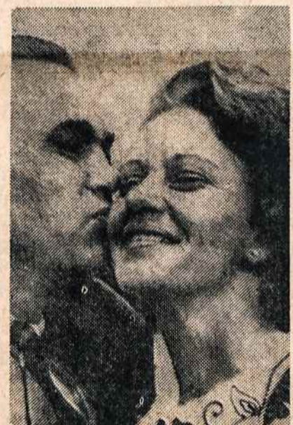
Gubernatoriai — esamasis ir būsimasis: Mr. ir Mrs. Wallace.

Daugiausia dėmesio patraukė, kad demokratų kandidatu į gubernatorių buvo išrinkta Mrs. George C. Wallace, žmona ligšiolinio gubernatoriaus, kuris yra pagarsėjęs kaip segregacionistas, kaip Alabamos interesų gynėjas nuo federalinės valdžios. Mrs. Wallace gavo didesnę balsų persvarą nei pereinuosie rinkimuose jos vyras. Jei lapkričio rinkimuose rezultatai bus tie patys, tai Mrs. Wallace bus pirmoji moteris — Alabamos gubernatorių. Amerikos istorijoje tai bus trečioji moteris gubernatoriaus pareigoje. 1924 buvo išrinktas Mrs. M.A. Ferguson — Texas ir Mrs. N.T. Ross — Wyoming gubernatoriais.