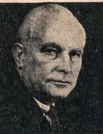
Sen. Thomas J. Dodd