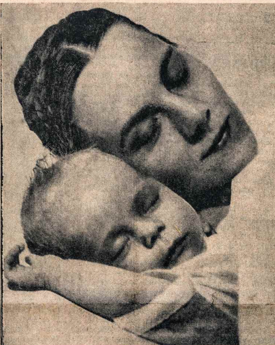
O mylima motina, laime, širdin atsigrėžus, kaip žvaigždės vis spindi, taip tu amžinai ta pati! Tik tavo palaime gyvenimo vieskeliai gražūs, Tik tavo mums meilė, kaip jūra, gili ir plati!