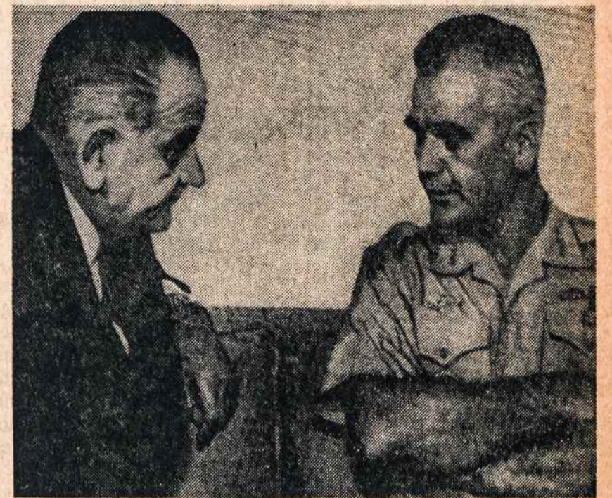
Vietnamo rūpestyje: prezidentas L. B. Johnsonas ir kariuomenės vadas Vietnamo gen. W. C. Westmorelandas.

LI NR. 33. SECOND-CLASS. PENKTADIENIS - FRIDAY, GEGUZIS - MAY 6, 1966. 910 WILLOUGHBY AVE. BROOKLYN, N. Y. 11221 10 CENTU