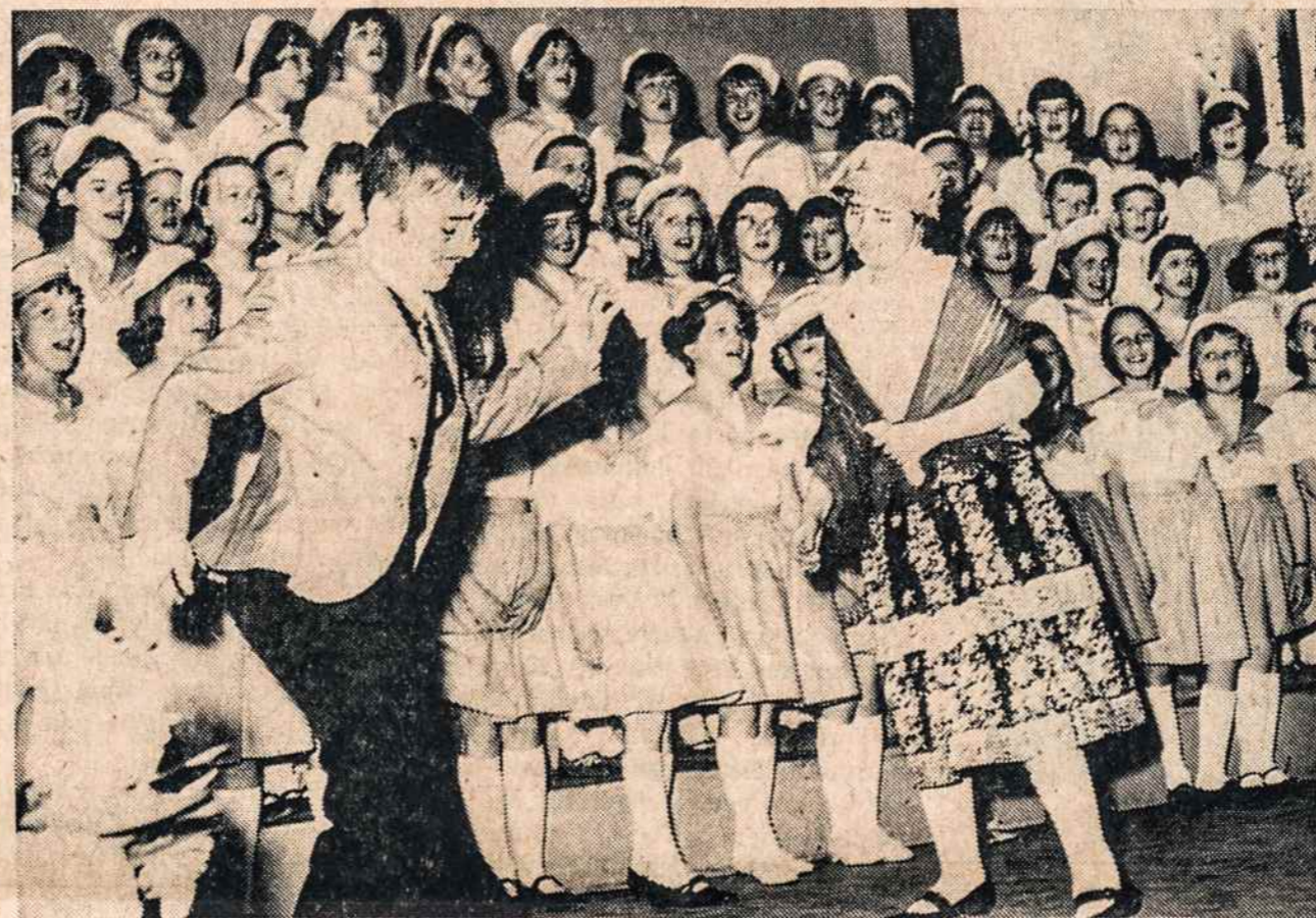
Pilypėlio daina, pavaizduota Prisikėlimo parapijos jaunimo choro jungtiniame koncerte balandžio 17. Nuotr. M. Pranevičius