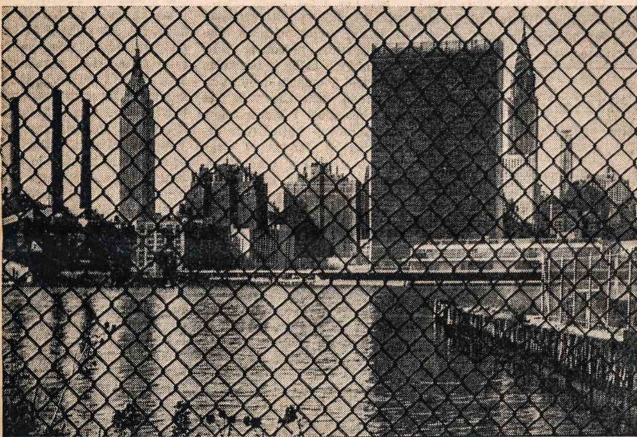
Jungtinės Tautos New Yorke.

Tuo būdu rusiška kolonistiška pramonės įmonė, sudariusi progą atsikraustyti Lietuvos stambiam būriui rusų specialistų ir nespecialistų, net pensininkų pagalba ir visai nebe pramonės srity darbuojasi, — stengdamasi įbrėžti daugiau rusiškų bruožų Lietuvos sostinės veide. (Elta)