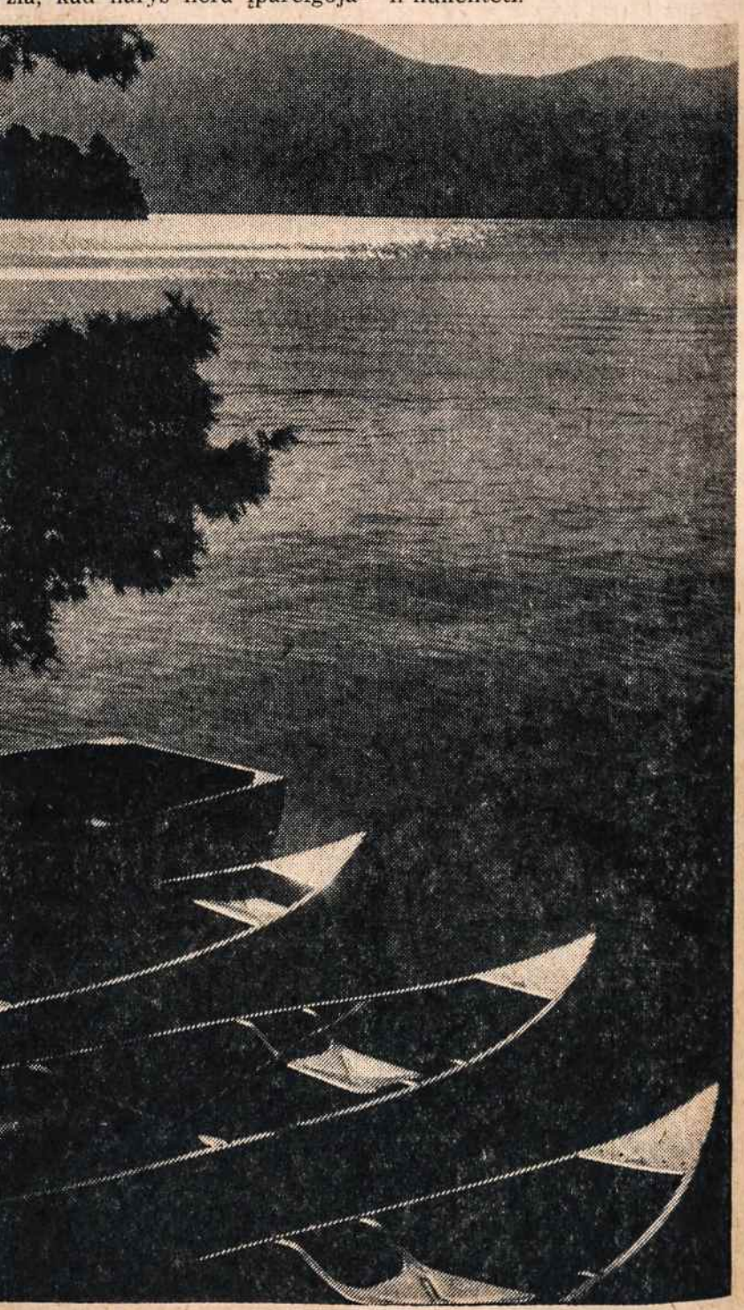
Rytinė tyla Blue Water Manor vasarvietėje prie George ežero. Rezervacijai ir informacijai reikalaujate kreiptis: Blue Water Manor, Diamond Point, N. Y., tel. 518 NH 4-5071.

Atsakymas Man teko matyti tuos taip vadinamus "pasūlymus", kuriuos "Book Guild" bendrovės siunčia žmonėms. Paprastai jie siūlo vieną arba keletą knygų vel tui su sąlyga, kad knygas gavęs asmuo pasidarytų tos "Guild" nariu. Tiesa, jie duoda nariui teisę išstoti iš Guild bet kurio metu. Taipogi jie pabrėžia, kad narys nėra įpareigojamas pirkti kokią nors arba tam tikrą skaičių knygų. Norėčiau Tamstos paklausti ar tai "Book Guild" gali mane priversti mokėti už knygą, kurios nesu nei gavęs, nei užsąkęs ir ar tai bendrovė gali, jei aš ilgai dėlščiau visa reikala, pakenkti mano taip vadinamam "Good credit"? Ką aš tokiu atveju turėčiau daryti?