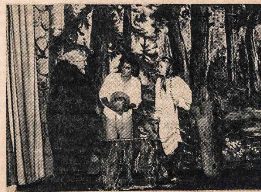
Scena iš Petro Babicko muzikinio veikalų „Gintaro žemės pasaka“.