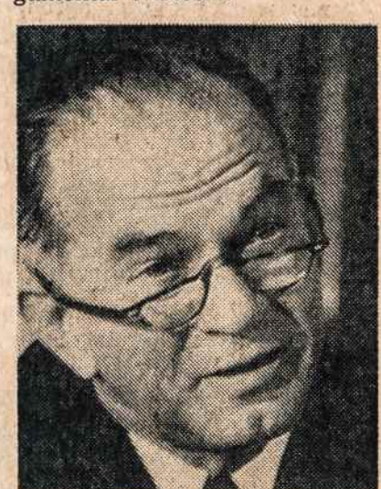
Fulbright — "Balandis"

Nato ministerių konferencija birželio 7-8 vengė griežtesnių sprendimų dėl santykių su Prancūzija, kuri pasitraukė iš Nato karinės vadovybės. Buvo natūralu, jei karinės vadovybės būstinė iš Paryžiaus perkelta į Belgiją. Bet Amerikos siūlymas perkelti iš Paryžiaus ir politinę vadovybę atidėtas keliem mėnesiam. Laukiama, ką duos de Gaulle vizitas Maskvoje. Atidėdėtas ir Danijos siūlymas šaukti bendrą rytų-vakarų konferenciją Europos saugumo reikalui. Tokiai konferencijai nepritarė Amerika, tepasisakydama už klausimo studijavimą tarp pačių Nato narių. Pažymėtina, nepritarė ir Prancūzijos ministeris, kuris antrą konferencijos dieną dalyvavo posėdžiuose politiniam reikalui. Jis pasisakė už kiekvienos valstybės individualius santykius su kom. kraštais — tegul kiekvienas pats "tiltus" stotasi. Parėmė jį ir Vokietijos ministeris.