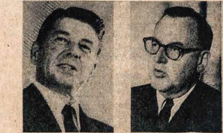
Reganas ir Brownas — respublikonų ir demokratų kandidatai į Kalifornijos gubernatorius.

— Atstovų Rūmai birželio 7 priėmė įstatymą, kuriuo neturtingi nusikaltėliai tam tikrom sąlygom atleidžiami nuo užstato iki teismo. Įstatymas dar grįš į senatą.