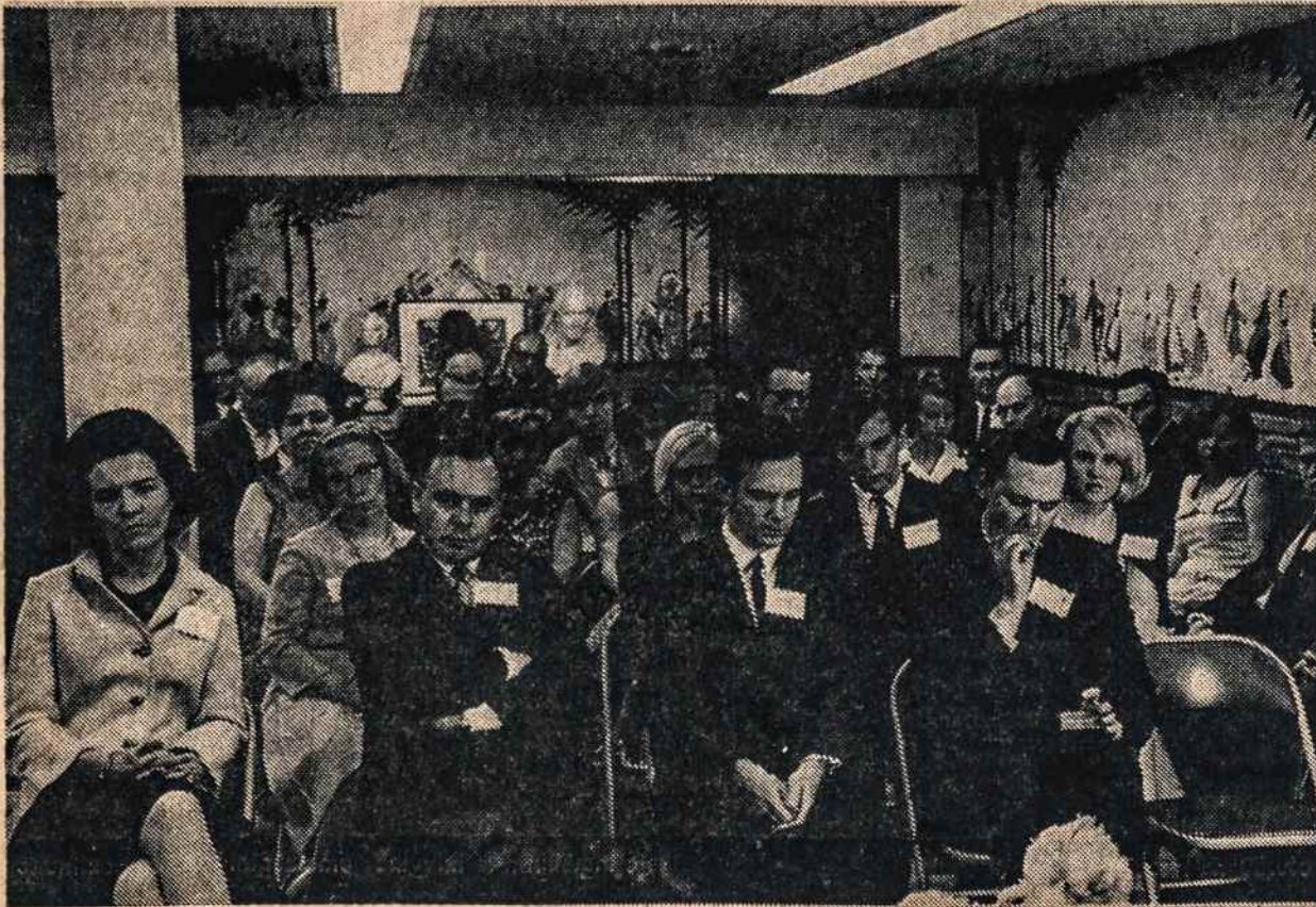
Jaunimo metų simpoziumo dalyviai Philadelphiaje.