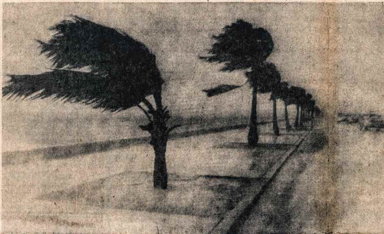
Alma hurikanas lanksto palmes Floridoje

Amerikos paramos piktnaudžijimo stipriausia priežastis komisijos narių tvirtinimu, yra visiška kontrolės stoka. Komisijos informacija kelia nepasitenkinimą Kongrese.