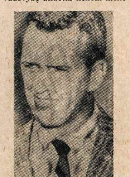
J. A. Walker žuvo iškutu bandyme.

Nato ministerių konferencija birželio 7-8 vengė griežtesnių sprendimų dėl santykių su Prancūzija, kuri pasitraukė iš Nato karinės vadovybės. Buvo natūralu, jei karinės vadovybės būstinė iš Paryžiaus perkelta į Belgiją. Bet Amerikos siūlymas perkelti iš Paryžiaus ir politinę vadovybę atidėtas keliem mėnesiam. Laukiama, ką duos de Gaulle vizitas Maskvoje. Atidėdėtas ir Danijos siūlymas šaukti bendrą rytų-vakarų konferenciją Europos saugumo reikalui. Tokiai konferencijai nepritarė Amerika, tepasisakydama už klausimo studijavimą tarp pačių Nato narių. Pažymėtina, nepritarė ir Prancūzijos ministeris, kuris antrą konferencijos dieną dalyvavo posėdžiuose politiniam reikalui. Jis pasisakė už kiekvienos valstybės individualius santykius su kom. kraštais — tegul kiekvienas pats "tiltus" stotasi. Parėmė jį ir Vokietijos ministeris.