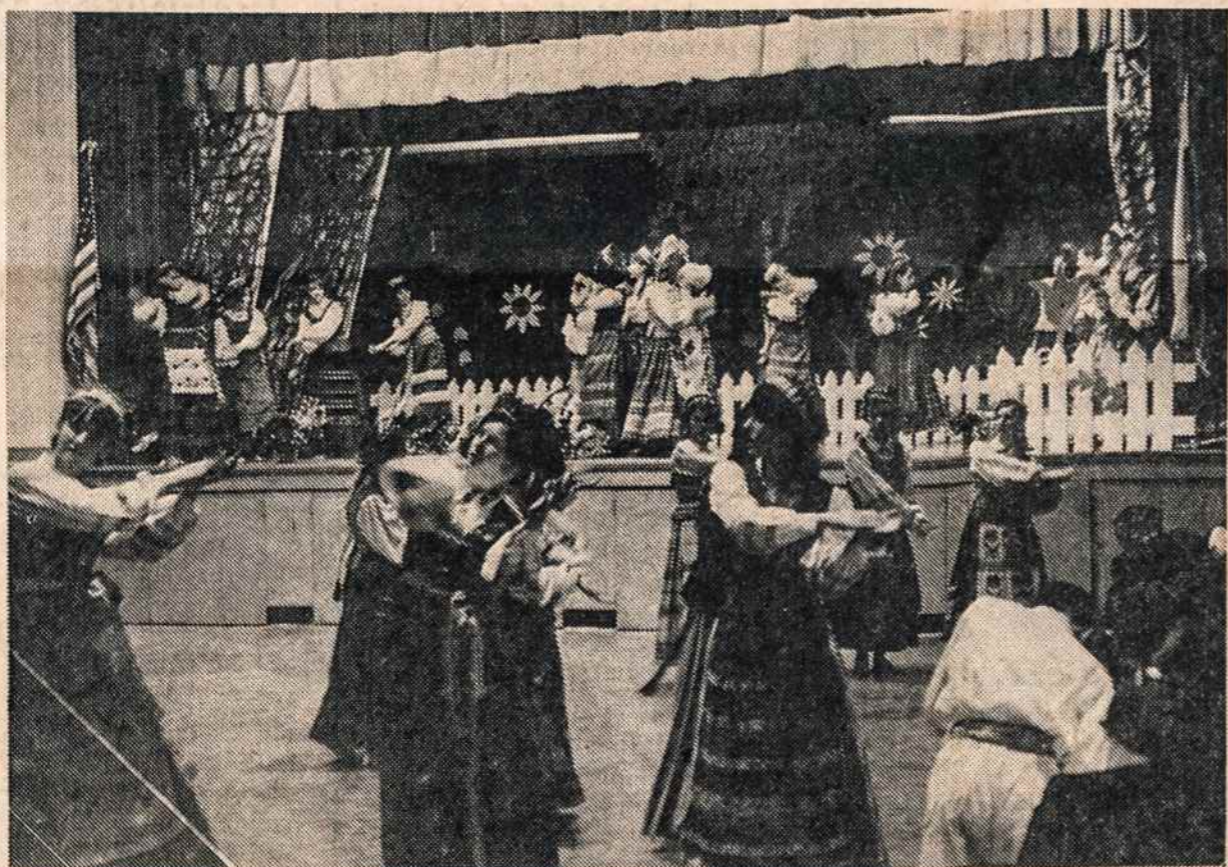
Maironio šeštadieninės mokyklos mokiniai ir New Yorko tautinių šokių grupė išpildo programą Maironio mokyklos mokslo metų užbaigime.