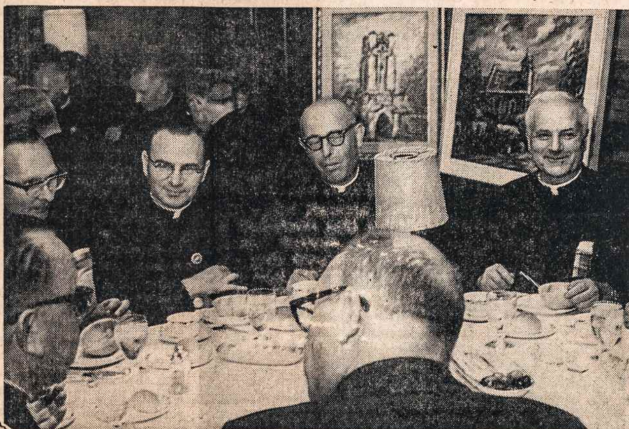
Kunigų pietūs Statler Hilton viešbutyje rugsėjo 3 Washington