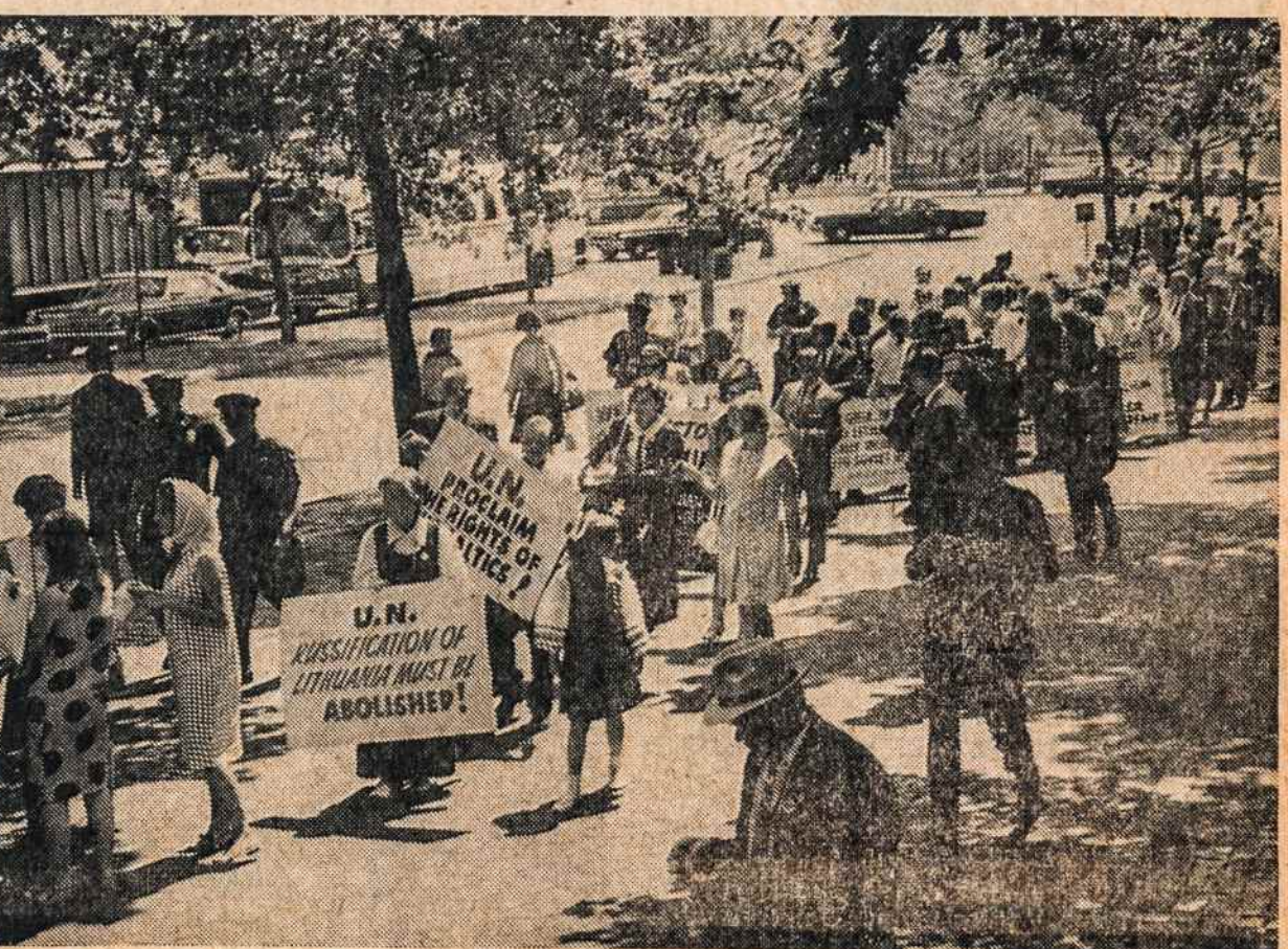
Demonstracijos prie Jungtinių Tautų liepos mėn.

Pašto tarnautojas, paėmęs siuntinėlių, pakratė, ir mano pi-