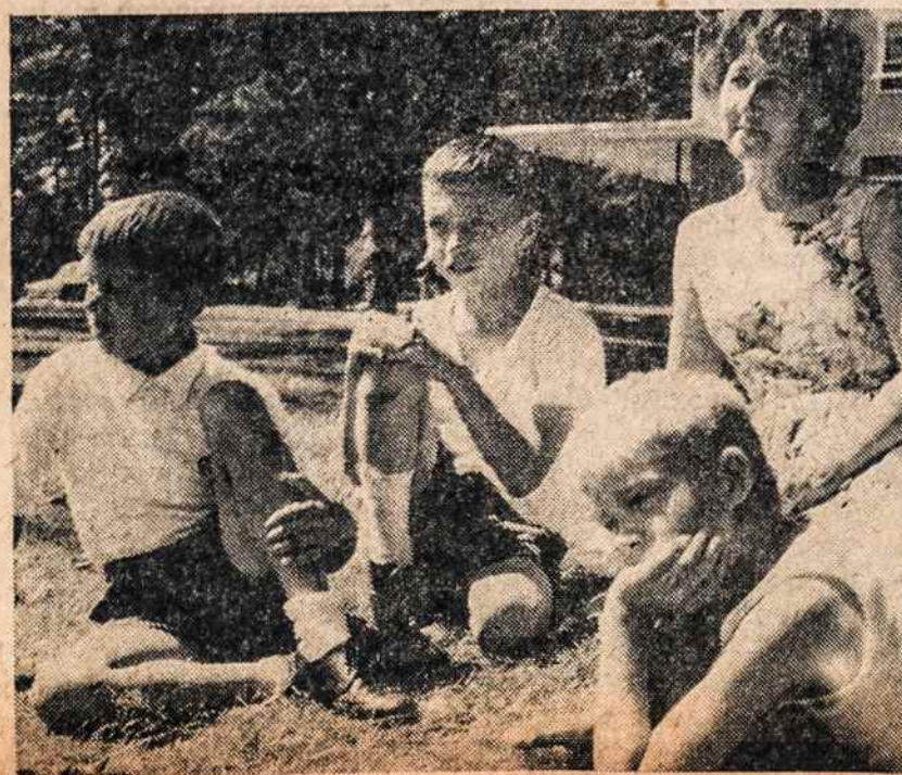
Berniuku vasaros stovykloje Kennebunkoorte.