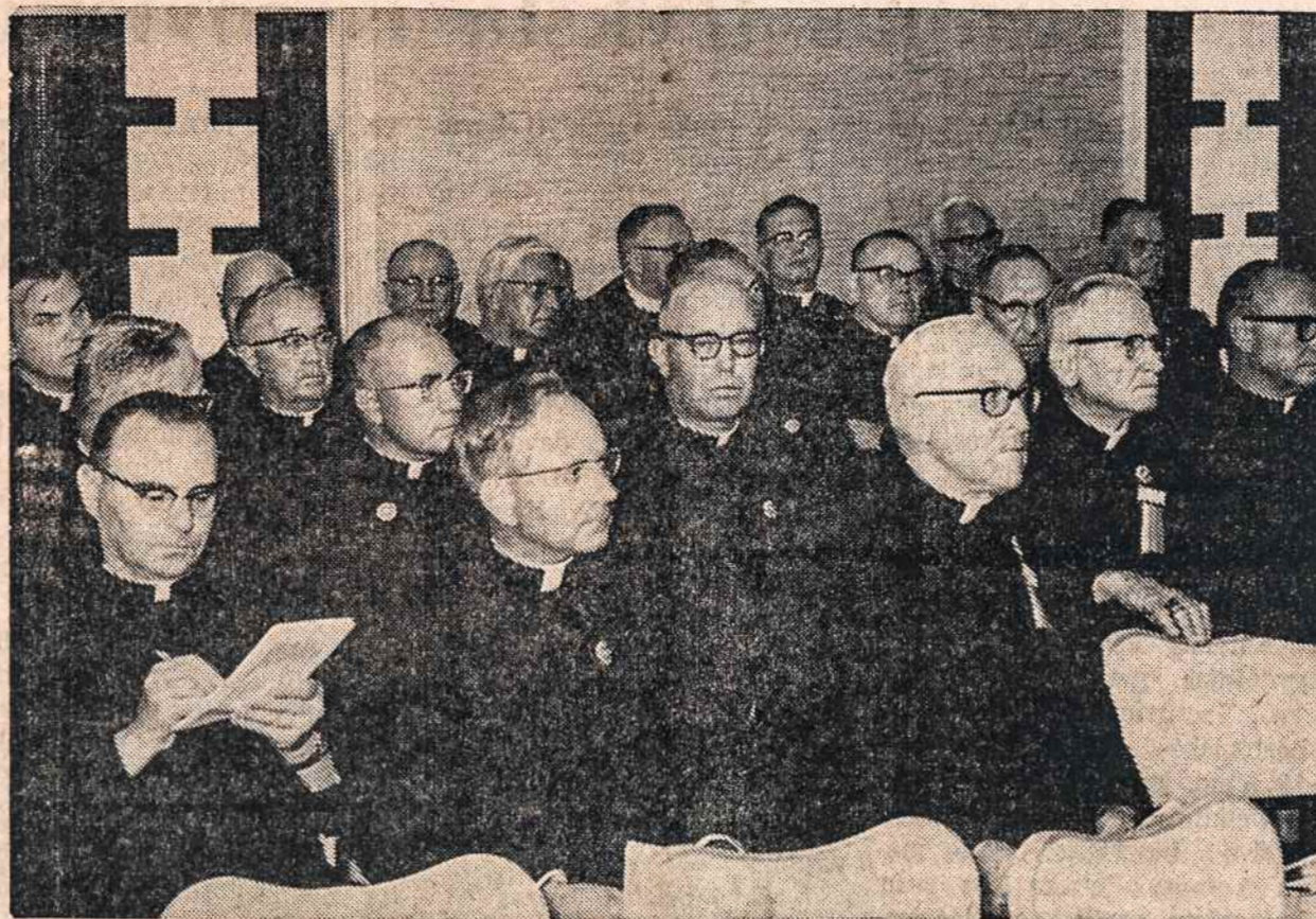
Kunigų Vienybės susirinkime rugsėjo 3 Statler Hilton viešbutyje Washington.

Franciscan Monastery, Kennebunkport, Me.