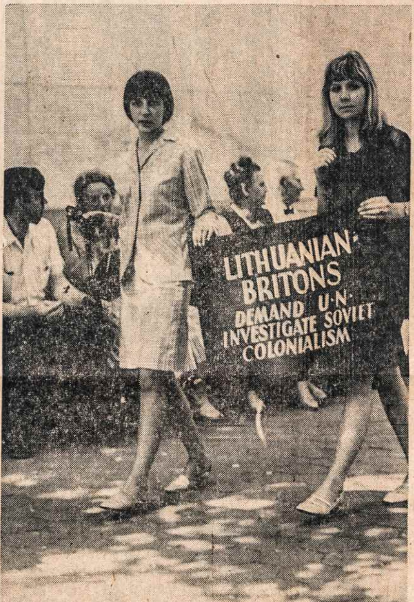
Britanijos lietuvių jaunimas demonstruoja prie Jungt. Tautų New Yorko liepos mėn.