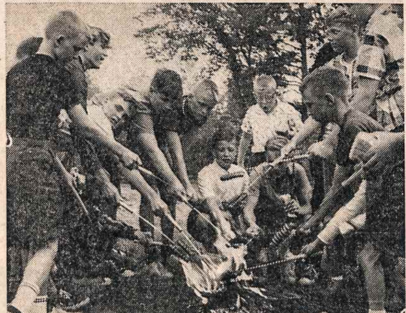
Berniukų stovykloje šią vasarą Kennebunkporte kepanos dešrelės.