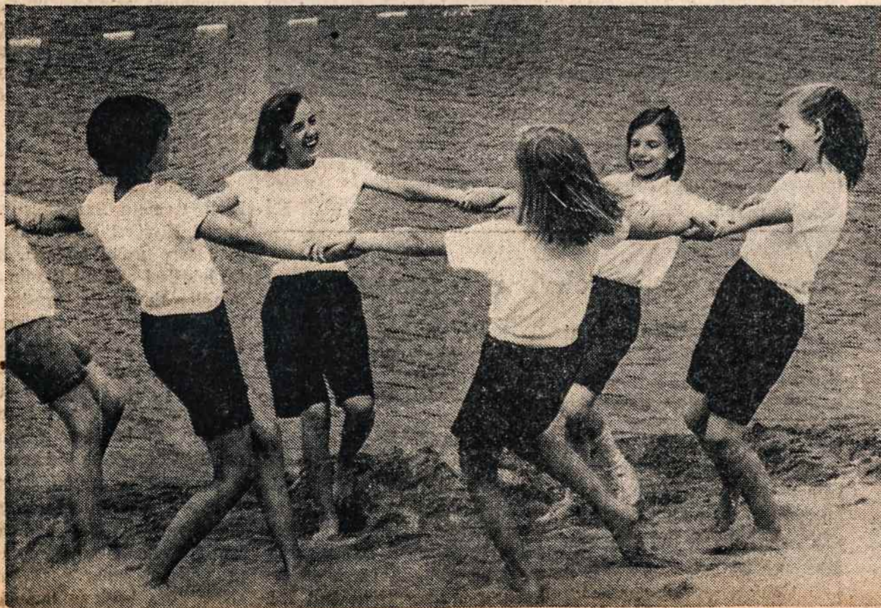
Mergaičių vasaros stovykloje Putname

Jaunimo veiklos konferencijai šaukti komiteto vardu norima pareikšti, kad nėra blogos valios iš mūsų pusės, nesikėsianam pakenkti L.B. jaunimo statutui paruošti komitetui. Tikimės, kad ir pastarieji paaškins savo nustatymus ir motyvus, kodėl jie veikia atskirai. Tikimės, kad tokie pasisakymai išsklaidys negrįstus gaudus New Yorke.