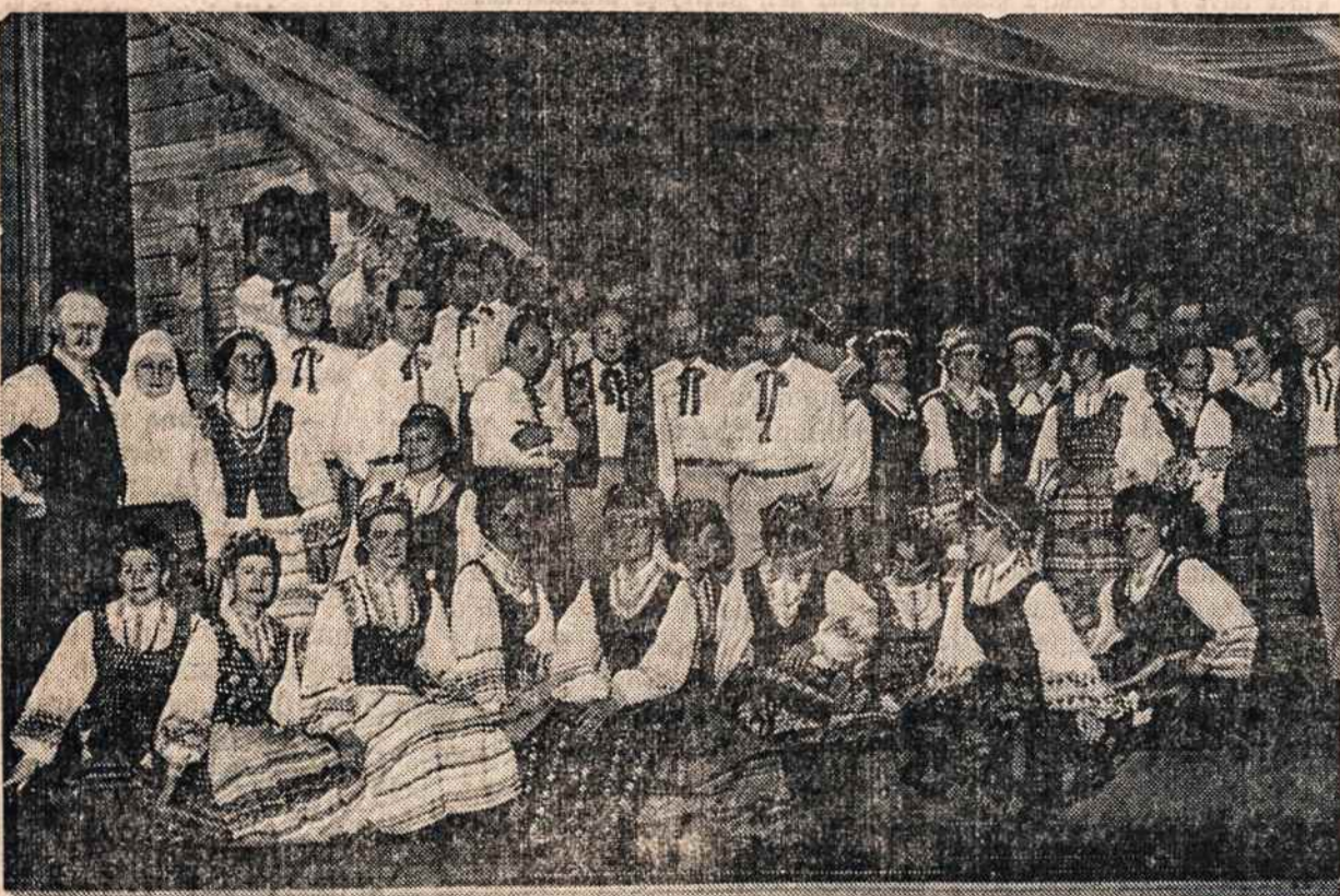
Dainavos ansamblis po "Nemunas žydi" spektaklio.