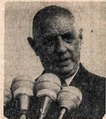
Sutaria: bendras Paryžiaus ir Maskvos interesas laikyti Vokietiją silpną.

laiko grindžiamą tokiu de Gaulle apskaitymu: jei Sovietai pulyti Europą, tai Amerika ją vis tiek gins; gins ir Prancūzija, ar ji to prašys ar ne; jei Sovietai nepuls, tai Prancūzija nesuinteresuota Amerikos karine nei ūkine įtaka Europoje. Panašiai kaip tėvų ir vaikų santykiuose: vaikai maištauja prieš tėvus narsiai, žinodami, kad jei vaikus kas užpultų, tai tėvai juos vistiek gelbės.