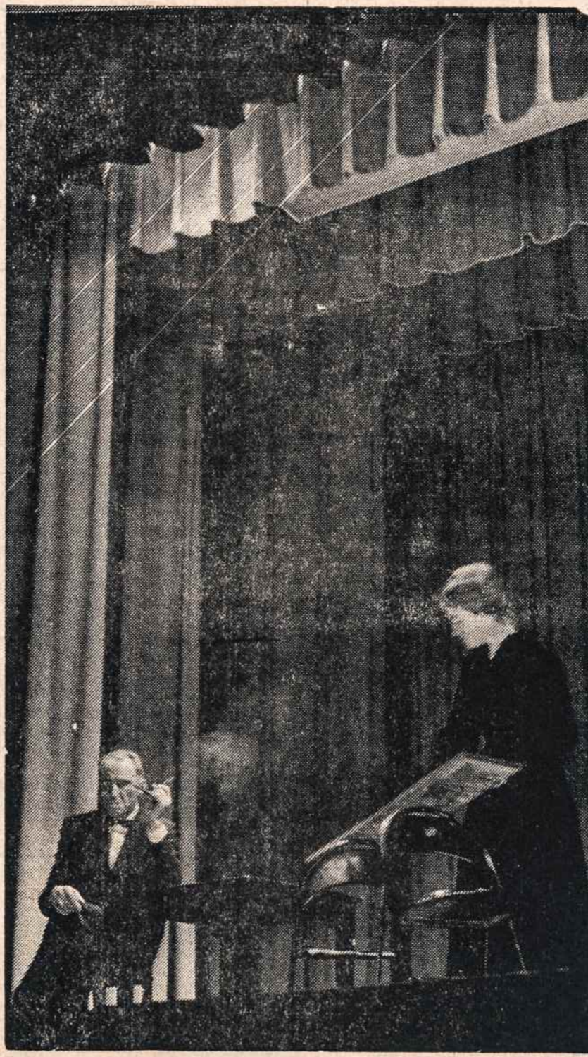
Scena iš "Mūsų miestelio", kurį suvaidino Bostono Modernusis Teatras spalio 9 šv. Tomo salėje Woodhavene.

JAV Liet. Bendruomenės New Yorko apygarda