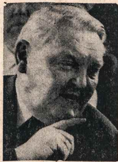
Nesutaria: kancleris Erhardas ir Brandtas dėl santykių su Sovietais ir rytų Vokietija.

Erhardo vyriausybė laikosi tradicinės politikos, kur labiausiai atremta į bendradarbiavimą su Amerika ir prisiderinama prie jos linijos. Erhardo vyriausybė nepritarė socialdemokratų tiesioginiam deryboms su rytų Vokietija. Tačiau pastebima, kad Amerikos, Anglijos ir Prancūzijos vyriausybės sluoksniai pritaria Brandto mėginimam. Tai esą derinasi su jų politine linija.