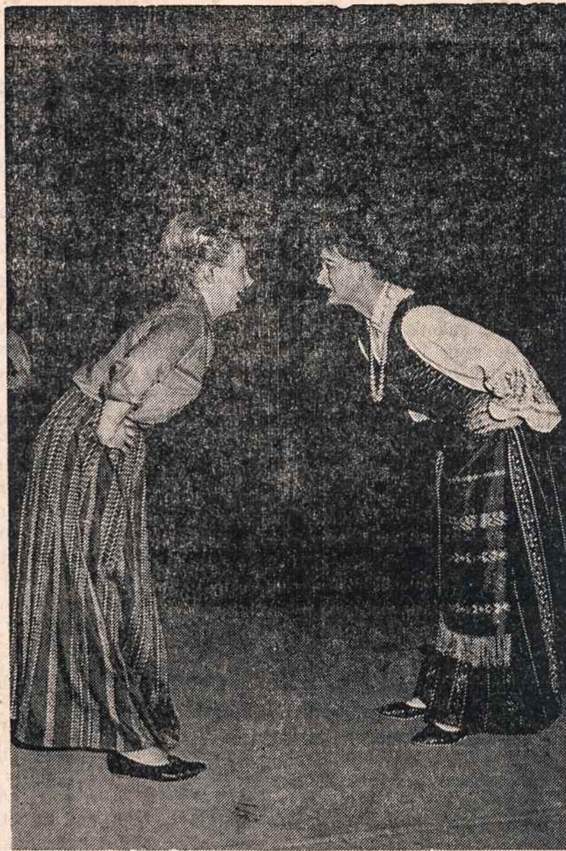
Scena iš "Nemunas žydi" spektaklio, kurį New Yorke matysime lapkričio 5. Nuotr. V. Račkausko