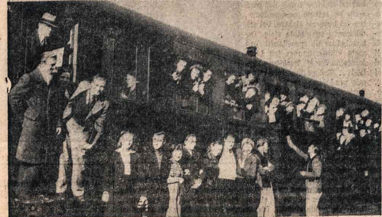
Dainavos ansamblis Vokietijoje 1946 lapkričio 3 išvyksta gastrolėm. Šiemet Dainavos ansamblis mini 20 metų sukaktį.