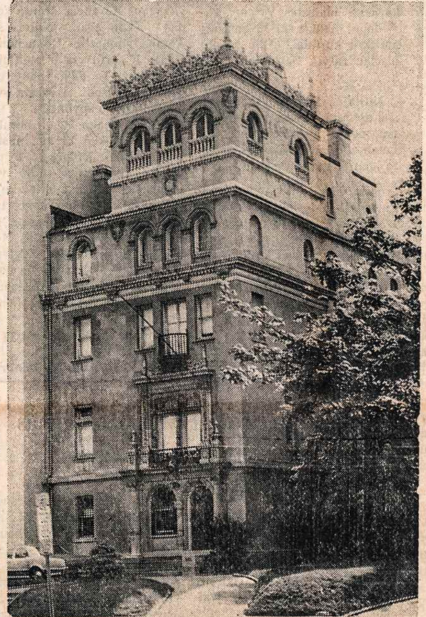
Lietuvos pasiuntinybė Washingtono

kas aiškinasi: — Partijos istoriją studijuo-ju jau septintą kartą. Nenauji ir kiti dėstomi dalykai. Kaip pa-tekau į tą mokyklą? Ogi sako: "Trūksta klausytojų, atėik". A-tėjau dėl skaičiaus... Kitas — dešimt metų veikia kaip propagandistas. Bet ir tas "dėl skaičiaus" sėdi pamokose, kur kartojama tas pats ir tas pats... (Elta)