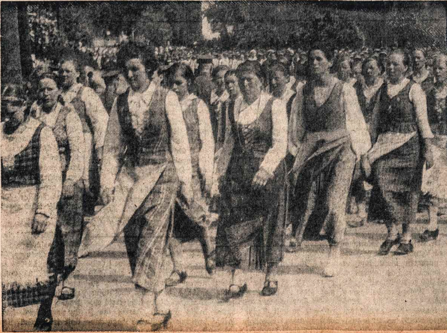
Pavasarininkų kongresas 1938 metais Kaune