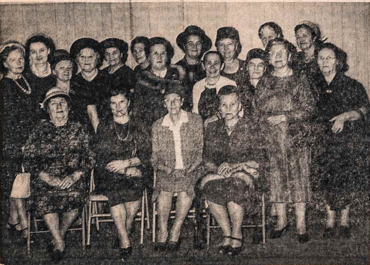
Dabartinė LKM Sąjungos 29 kuopos valdyba su jubiliejui rengti komisija.