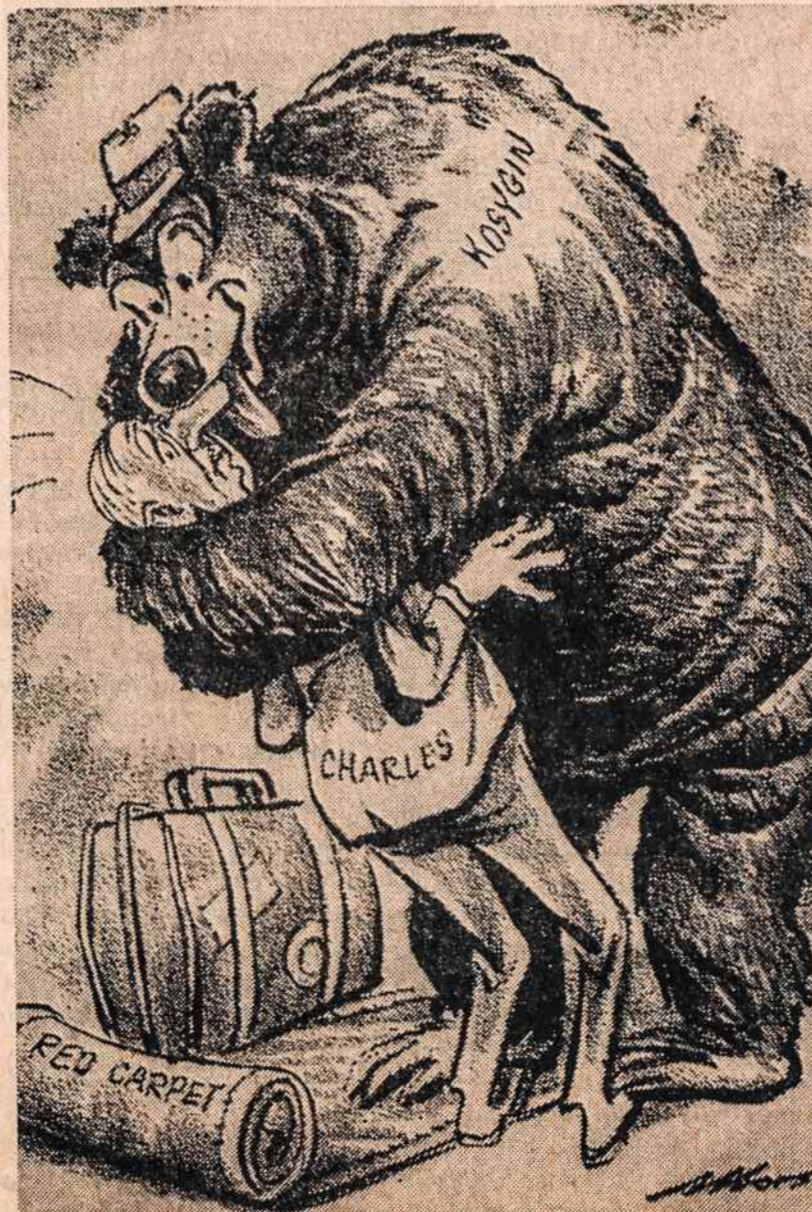
Suartėjimo politika: De Gaulle sako, kad suartėti su Kremlium reikia kiekvienam skyrium. Pagal Chr. Sc. Monitor vaizdą.