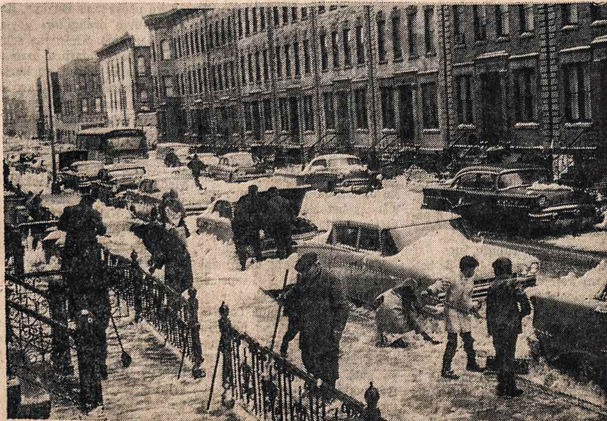
Nors Velykos, bet sniego pilna Brooklyno gatvėse.

Kirpėjas klientui: — Man atrodo, kad aš skutu jau ne pirmą kartą. Klientas: — Jūs klystate. Sie randai — autokatastrofos rezultatas.