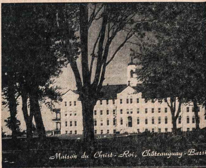
Nakvynių pastatas, kuriame ekskursija apistos Montrealyje

Organizuojamas autobusas į seselių pikniką Putnam, Conn., liepos 30. Autobusas išeina sekmadienį, 6:30 v. ryto, tuoj po mišiu, kurios bus laikomos 6 v. pranciškonų koplyčioje, 680 Bushwick Ave., Brooklyne. Kelionė asmeniui 10 dol., įskaitant ir įėjimą į pikniką. Registruotiis Darbininko administracijoj GL 2-2923, vakarais GL 5-7068, pas M. Salinskienę — VI 7-4499