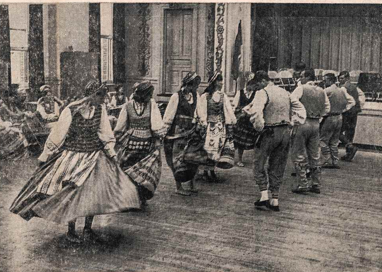
New Yorko tautinių šokių grupė atlieka programą Maironio mokyklos mokslo metų užbaigime.