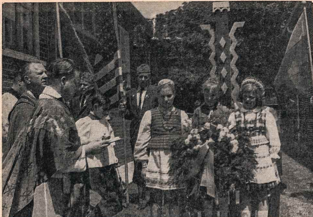
Detroito prie šv. Petro parapijos bažnyčios pastatytas lietuviškas kryžius Lietuvos vyčių 139 kuopos iniciatyva. Pašventintas birželio 18. Šventina parapijos klebonas kun. V. Stanevičius, kun. V. Kriškėničius.