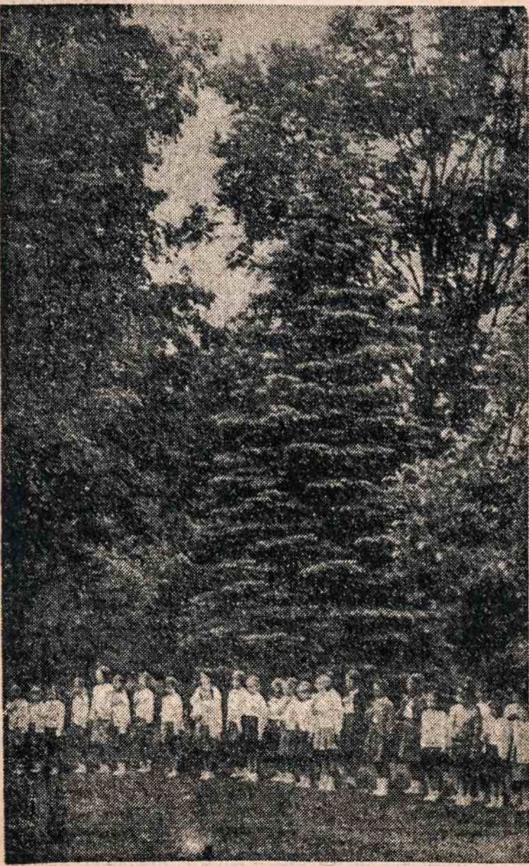
Putnamo vienuolyno sodyboje šią savaitę prasidėjo 24-ji mergaičių stovykla

422 Menahan Street, Ridgewood, Brooklyn, N. Y.