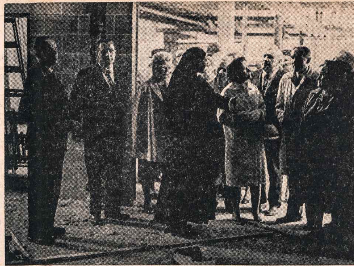
Šventinant kartinį Matulaičio namų akmenį, publika a pžiūri statybą.

Vienam namui turi būti padarytos dvi vandens sistemos, du dideli vandens rezervuarai. Vienas rezervuaras tarnauja šiaip einamiems dienos reika-