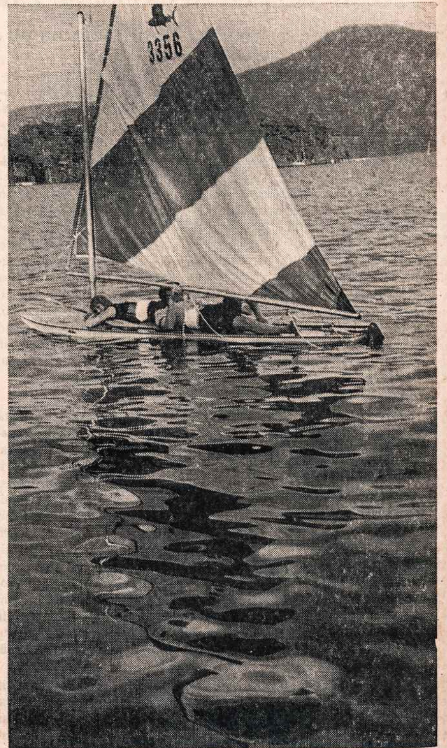
Lake George, N.Y. Prie šio ežero yra graži lietuvių šlyvynų BLUE WATER vasarvietė. Puikios sąlygos praleisti atostogas. Patogu pailsėti vykstant į Montrealo parodą. Nuo New Yorko per 200 mylių. Iš New York Thruway Exit 24, į Northway 87 iki Lake George Village; iš ten 9N keliu 7 myl. į šiaurę. Dėl informacijų kreiptis: Blue Water Manor, Diamond Point, N. Y. Tel. (518) NH 4-5071.

Auksas - sidabras - deimantai laikrodžiai 9408 Jamaica Ave. Woodhaven 21, N. Y. VI 7-2573