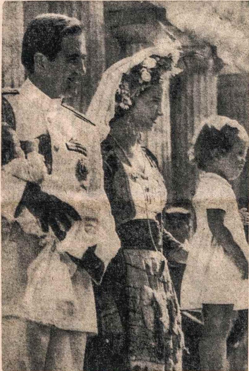
Graikijos karalius Konstantinas rankose laiko sosto įpėdinį Paulių, šalia karalienė Ona-Marija, dukrelė Aleksija. Nuotrauka prieš metus.

Vakarų Vokietija mėgina plėsti ryšius su satelitais — šiuo tarpu atnaujinti diplomatinis santykius su Jugoslavija. Vokietijos pastangos susiprasti su Maskva, susilaukė aukštos kainos: tegul Vokietija atsisaiko nuo pretenzijų į vakarų Berlyną, nuo pretenzijų į kraštus, kurie po karo teko Lenkijai. Puolimais prieš Vokietijos "nacizmą" Maskva siekia pirmiausia pripažinimo rytu Vokietijai ir per ją plėsti savo įtaką į dabartinę vakarų Europą.