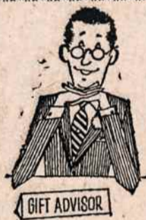
Ladies: Come to us with your problems

Country Squire Diner Open 7 Days A Week — 24 Hours A Day — FINE FOOD & GOOD SERVICE U. S. HIGHWAY NO. 130 Burlington, N. J. Call: 201 386-1113