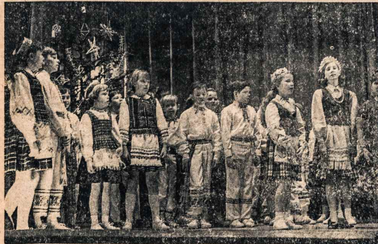
Eglutės programoje Maironio mokyklos mokiniai gieda Kalėdinę giesmę