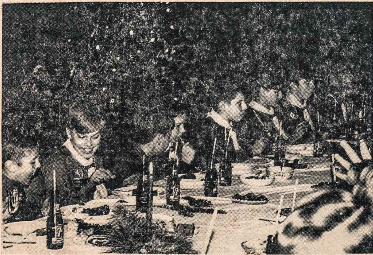
Iš skautų kūčių