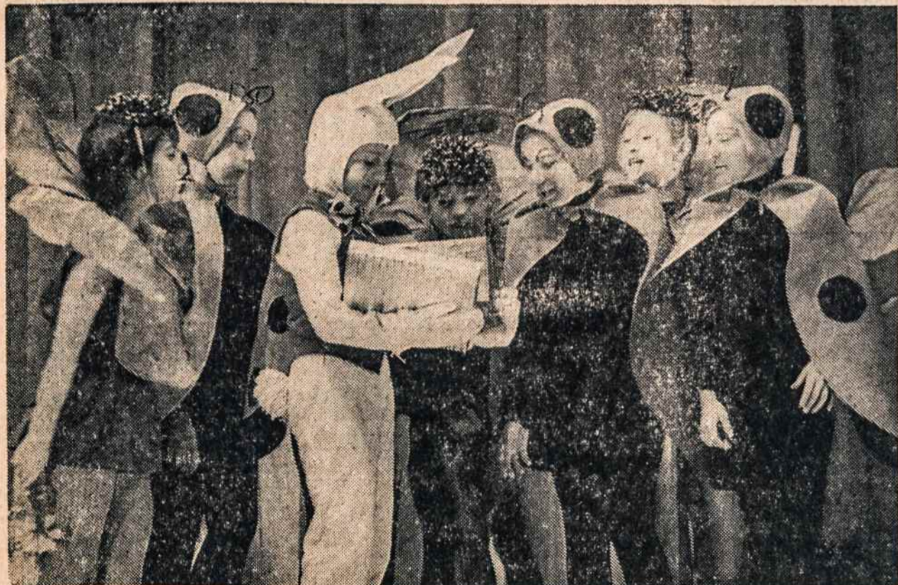
Scena iš "Karalaitės Teisutės" vaidinimo