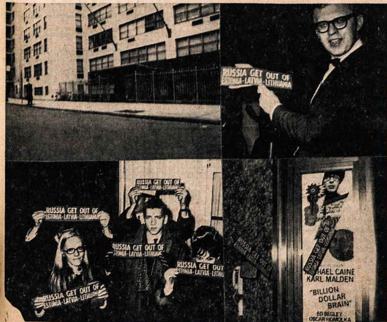
Latvių ir estų jaunimo grupė (Batuno organizacijos) Naujųjų Metų rytą prilipino plakatelius su įrašu "Russia Get Out of Estonia-Latvia-Lithuania" prie Sovietų atstovybės namų ir prie Broadway vieno kino, kuriame rodomas prokomunistinis filmas, vaizduojas ir latvius.