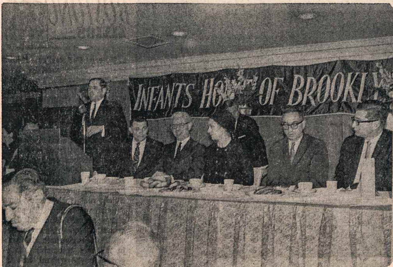
Brooklyne buvo surengti pusryčiai JAV ambasadoriui Goldbergiui. Šalia — Edna F. Kelly, JAV kongreso narė, kuri rodo daug dėmesio lietuviškam reikalui.