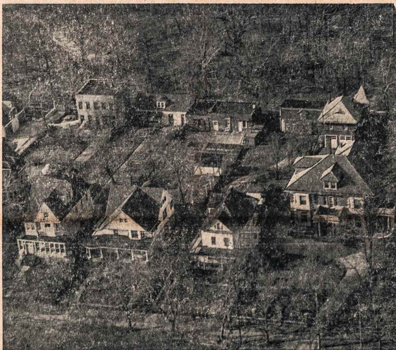
Vieta su dabartiniais pastatais Highland Parke, Brooklyne, N. Y., kur pranciškonai pastatys vienuolyną ir kultūros židinį.

Jei didesnes "fantazijas" per vėlu įvykdyti, tai bent ši maža "fantazija" — prasiveržti į vietinę amerikiečių spaudą Vasario 16 proga — dar įmanoma įvykdyti. Tik laiko ir jai labai nedaug.