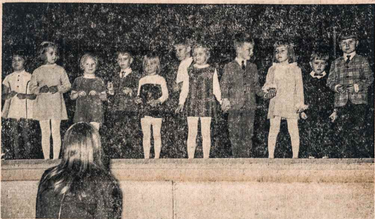
Vaikų darželio mokiniai deklamuoja eilėraštį