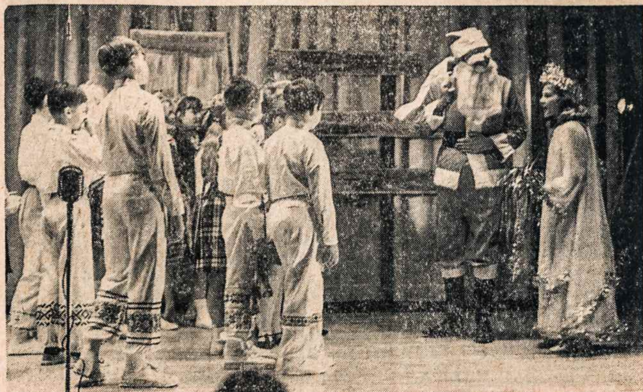
Scena iš "Karalaitės Teisutės" — atvyksta Kalėdų senelis