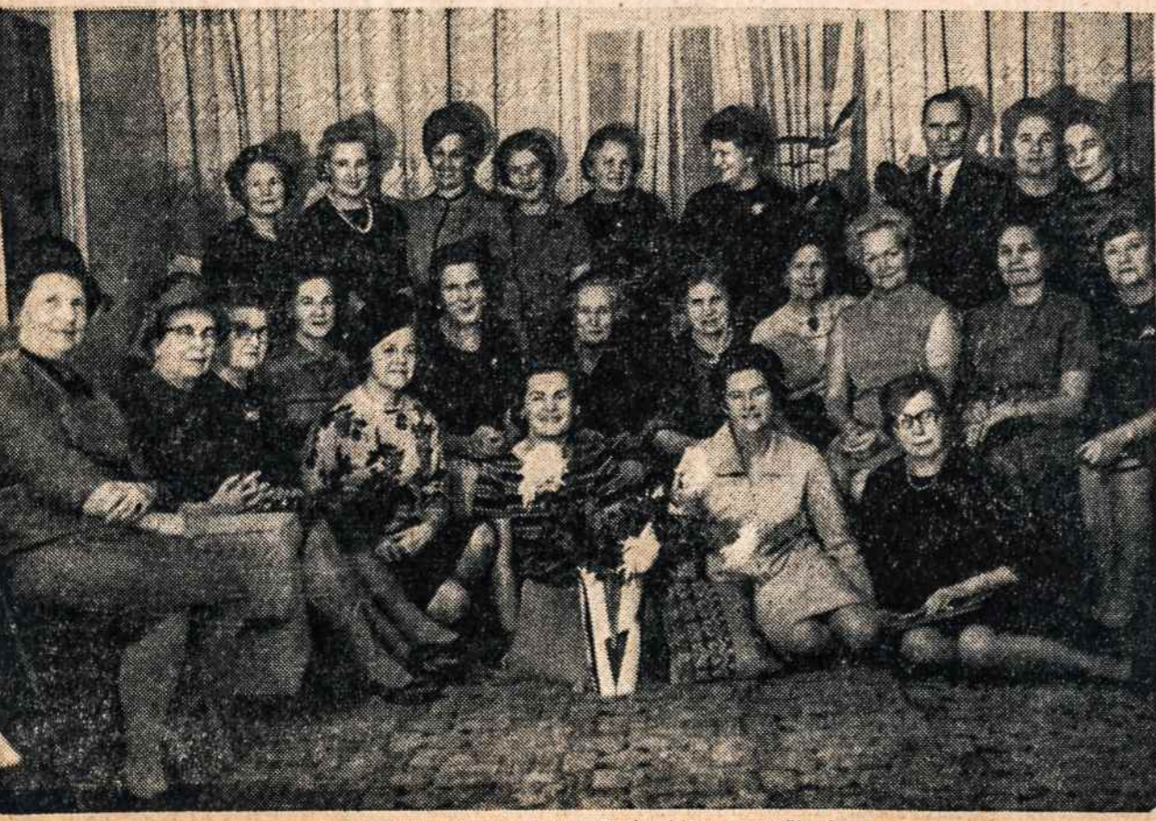
LMF New Yorko klubo susirinkime gruodžio 6.