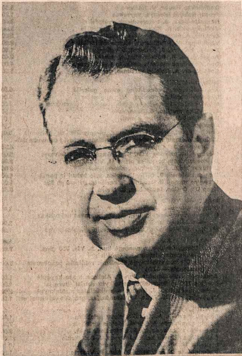
Sen. Vance Hartke iš Indianos, pasakys pagrindinę kalbą Lietuvos nepriklausomybės sukakties minėjime vasario 18 Civic Operos rūmuose Chicagoje

Chicago Lietuvos Tarybos Informacinė Taryba