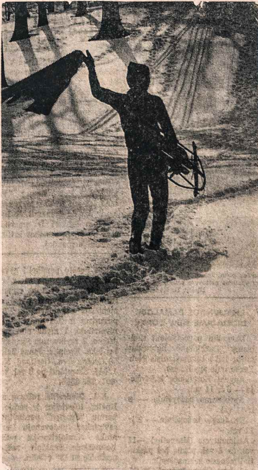
Su rogutėmis į kalnus

SKAITYTOJAMS palengvinti išsiųsti prenumeratą, dedamas šis lapelis.