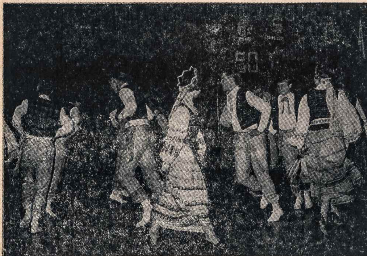
Žilvinas, Philadelphijos tautinių šokių grupė, šoka pabaltiečių bankete