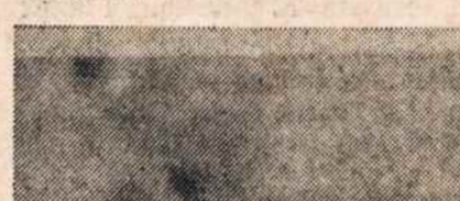
Washingtono ketvirtadienio naktį tokių gaisrų buvo priskaičiuota 706.

— Pittsburghe iki balandžio 8 buvo priskaityta 188 gaisrai New Yorke balandžio 4 naktį išplėsta keli šimtai krautuvių Bedford Stuyvesant bei Harleme.