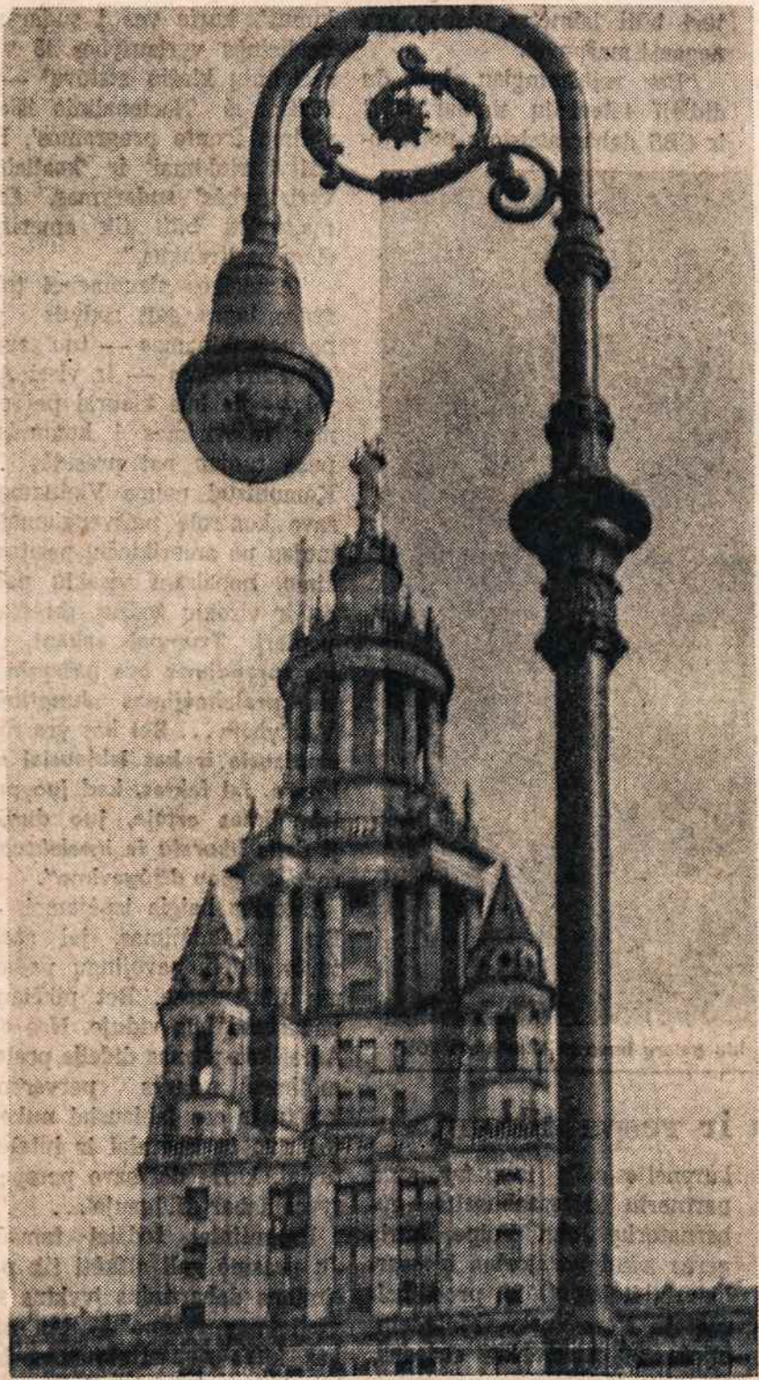
New Yorko miesto rotušė

DOVANŲ SIUNTINIAI Į LIETUVĄ — Mes siūlome nepalyginamą patarnavimą. Firma Union Tours egzistuoja nuo 1931 m. Per tuos praėjusius 36 metus nei vienas siuntinys nebuvo gražintas ir nei vienas neįvyo. Mūsų ilgų metų patyrimas leidžia mums ir mūsų kvalifikuotam štabui išpildyti visas pareigas, susietas su siuntinių priėmimu, supakavimu, ir tų siuntinių išsiuntimu. Išmėginkite mūsų patarnavimą ir būsite patenkinti. Mes turime didelį pasirinkimą įvairių siuntiniais daiktų — geriausių siuntinui ir tai pigiausiomis kainomis; pas mus gausite visko, ką tik jūs norėsite siųsti draugams ir giminiams. Reikalaukite mūsų nemokamų katalogų — UNION TOURS 1 East 36th St. New York, N.Y. 10016. Aplankykite mūsų skyrius: Chicago, Ill. 2219 W. Chicago Ave. 60622; Los Angeles, Calif. — 344 North La Brea Ave. 90036.