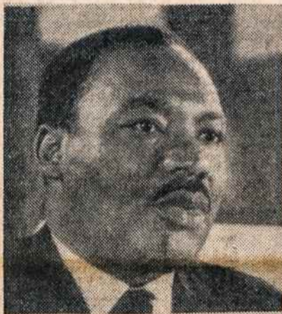
Dr. Martin Luther King — gimė 1929, nužudytas 1968

King buvo nušautas balandžio 4 d. 18 val. Memphis mieste, viešbučio balkone į sprandą ir po valandos mirė. Sūvis atėjo iš priešais esančio namo už 205 pėdų. Tame name tą dieną buvo išsinuomos kambariai apie 20 metų vaikas, kuris po įvykių dingio. Matė, kaip jis išbėgo iš namų ir prie netolimo namo paliko popieriuose susuktą šautuvą. Bet dingio