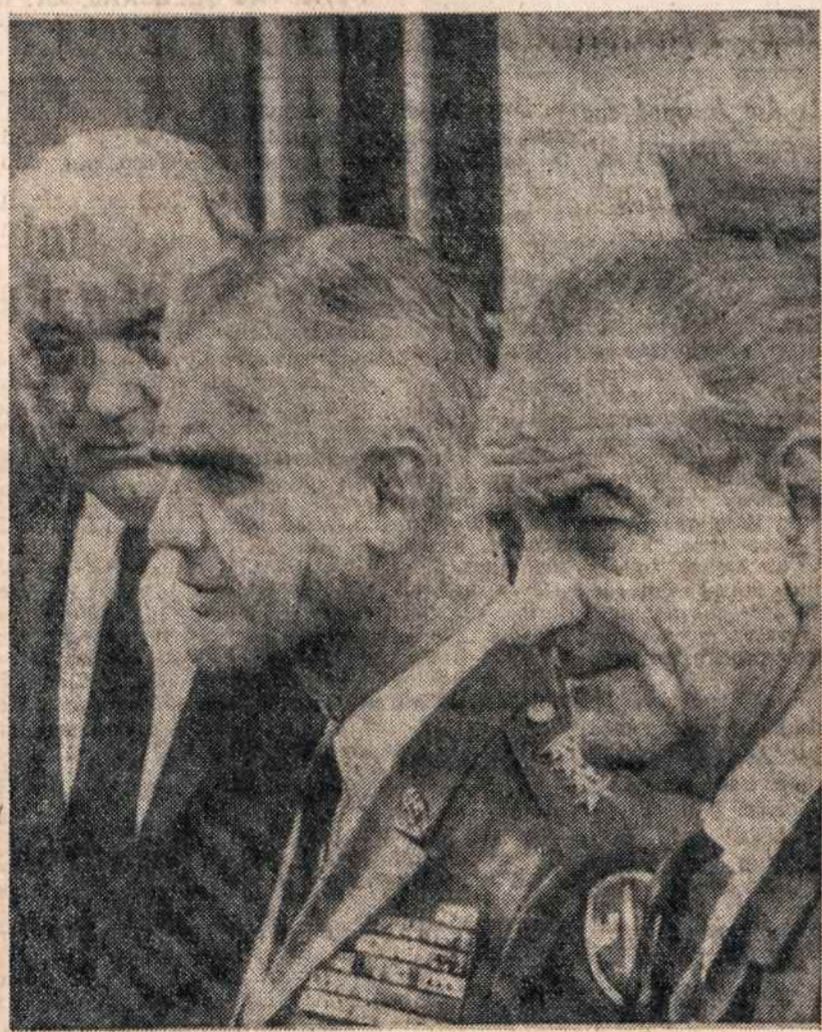
Jie tiki laimėjimu ir pasiryžę jį Amerikai duoti: prezidentas Johnsonas, valstybės sekretorius Rusk, gen. Westmoreland

— Ženevoje balandžio 7 sutiko 4 dienom 49 teologai bei filosofai — protestantų, katalikų, ortodoksų. Jie svarstysią bendrus punktus tarp krikščionybės ir marksizmo. Būdinga, kad iš Sovietų niekas nedalyvauja.