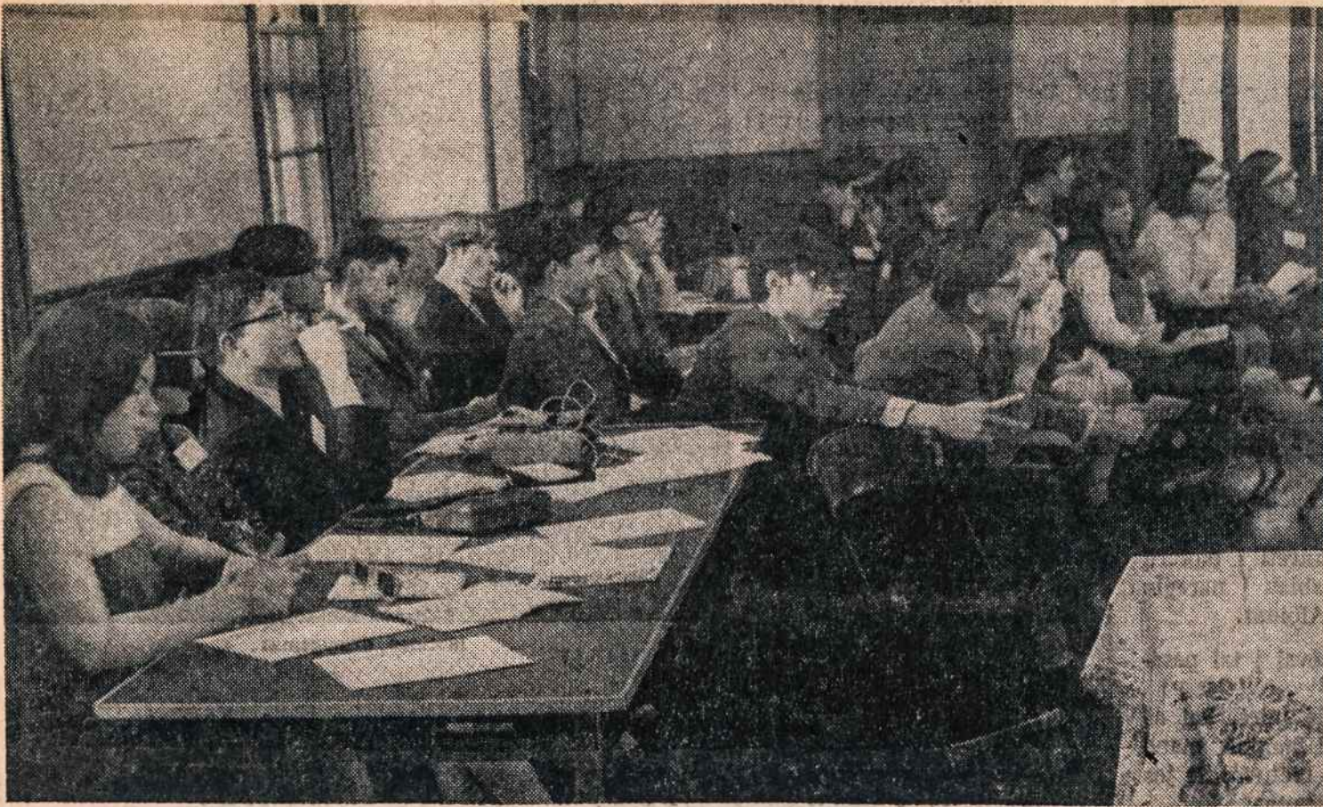
Studijų dalyviai klausosi paskaitos