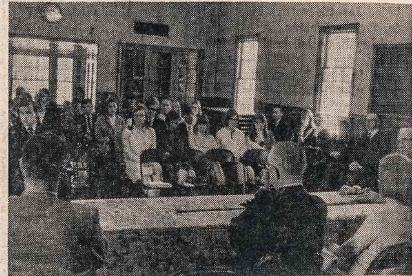
Studijų dienų posėdis