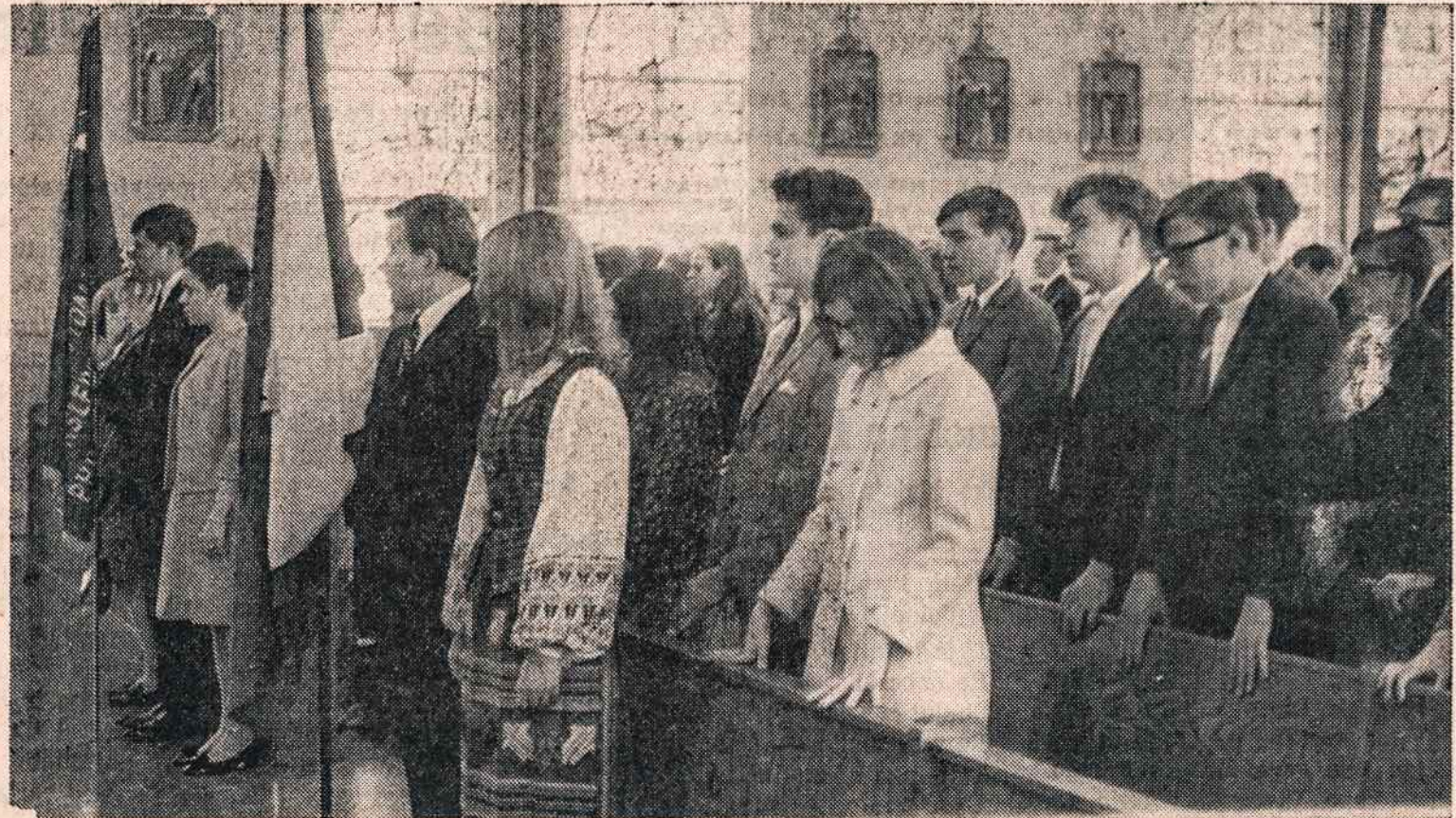
MAS studijų dienų dalyviai Patersono, N.J. lietuvių bažnyčioje.