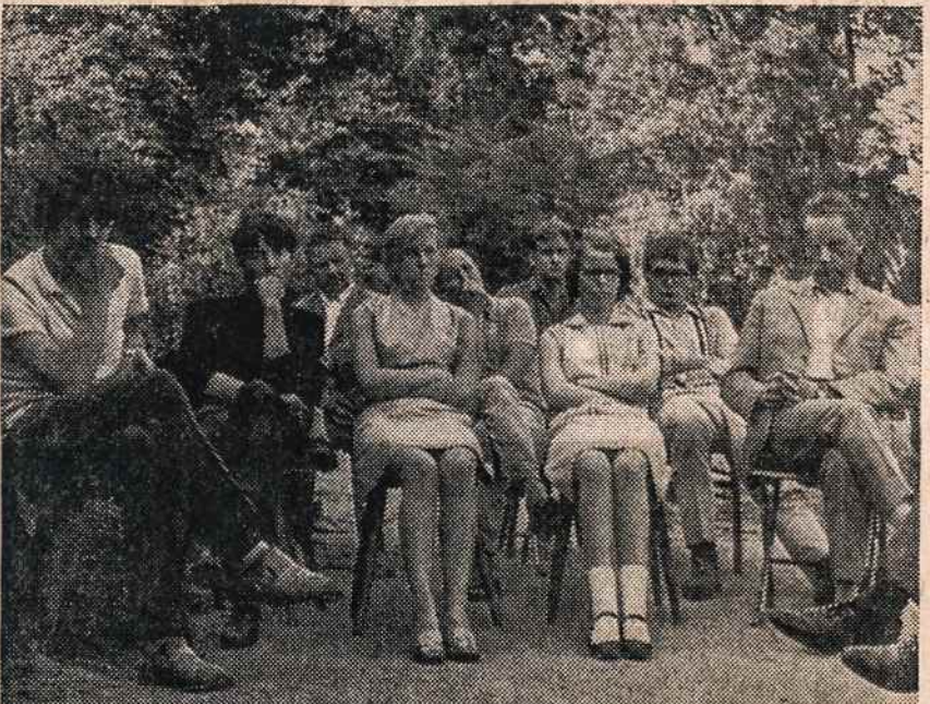
Europos lietuvių jaunimo suvažiavime Romuvoje — Vasario 16 gimnazijoje