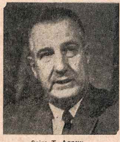
Spiro T. Agnew

aš tave sudeginsiu". Jis kreipėsi ne į ligonį, bet į kažką kitą. Korespondentas ir minia suprato, kad kreipiasi į piktąją dvasią. Kai kunigas pridėjo kryžių prie ligonio lūpų, "Ne, ne, tu mane kankini!" — buvo atsakymas. "Kas tu esi? Ar esi iš vandens ar iš žemės?" šaukė kunigas pagal rytietišką paprotį. "Sergijus, Sergijus" buvo silpnas atsakymas. "Kaip seniai čia esi?" kietai klausinėjo toliau. "Dvidešimt metų. Aš dabar išeisiu". "Duok man ženklą, pro kur tu išeis?" įsakinėjo kunigas. "Pro koją, pro kairiąją". Po kiek laiko ligonio koja pakilo į orą, sudrebėjo ir paskui bejėgiškai nukrito atgal. "Dabar ramybė su tavimi", triumfuojančiai tarė kunigas. Žvakių šviesoje minioje ėmė reikšti džiaugsmą rytietinių būdu.