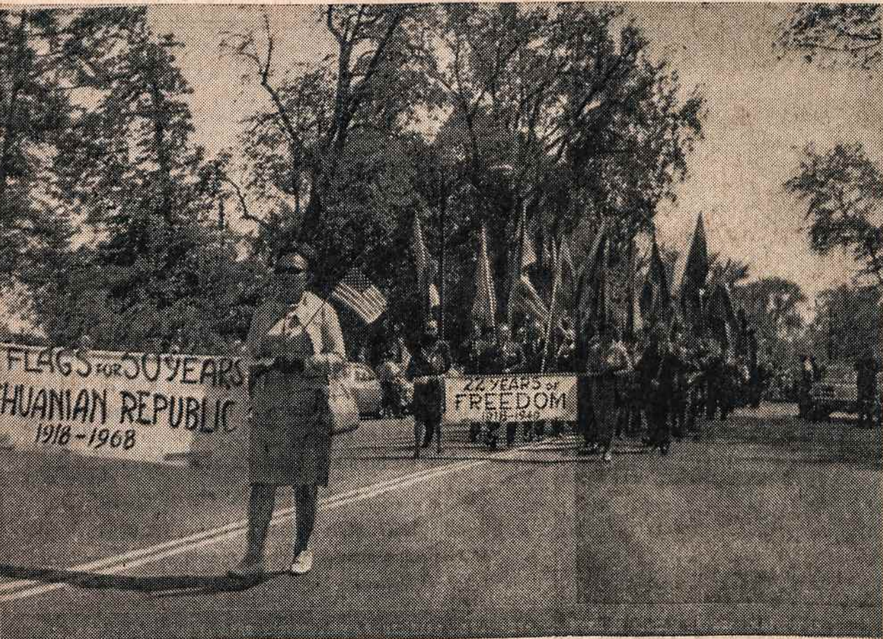
Connecticuto lietuviai neša Waterburio pagamintas lietuviškas vėliavas lojalumo parade Hartforde.

Įamžinkite save ir savo šeimos mirusius šiame kilniame darbe Dievo garbei ir Tėvynės labui. Paskubėkite dosnia auka, kad visi statybos darbai kuo greičiau pasistumėtų pirmyn. Nepamirškite šių kilnių planų prisiminti ir testamentuotė. Mūsų padėka ir maldos. Dabarties ir ateities kartos nepamirš Jūsų. Auką siųsti: Building Fund, Franciscan Monastery, 680 Bushwick Avenue, Brooklyn, N.Y. 11221.