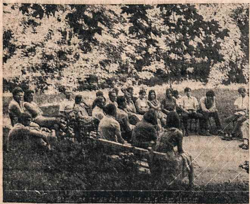
Romuvos parke diskusijos religinėm temom