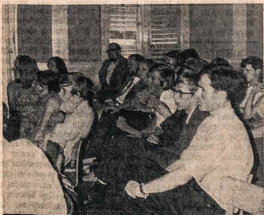
Jaunimas pilies salėje klausosi paskaitų.

Iš tikrųjų buvo kuo džiaugtis. Gausus lietuviškojo jaunimo būrelis net 4 dienas klausėsi paskaitų, diskutavo ir linksminosi savųjų tarpe. Nors vakarais salėje buvo galima pirkti alaus ir vyno, bet įgerusių nesimatė. Rengėjai ir stebėtojai turi pagrindą didžiuotis kultūringa mūsų jaunimo ir jų svečių laikysena.