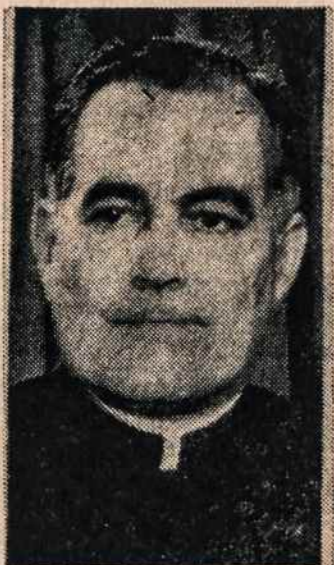
Rev. Theodore M. Hesburgh, Notre Dame u-teto prezidentas, prez. R. Nixono paskirtas JAV civilinių teisių komisijos pirmininku. Nuo 1958 jis yra tos komisijos nariu. Jis neseniai atkreipė į save prezidento ir viso krašto dėmesį, paskelbęs naują tvarką savo studentų neprotinoms riaušėms sutramdyti.

P. Vietnamo vyriausybė 1969 krašto pacifikacijos planus esanti labai išplėtusi keliom kryptim: rengiama daugiau policijos kaimų valymui ir apsaugai, kad iš tų pareigū būtų atlaisvinti kariai fronto pareigoms; saugūs rajonai šiemet jau galės išsirinkti savo pareigūnus ir sugrįžti prie senų tradicijų; rinktieji organai gaus daugiau atsakomybės ir pinigų, sumažinant reikiavimą iš viršaus; iki šiol vis traukdoma žemės reforma būsianti vykdoma labai energingai. Tai labai gerai žinia. Dar geresnė ta, kad nebus atimta žemė iš tų, kurie ją gavo iš Vietkongo komunistų.