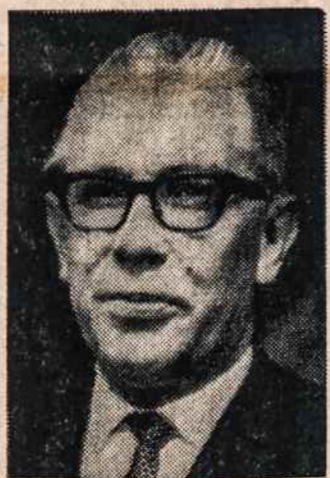
Kai-Uwe von Hassel, naujasis V. Vokietijos parlamento pirmininkas, išrinktas vietoj ligamečio pirm. dr. Gerstenmalerio, — turėjusio pasitraukti dėl kompensacijos paėmimo už nacių režimo metu patirtas skriaudas.

Valstybės Tarybą Prancūzijoje rado, kad prez. de Gaulle paskelbtas plebiscitas dėl senato ir savivaldybių organų pertvarkymo yra neteisėtas. Tokia JAV vyr. teismo nuomonė būtų prezidentui privaloma, bet taip iki šiol nėra Prancūzijoje, todėl nemanoma, kad de Gaulle plebiscitą atšauktų. Vieną kartą jis tokios nuomonės jau yra nepaklausęs, ir liko nenubaustas.