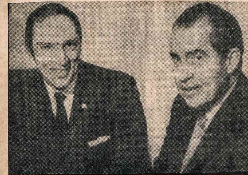
Kanados premjeras Trudeau pokalby su JAV prezidentu Nixonu

— Rusijos karo laivyno didelė grupė vakar pasirodė Atlanto šiaurėje vakariniame Anglijos šone. Manoma, kad toji armada plaukia į Vladivostoką ryšium su apsišaudymais Rusijos Kinijos pasieny. Grupėje matomi povandeniniai laivai, kreiseriai, naikintuvai, tanklaiviai ir kiti pagalbiniai laivai. Britų aviacija tuojau pradėjo jų stebėjimą. Vėliau perims stebėjimą Nato aviacija ir vykdys tol, kol paaikšės tos armados kelionės tikslas.