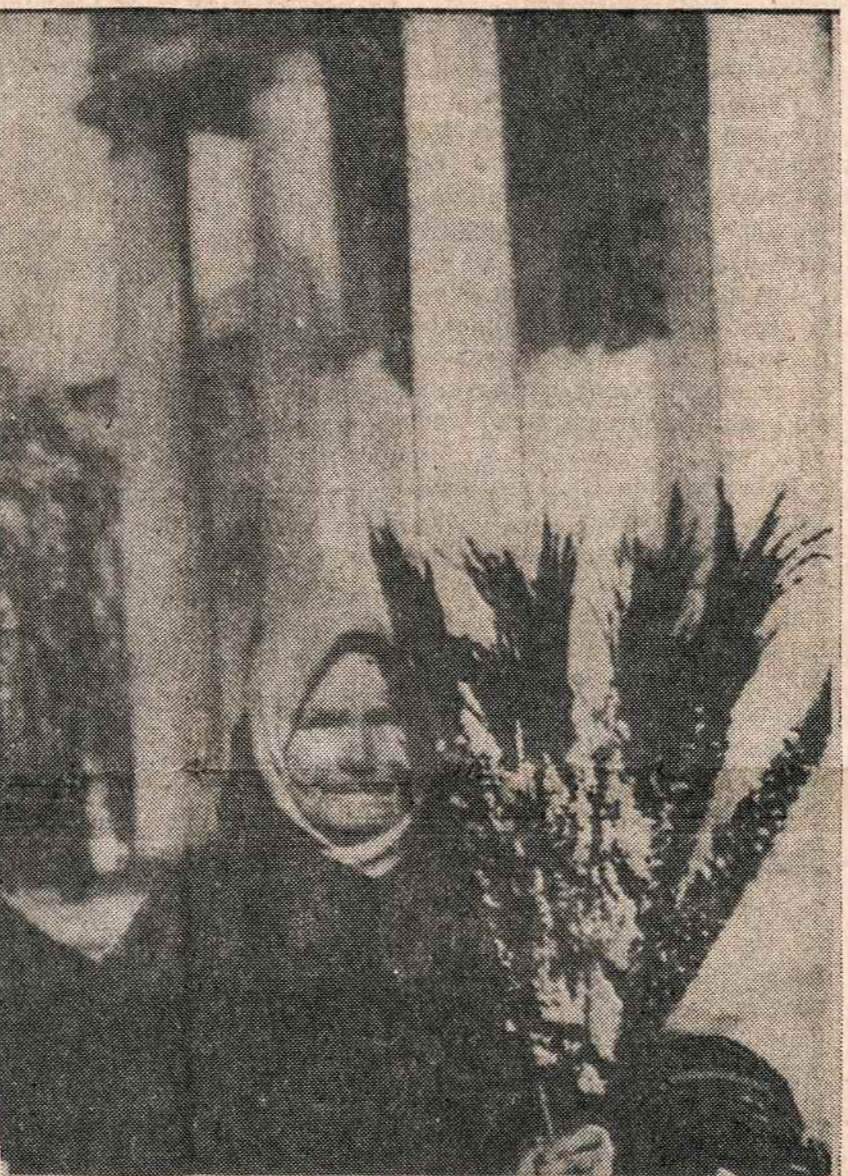
Su verbom Vilniuje prie katedros.

Ir kokius nuostabius dalykus jis daro, tas vienas, nesvarbu, kuris iš penkių — manau tas, kurio buvo persmeigta neria- ma kojine ar tumpinė. O kaip jis daro? Negali atsistebėti. Kaip Mama parenka reikiama popierių, kaip ji sukarmo siau- romis juostelėmis, kaip apvynio- ja ant virbalo labai atsargiai, lygiai, išlygindama pirštais! Ir