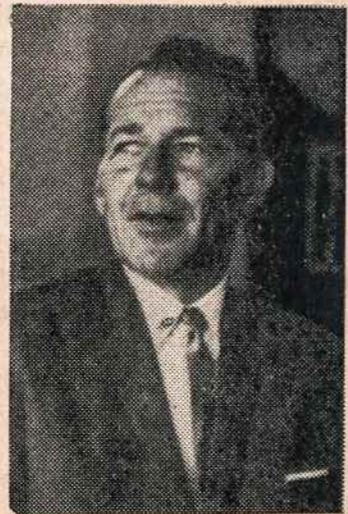
Robert H. Finch

Prez. Nixonas savo pareiškime teigia, kad mokslo įstaigose atsiradusios riaušės, jei bus leista ir toliau siautėti, sugriaus aukštojo mokslo institucijas, nes riaušėmis siekiama panaikinti intelektualinę laisvę, nužeminti mokslo lygį ir tas institucijas paversti politinių kovų arenomis. Jis pakartodamas pabrėžia, kad politinis tikslas ypač esąs išryškėjęs riaušių eigoje.