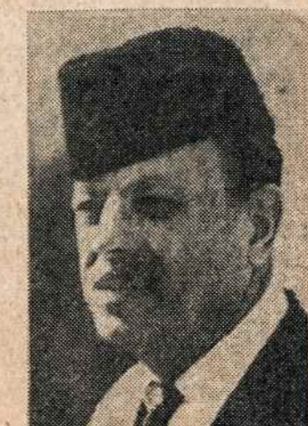
Pasitraukęs Pakistano prezidentas Mohammad Ayub Khan

— Pakistano valstybinis gyvenimas visai paio. Rytinėje krašto dalyje vyksta riaušės, žudynės, turto deginimas. Pasitraukė prez. Ayub Khan, visą valdžią perėmė karinių pajėgų vadas, krašte įvestas karo statusas. Pažadėta šaudyti, jei nepaklausys įsakymo nusiraminti. Prašoma pasifikuoti kariuomenę, nes ji ateinanti kaip draugas. Jeigu sukilime nėra komunistų rankos, ramumas gali sugrįžti be dabartinių valstybės sienų pakeitimo, bet gali atsitikti ir taip, kad rytinis Pakistanas, kurį nuo vakarinio skiria 1,000 mylių pločio Indijos teritorija, gali pasiskelbti nepriklausoma valstybe. Tokios nuotalkos dar neseniai ten buvo labai gyvos.