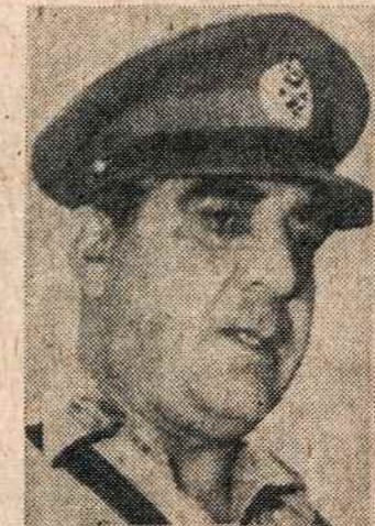
Valdzia Pakistanė perimęs generalas A. M. Yahya Khan