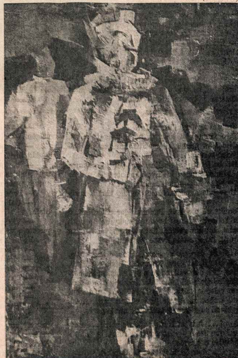
Dail. Rimo Laniausko paveikslas "Išsiskyrimas", iš statytas parodoje New Yorke.

"Pas Rochesterio lietuvius" dėl padaugėjusių Velykų švenčių skelbimų nutraukiame. Jie bus tęsimi po Velykų.