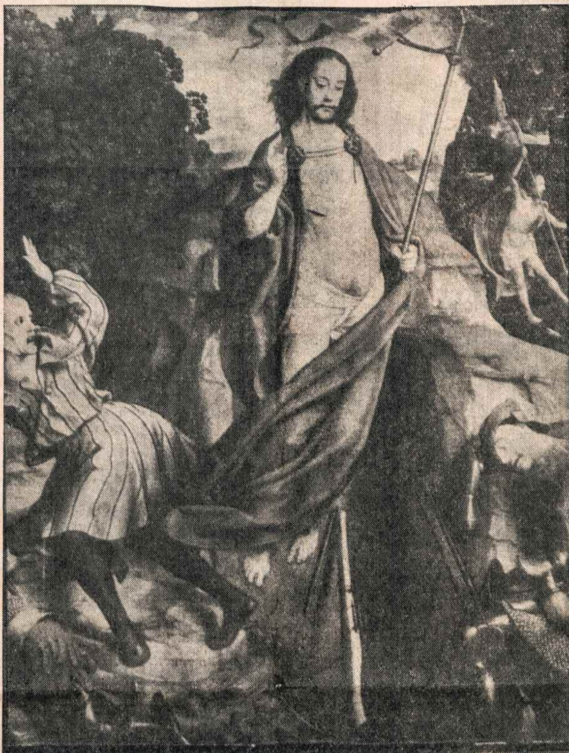
Kristaus prisikėlimas. Altoriaus paveikslas iš XVI šimtmečio

— Federalinis Bostono teisėjas rado, kad Amerikos karinės prievolės įstatymas prieštarauja konstitucijai, nes nenumatęs paliosavimo nuo karinės tarnybos tų asmenų, kuriems ji nepriimtina ne dėl religinių įsitikinimų, nes jie tokių neturi, bet dėl moralinio pobūdžio sąžinės priekaištų. Nutarimas bus skundžiamas tiesiai Vyr. Teismui.