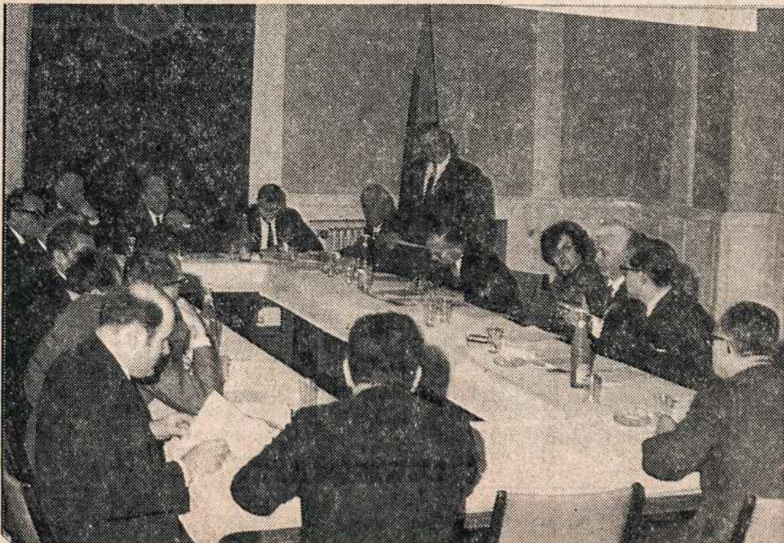
Bendras Tarybos posėdžio vaizdas