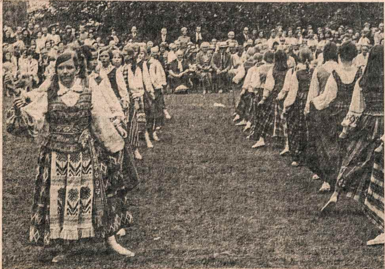
Putnamo mergaičių stovyklos uždarymo šventėje liepos 27 mergaitės šoka Sadutę.

Salzburger Nachrichten liepos 19: "Dainininkė, dar labai jauna, Lietuvoje gimusi ir šiaurės Vokietijoje užaugusi, Lil-