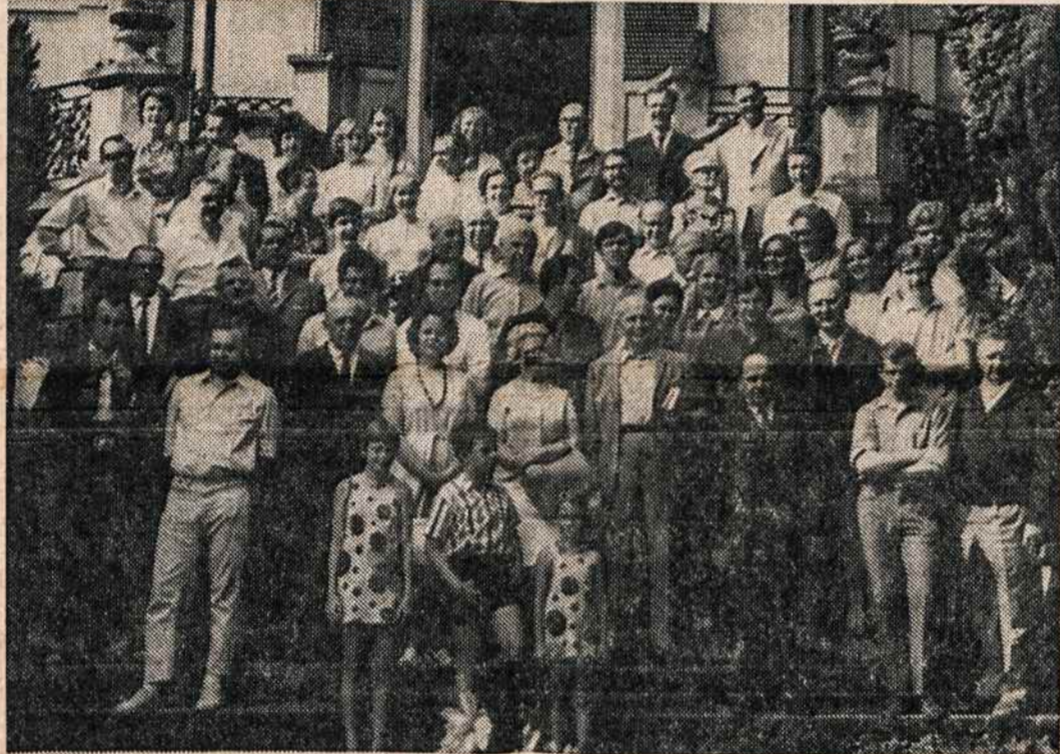
XVI lietuvių studijų savaitės dalis Bad Godesberge Pabaltijo krikščionių studentų sąjungos namuose Annaberge.