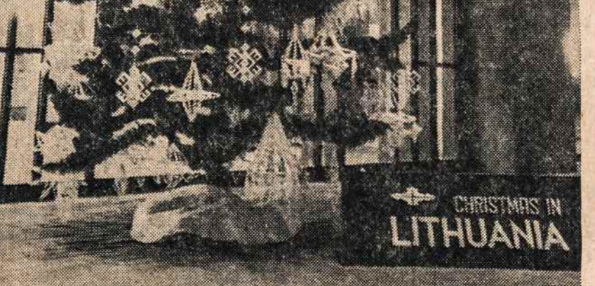
Bostono miesto savivaldybės rūmuose pastatyta lietuviška eglaitė, kurią papuošė skaučių židiny.

Miesto savivaldybės rūmai yra atidari ir šeštadieniais nuo 10:30 iki 3:30 popiet.