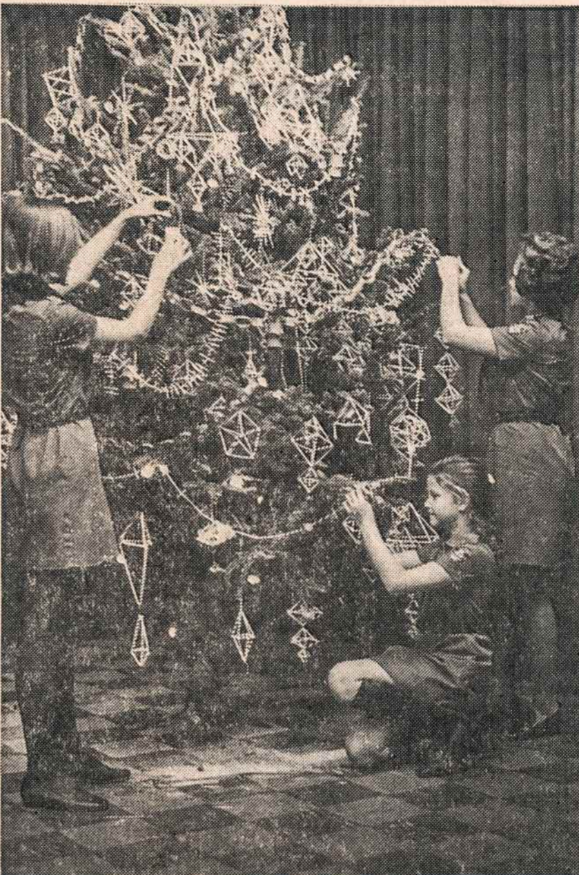
New Yorko skautės puošia eglutę gruodžio 21 besirengdamos savo kūčiomis.