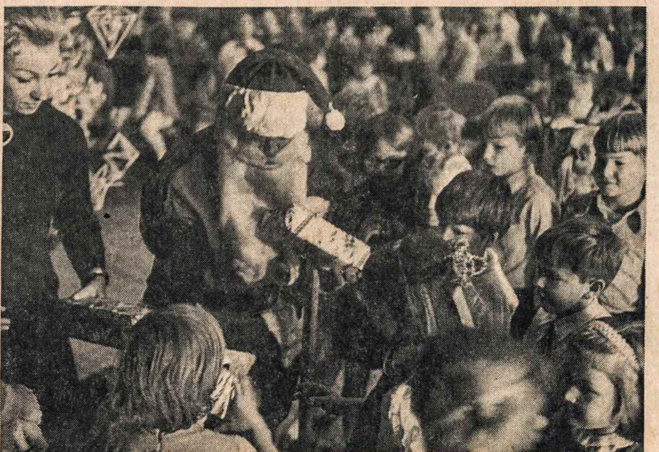
Kalėdų Senelis dalina dovanas vaikučiam gruodžio 20 Maironio šeštadieninėje mokykloje, Brooklyn, N.Y.

Tokius automobilius jau pradėjo gaminti Fordas, General Motors ir American Motors.