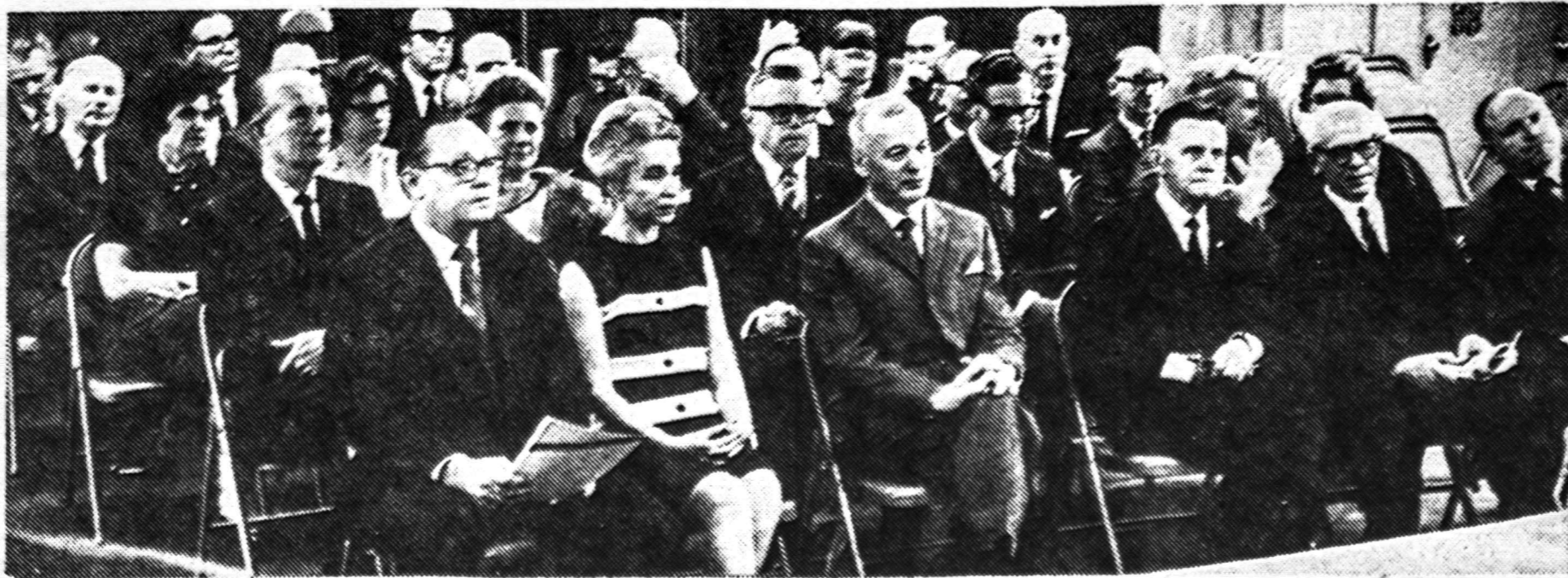
Balandžio 26 Maspetho lietuvių parapijos salėje buvo Liet. Fronto Bičiulių Rytų apygardos suvažiavimas, kuriame dalyvavo bičiuliai iš Philadelphiajos, Newarko, New Yorko ir Waterburio. Nuotraukė — suvažiavimo dalyviai klausosi pranešimų.