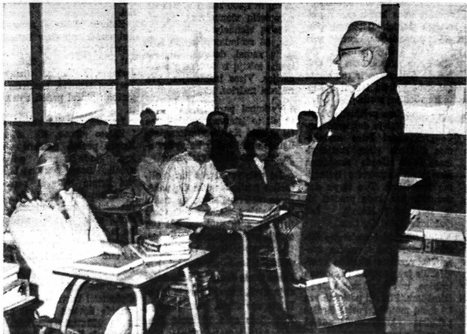
Pamokos metu klasėje. Mokosi tarti vokiškus žodžius.

LITAS SERVICE CORPORATION patarnauja nekilm. turto pirkimo-pardavimo reikaluose.