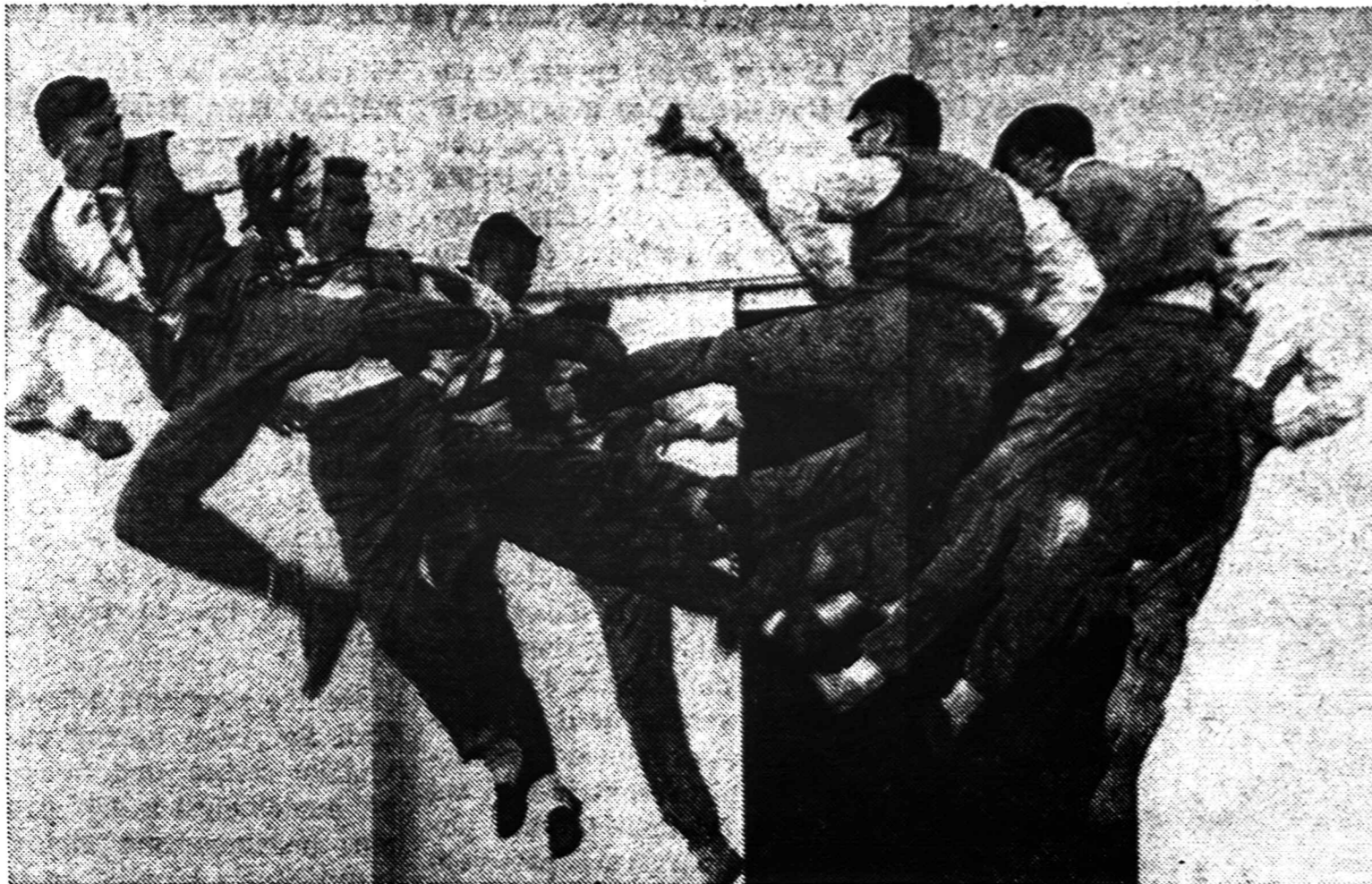
Šitaip šoka New Yorko lietuvių tautinių šokių grupės vyrų. Grupė mini savo veiklos 20 metų sukaktį ir ta proga rengia iškilmingą koncertą gegužės 16 d. 6:30 v.v. Marian Manor (buvusioje svabų salėje) Brooklyne. Be tautinių šokių grupės dar dalyvauja žibuoklių sekstetas, vadovaujamas L. Stuko.