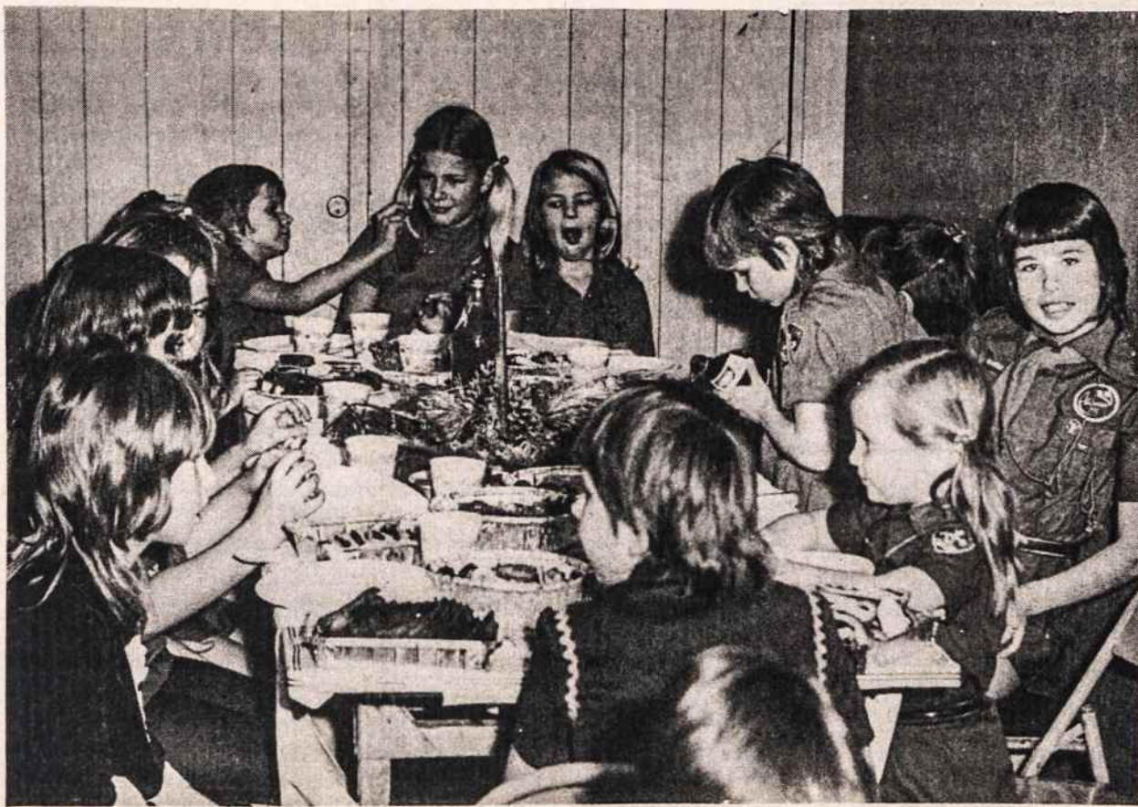
Skautų kūčiose Brooklyne.