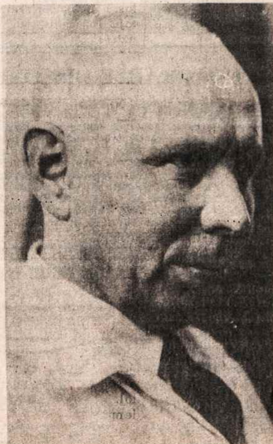
Skulptorius Juozas Zikaras