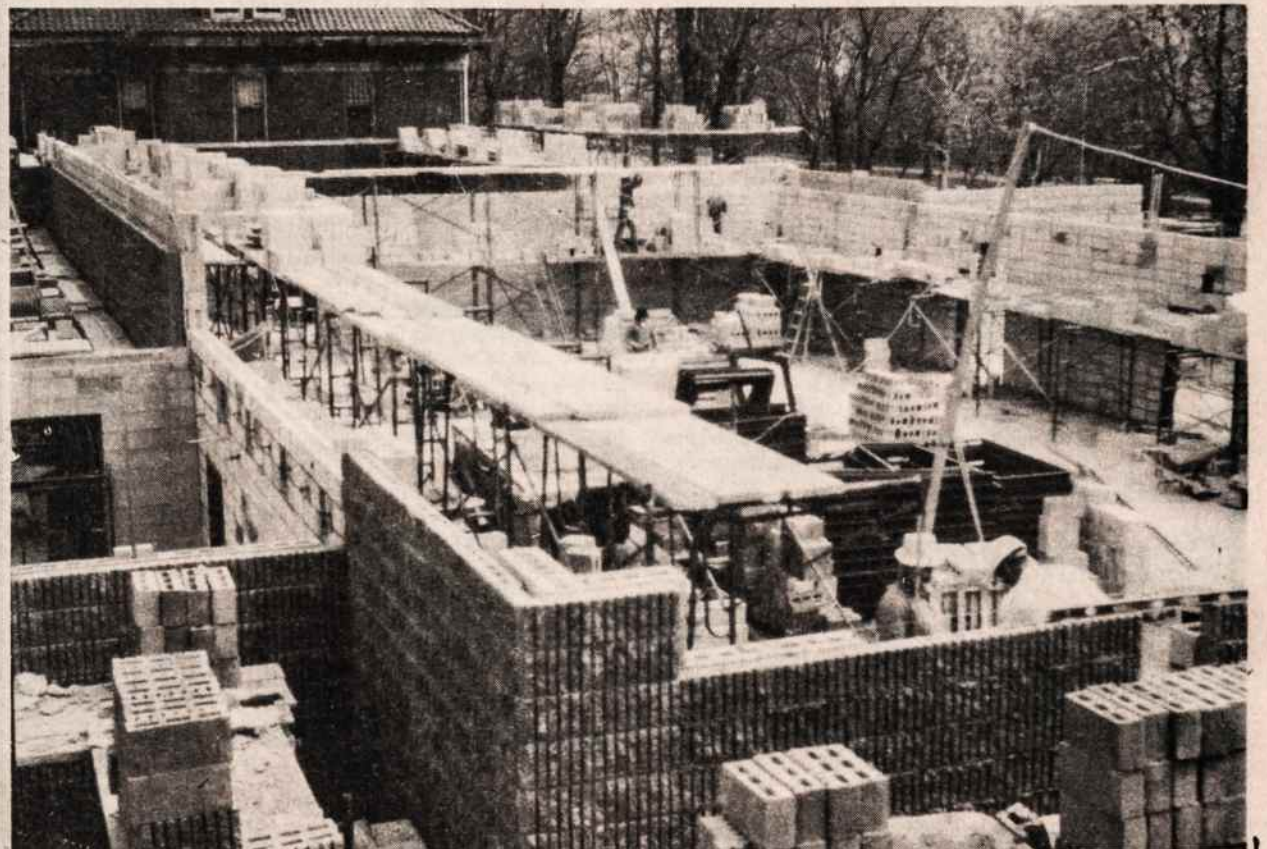
Kultūros Židinio statyba auga pilnu tempu. Čia matome kylančias salės sienas.