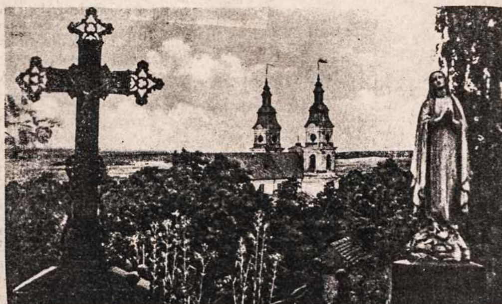
Žemaičių Kalvarijoje, kuri dabar pavadinta Varduva, šią savaitę vyksta didieji atlaidai, į kuriuos suvažiuoja žmonės iš visos Žemaitijos. Nuotraukoje — vaizdas nuo kapinių kalno.