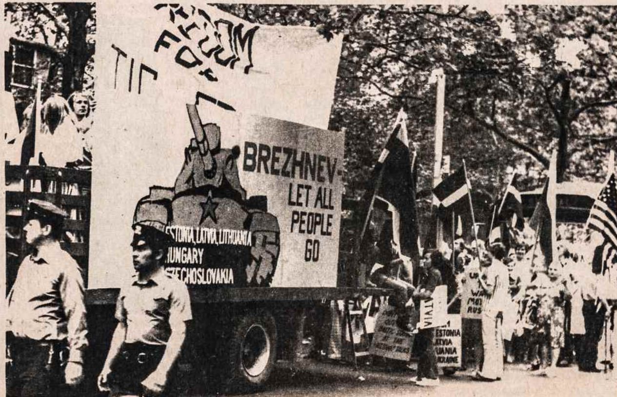
Baltiečių demonstracija prie Jungtinių Tautų New Yorke birželio 23.

Afrikoje nuo Saharos į pietus didelės sausros, kokių nebuvo 60 metų. Sešiem milijonam žmonių gresia badas. Maisto pristatyti mėginama lėktuvais. Sausros taip pat Š. Vietname ir Kinijoje.