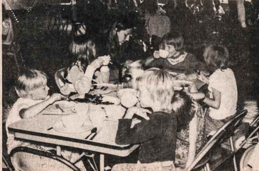
17-toje mergaičių stovykloje Dainavoje mergaitės vaišiniasi. Nuotr. Tėv. A. Tamošaitis, S.J.