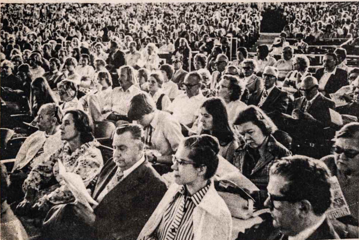
Įvairių tautų publika klausosi pabaltiečių programos birželio 17 Garden State Art Center New Jersey.

Lietuvių radijo programų klausau — dažnai 17.18, retai 39.53, niekada 20.4, programų iš viso nėra 22.82. Skaitau lietuviškus laikraščius ir žurnalus — ne vieno 10.41, vieną 23.67, 2-5 55.92, 6-10 5.80, 11 ar daugiau 4.18.