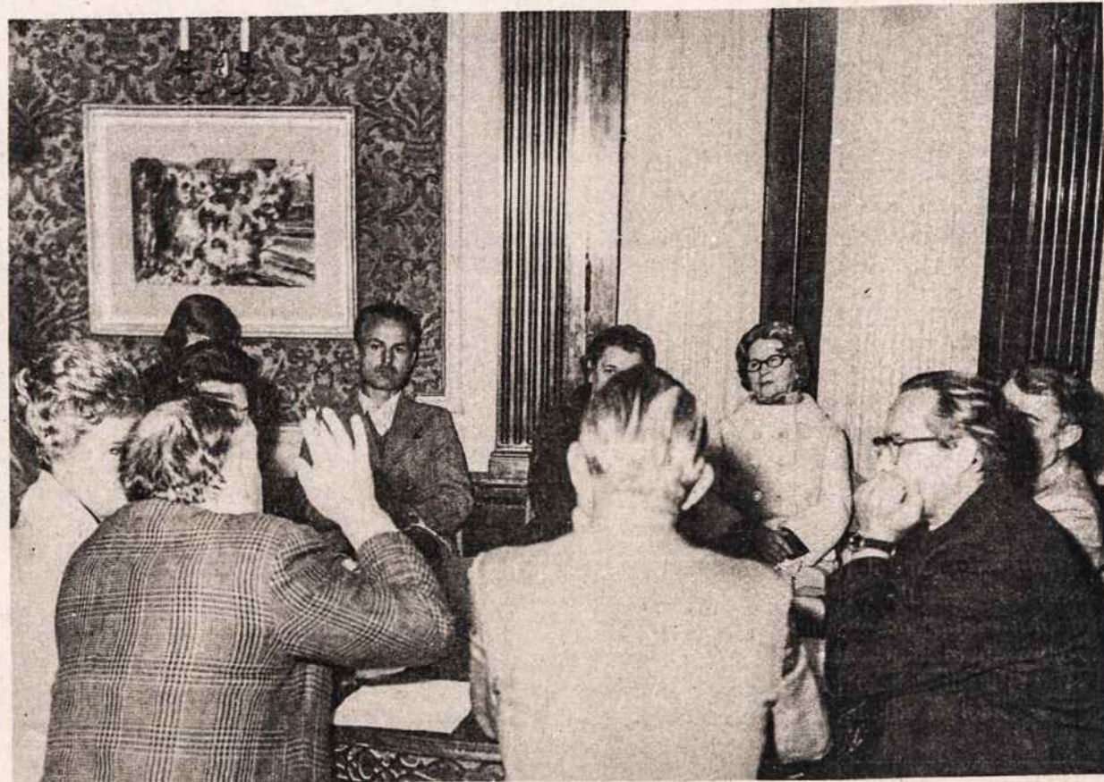
Kultūros Židinio atidarymo šventės komiteto narių dalis spalio 23 d. posėdy.