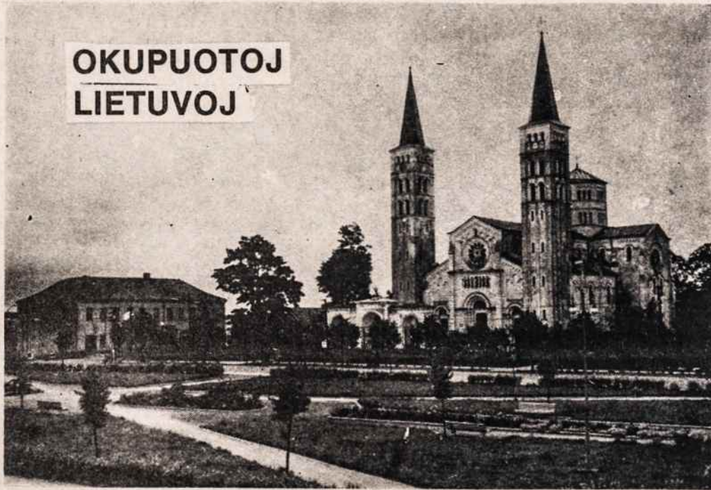
Rietavas. Buvusioje turgaus aikštėje ties bažnyčia dabar įrengtas miesto sodelis.

Kas yra Dievas, jei reikia įrodinėti, kad jo nėra