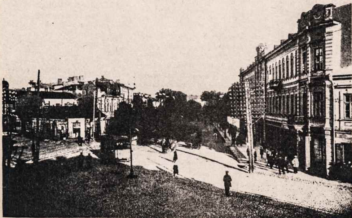
Senasis Kaunas, Laisvės alėja su "konke" apie 1921 metus.