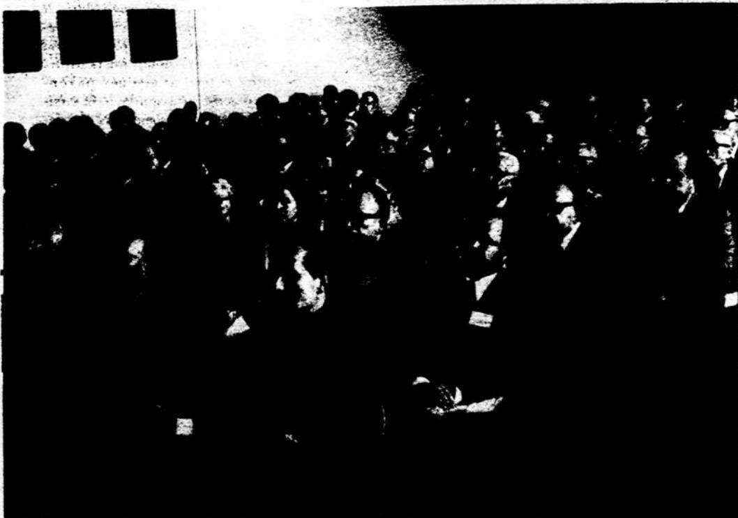
Publika mokslo simpozijumo atidaryme.