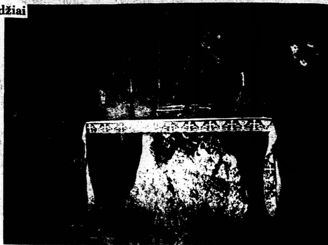
Vieta, kur šv. Pranciškus įrengė pirmą prakartelę