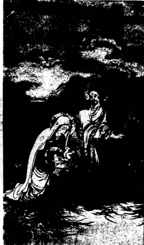
Kristaus užgimimas, japonų dailininkas.