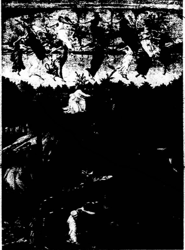
Kristaus gimimas. Dail. Botticelli paveikslas.

ciatyvos reikšti savo jungtinę jėgą — paskelbė deklaraciją už jungtinę Europą politiniu, ūkiniu, kariniu atžvilgiu, kuri turėtų būti įvykdyta palaipsniui iki 1980. J. Europa palaikys santykius su JAV kaip lygus su lygiu, turėdama savo skirtingų interesų (pvz. nafta). Anot vieno pareiškimo, ji nebus trečioji jėga, bet antrosios jėgos antroji dalis.