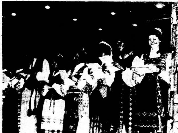
Pirmieji žilvytiečiai, įstoję į mokyklą, Magd. Vinkšnaitienės vadovaujama jaunimo sambūrio dešimties metų, skaito poezijos pynę Žilvyčio dešimtmecio ir Vyt. Alanto "Visuomenės veikėjų" pvystatymo proga Sao Paulo lapkričio 18.

Pasaulio lietuvių jaunimo III kongreso ruošia, prasidėjusi Argentinoj studijų dienomis. Brazilijoj pradėta pirmą studijų dieną lapkričio 15. BLB val-