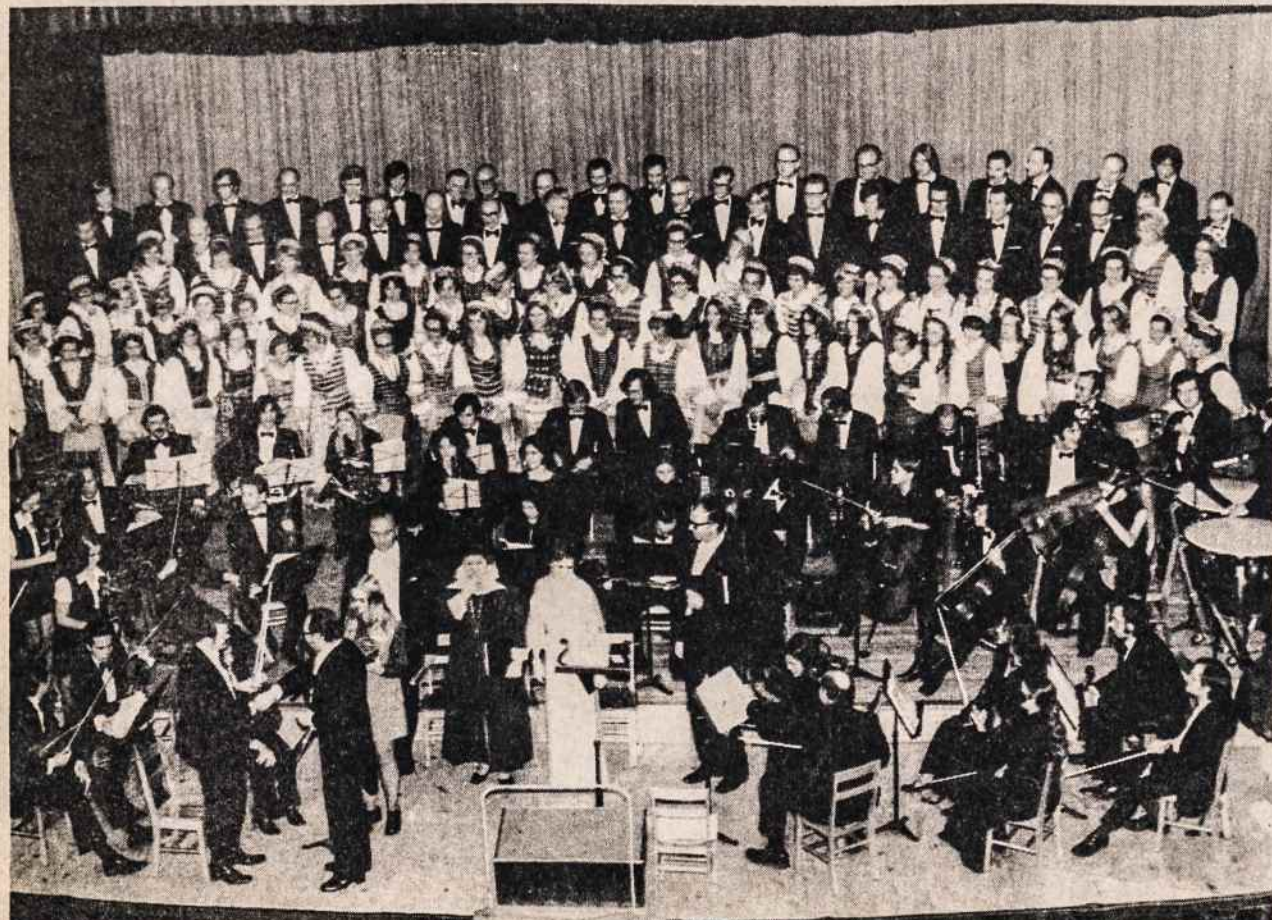
Vlodo Jakubėno kūrinių koncerte Chicagoje.