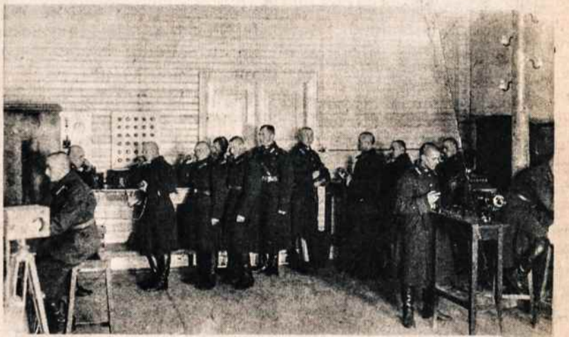
Pirmaisiais metais Karo mokyklos kariūnų ryšių rinkoje.