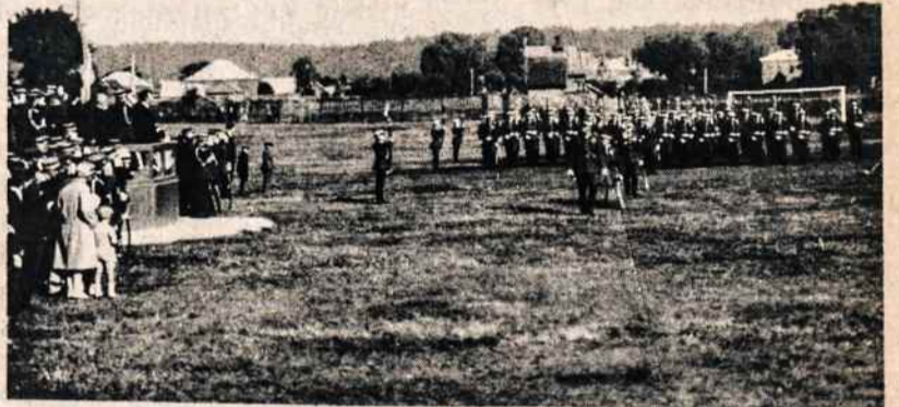
Karo mokyklos paradas.