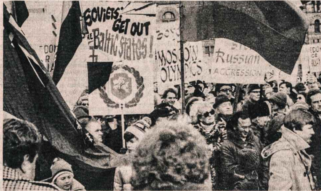
Toronte vasario 9 d. 2 v. popiet prie miesto valdybos namų buvo surengtos visų tautų demonstracijos prieš Sovietų Sąjungą. Svečių ir kalbėtojų tarpe dalyvavo aukštų miesto ir valdžios pareigūnų, net užsienio reikalų ministrė Flora MacDonald, kuri savo kalboje griežtai pasmerkė rusų imperializmą.