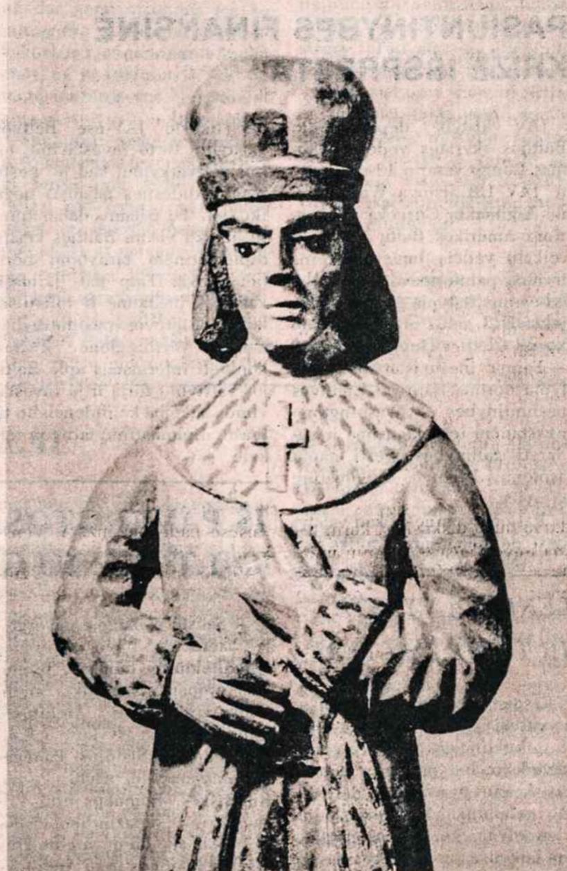
Šv. Kazimieras, lietuvių liaudies skulptūra, iš Plungės apylinkės. Meisteris nežinomas.