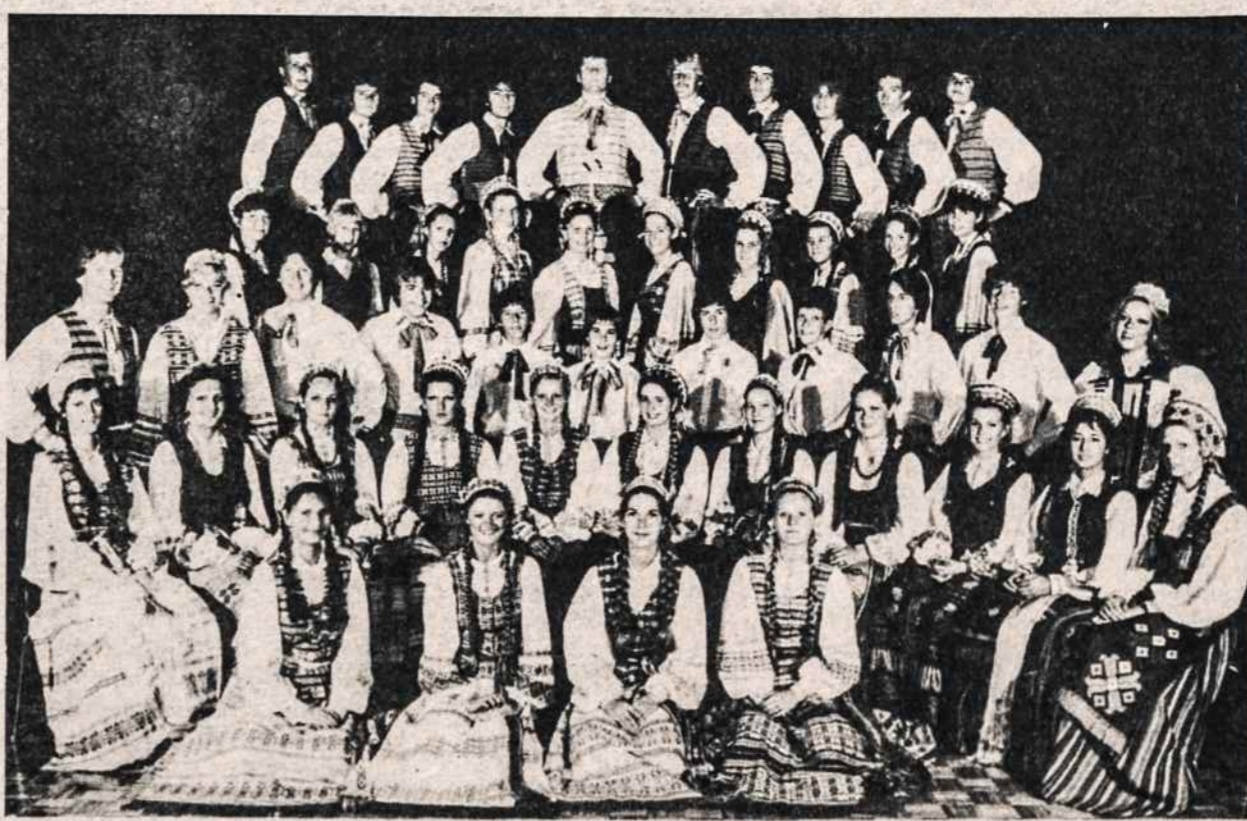
Toronto tautinių šokių ansamblis atžalynas atvyksta į Bostoną ir kovo 8, šeštadienį, 7 v.v. pasirodys Liet. Piliiečių salėje So. Bostone. Jie atliks dainų ir šokių pynę.

Lietuvių festivalis, rengiamas Lietuvos vyčių Vidurio Atlanto apskrities, bus balandžio 20 parapijos salėje. Tai bus pirmas toks festivalis Maspeth. Salėje bus sutelkta daug lietuviškų knygų, plokštelių, pašto ženklų, drožinių, piešinių. Bus lietuviškų valgių virtuvė. Rengia apskrities pirmininkas L. Janonis su specialia komisija. Talkina vietos 110 kuopa. Festivalis skelbiamas ir vietos angliškoje spaudoje. KR