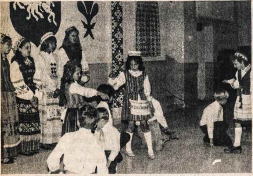
Hartfordo Švyturio mokyklos mažieji šoka "Pupą" per Motinos dienos minėjimą gegužės 11.