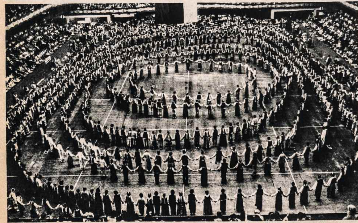
Momentas iš VI-tosios tautinių šokių šventės liepos 6 Chicagoj.