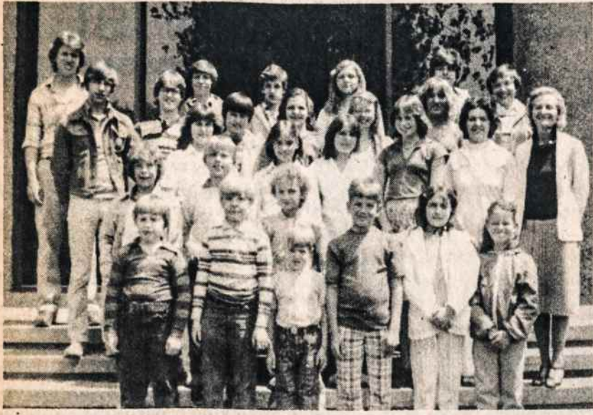
Hartfordo Švyturio mokyklos mokiniai su mokytojais prie Trinity kolegijos pastato, kur šeštadieniais vykdavo pamokas.