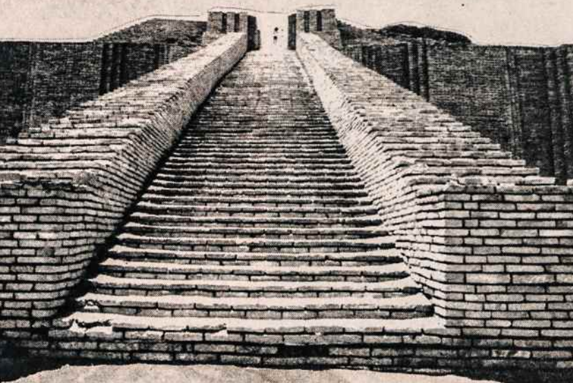
Ur: Ziggurat — kalnas į Dievybę.

Palipu virš pakylės ant molio kauburio. Bent 30-40 metrų nuo piliakalnio paviršiaus. Aplink ziggurat driekiasi miręs Ur mies-