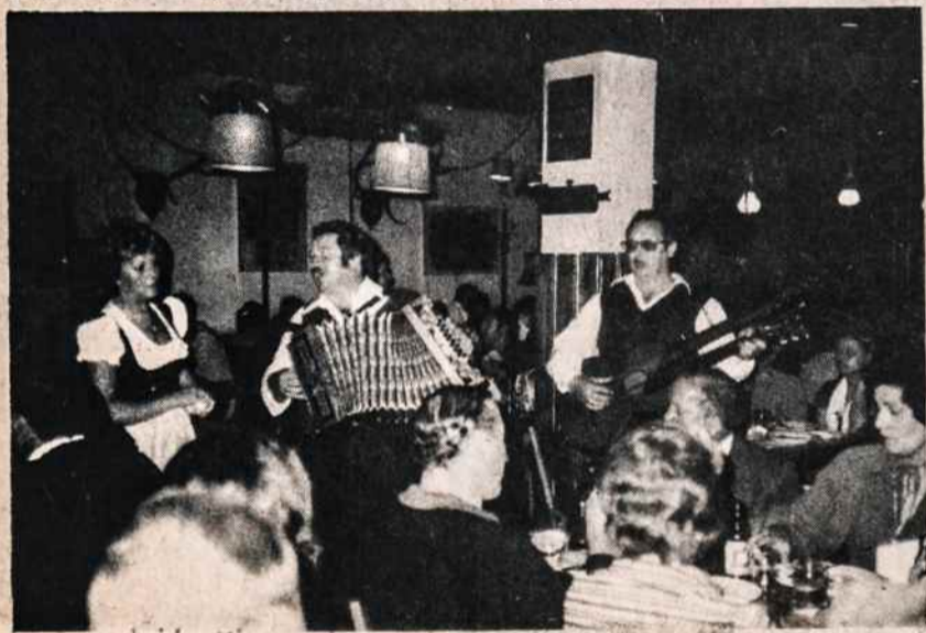
Aplankius "Weinstube" Grizing