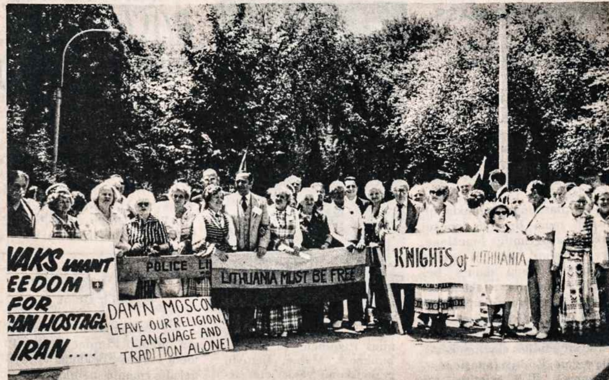
Pavergtų Tautų savaitę New Yorke minint, liepos 13 New Yorko Centrinio Parko muzikos aikštėj vyko speciali programa. Čia matyti gausios lietuvių grupės dalis.