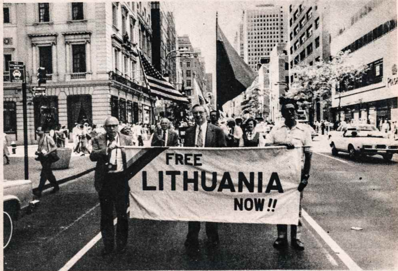
Pavergtų tautų savaitės parade lietuvių grupė eina New Yorko 5 Ave.