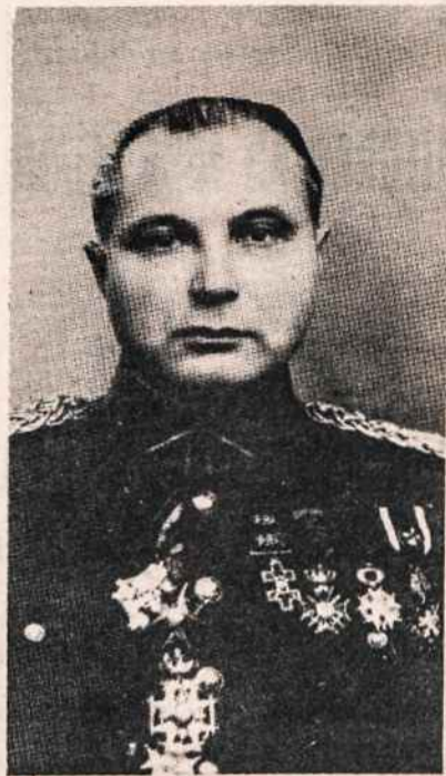
Gen. štabo pulk. J. Lanskoronskis

ro akademiją, kurią baigė 1929. Grįžęs buvo divizijos štabo viršininkas, paskui generalinio štabo II skyriaus viršininkas, 6 pėstininkų pulko vadas, o nuo 1937 metų rudens karo attache ir Belgijoje. Paskutiniu metu buvo pulkininku pakeltas 1929 metais.