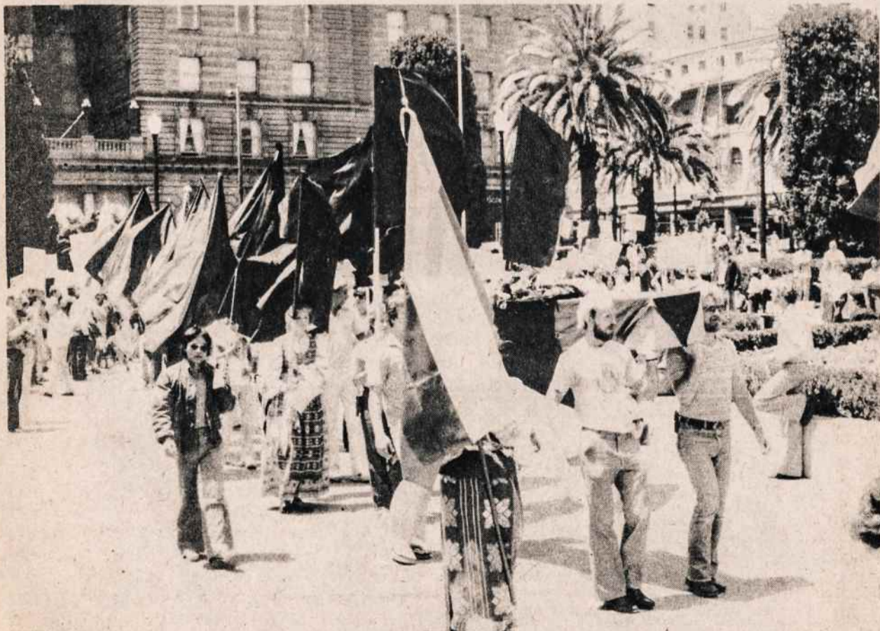
Demonstracijos San Francisco, Calif., pavergtų tautų savaitės proga. Lietuviai neša karstą, už jo — juodos vėliavos. Tai buvo liepos 20.