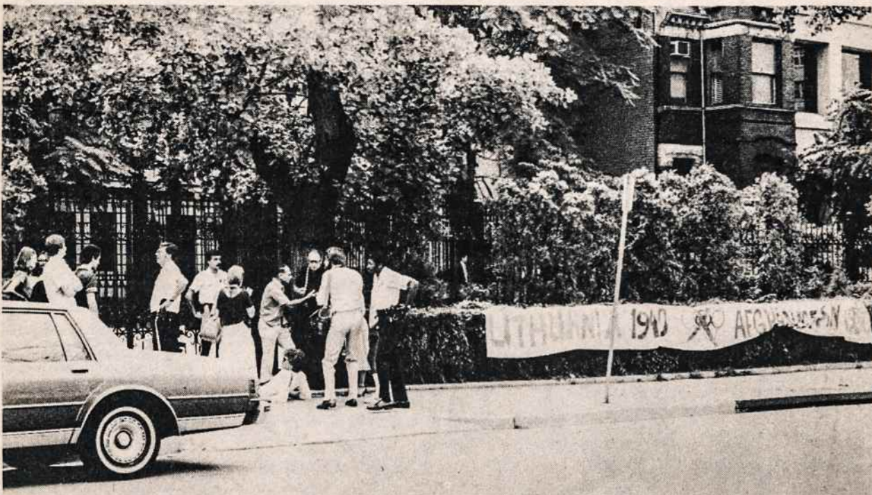
Demonstruojant liepos 19 prie sovietų ambasados Washingtone — dalis prisirakinsiu demonstrantų prie vartų ir plakatas