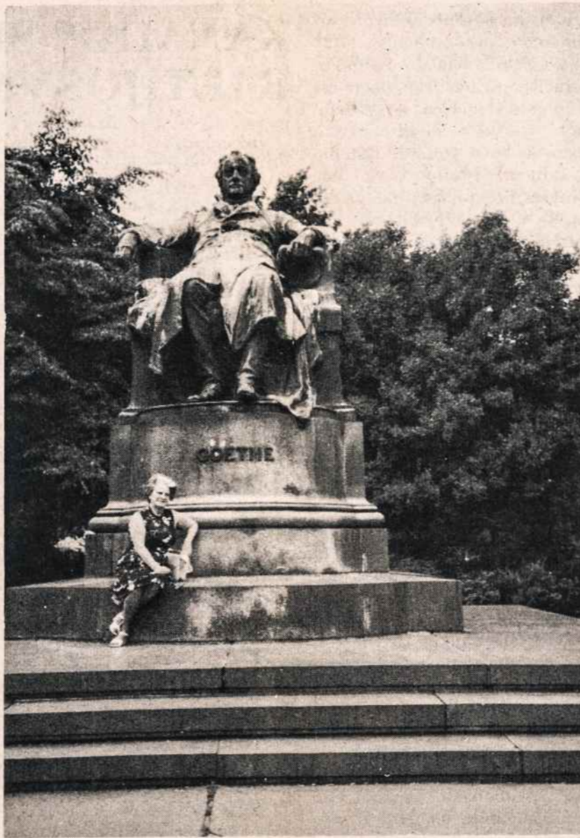
Šių atsiminimų autorė prie Goethės paminklo Vienoj

Kai pagaliau pasibaigia oficialus palociaus lankymas, mes galim išeiti į milžinišką parką, kurio pakraščiuose yra apkarpyti krūmai skulptūrų pavidalais. Spalvingi gėlynai, žaliuojančios alėjos savo nepaprastu grožiu vilioja akį. Parko gale matosi aukštai, baltas pastatas, sudarytas iš įmantrių arkų. Tai buvusios arklidės, o prie jų esančiame marmuriniame baseine buvo maudomi karališkieji arkliai... Baseino kraštus puošia arklių ir jų palydovų skulptūros... Senuose medžiuose miega šimtmečiai. Jie kadaise stebėjo imperatorių ir jų svitą, vaikščiojančių žvyruotais takeliais. Man rodėsi, kad kiekvienu momentu išgirsiu nedrąsių dvaro freilinių juoką ir jų sunkaus šilko drabužių šnerėjimą... Požeminiu traukiniu grįžom į miesto centrą irėjom tylėdami modernios Vienos gatvėmis. Kur pakeli akis, visur paminklai. Vienoj vietoj užtinku Schillerio institutą ir muziejų. Prieky stovi natūralaus dydžio Schillerio statula, o priešais jį sėdi Goethe, sutaršytas plaukais, vėjo išdrikytais drabužiais, ir žvelgia į apačią ramiu, žmogaus sielą siekiančiu žvilgsniu. Nutariu padaryti nuotrauką prie Goethės kojų. Laikas bėga greitai, ir nesinori praleisti vakaro veltui. Viešbuty užsiregistruojam ir vakarinę ekskursiją. Tai žvilgsnis į dainuojančią ir besilinksmančią Vieną nakties metu. (Bus daugiau)