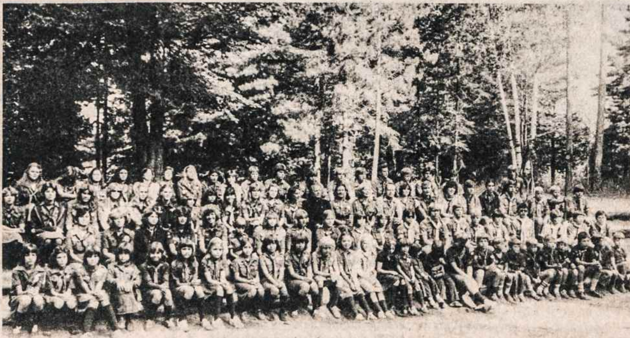
Jie pasivadino Atžalynu. Tai Clevelando ir Detroito skautai ir skautės, stovyklavę pranciškonų vasaros stovyklavietėje Wasaga Beach. Kanadoj. Nuotr. V. Bacevičius