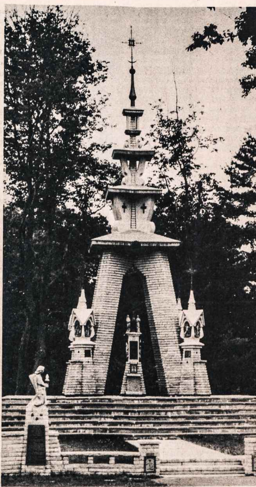
Kryžiaus kelių paminklas, dedikuotas žuvusiems dėl Lietuvos laisvės.