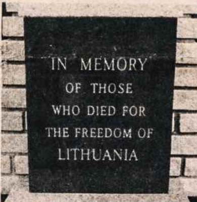
Dedikacinė lenta Kryžiaus Kelių paminkle

Dabar visa surasta, sugrąžinta į vietą, sutaisyta.