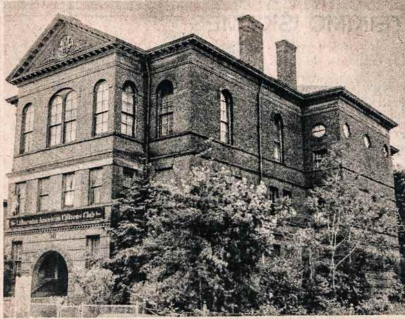
Hartfordo, Conn., Lietuvių klubas prieš pertvarkymą