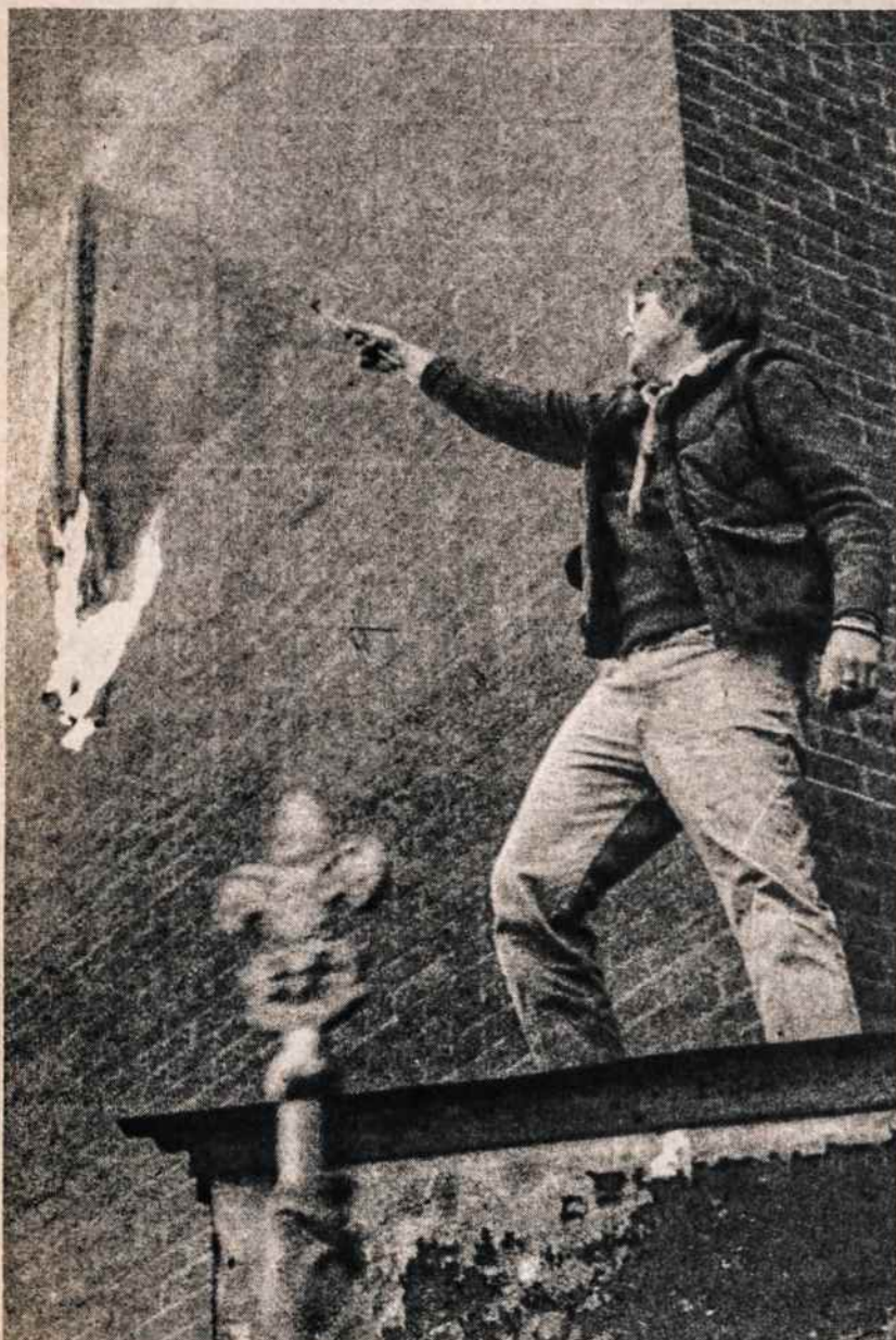
Demonstracijose prie Jungtinių Tautų rugsėjo 27 sudegina Sovietų Sąjungos vėliavą.

Būsimojo prezidento Ronald Reagan privatus pranešimas tvirtina, kad ginklų kontrolės ir nusiginklavimo agentūra daugiau pinigų išleis susitarimų su Sov. S-ga reklamai, kaip jos jau veikiančių susitarimų pažeidimui sekti.