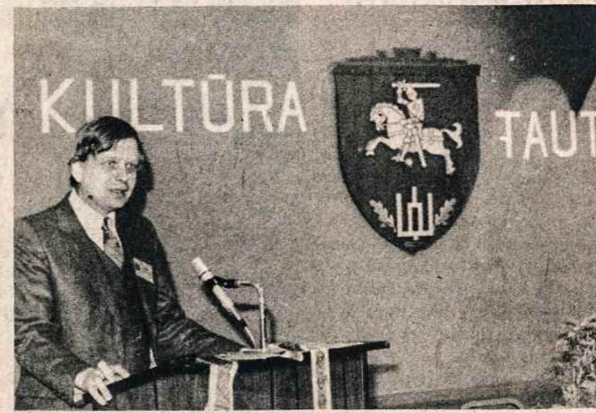
Clevelande lapkričio 22-23 įvyko JAV LB apygardų ir apylinkių kultūros darbuotojų konferencija, kuri buvo pradėta prof. Tomo Venclovo paskaita.

Savo paties pasisakymu, Tomas Venclova yra "istorinis optimistas", tikis tautos išlikimu. Jis vėl grįžta prie to, kad emigracinė visuomenė turėtų daugiau domėtis dviem Lietuvoj egzistuojančiom kultūrom ir dėti pastangas suorganizuoti tarp tų dviejų kultūrų tamprų ryšį. Reikia domėtis gyvenimu Lietuvoj iš laisvo žmogaus pozicijos. Paskaitininkas absoliučiai tiki būsima Lietuvos laisve. Jis skatina visus veržtis savo karjerose pasauliniu mastu ir visomis aplinkybėmis pasirodyti savo lietuviškumu. Rytų Europoj Lietuva išsikariavusi sau reikšmingą ir svarbią vietą. Ir amerikiečių spauda dabar turi pūkių supratimą apie padėtį Lietuvoj, apie mūsų disidentus ir jų veiklą. Lietuva šiuo metu yra garsesnė už Latviją, Estiją ar Ukrainą. "Kiek įmanydami garsinkim jos vardą", skatino paskaitininkas. Riba tarp poli-