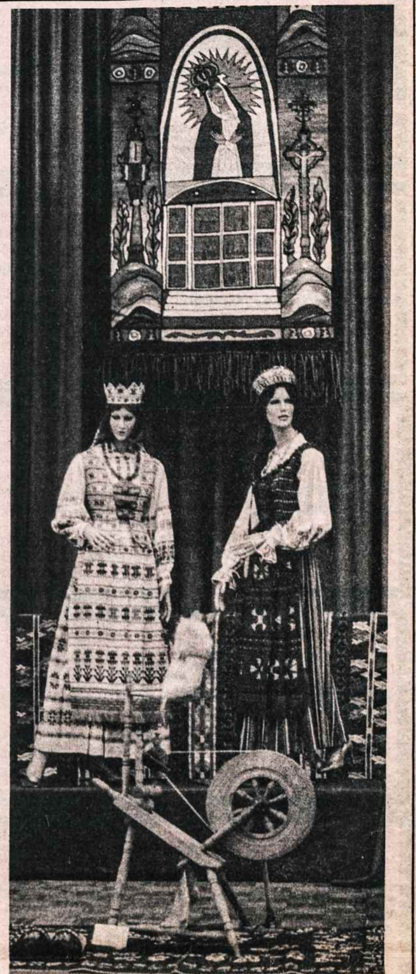
Iš tautodailės parodos Kultūros Židinyje. Gilumoj aukštai — Aušros Vartų kilimas, vidury du manikėnai su tautiniais drabužiais, prieky — ratelis ir žemaitiškos klumpės, kilimas.

Giliai sujaudintas mano giminių, kolegų dailininkų, draugų ir prietelių užuojautų pareiškimu gėlėmis, paštu, vizitais ir telefonais dėl man padarytos