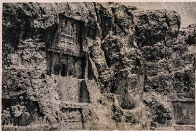
Naqš — 1 — Rustam. Darijaus I kapas. Kairėje Romos imperatorius klūpo prieš Persijos šachą (183-184).

Kadaise šiuo slėniu ėjo — iš-ėjo ir grįžo — Kiro armijos karui už gerumą ir šviesą. Lėta armija, bet su sparnuota idėja. Mylėti savo tautą, kitų tautų nepaniekinant.